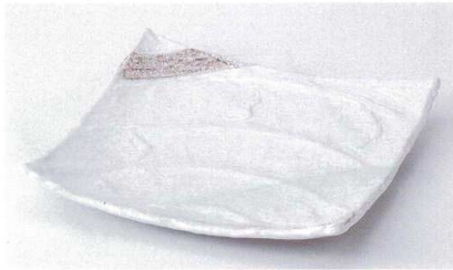
ネ178-16 白マット波型23cm正角皿 22.7×22.7×3.2cm 2,500円