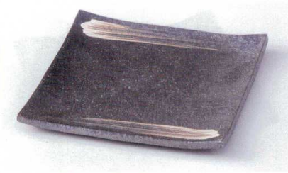
×178-02 黒窯変刷毛目7.0角皿 21×21×2cm 2,750円 ×178-03 黒窯変刷毛目5.0角皿 15×15×1.5cm 1,650円