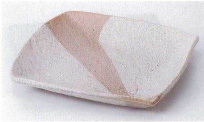
オ178-17 リプル角多用皿(大) 24×23.5×3.5cm 2,500円 オ178-18 リプル角多用皿(中) 19×19×3cm 1,200円