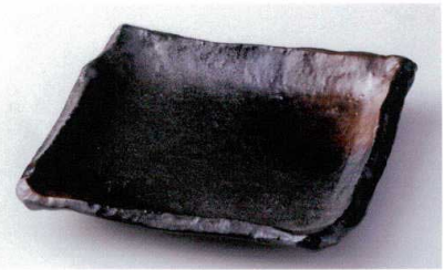
ホ178-22 金茶吹23cm角皿 23×23×4cm 2,100円 ヤ178-23 金茶吹匠19cm皿 18.6×18.8×3.8cm 1,200円