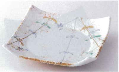
ト178-14 唐津花つなぎ盛皿 21×21cm 2,550円 ト178-15 唐津花つなぎ6.0皿 18.4×18.4cm 2,150円