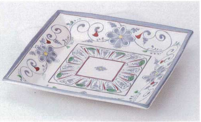
カ178-19 安南正角深口皿大 20.5×20.5×3.2cm 2,300円