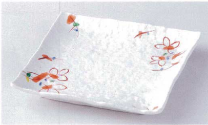
ミ178-21 粉引赤絵小花正角7.0皿 22×22×3cm 2,300円