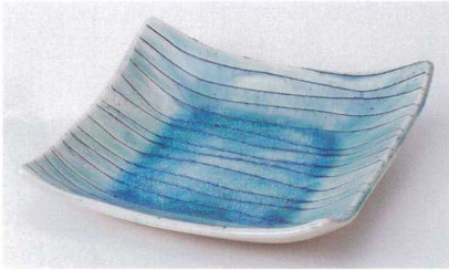
ホ178-08 湖水盛皿 23.5×23.5×4.8cm 2,700円