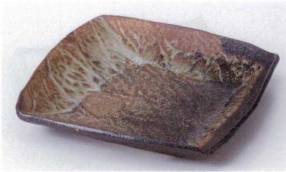
ホ178-12 武山角8.0皿 24×23cm 2,600円 ホ178-13 武山角7.0皿 19×19cm 1,220円