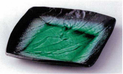
タ178-09 エメラルドグリーンスクエア大皿 23.7×23×3.5cm 2,600円