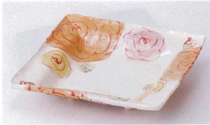
ツ178-06 色彩フラワー正角段付皿 20.5×20.2×4.7cm 2,700円 ツ178-07 色彩フラワー四角皿 17.5×17.3×3.2cm 2,250円