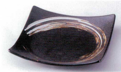
イ178-10 栗色刷毛目合皿 大 24.5×24.5×4.5cm 2,600円 イ178-11 栗色刷毛目合皿 中 20.5×20.5×3.5cm 1,600円