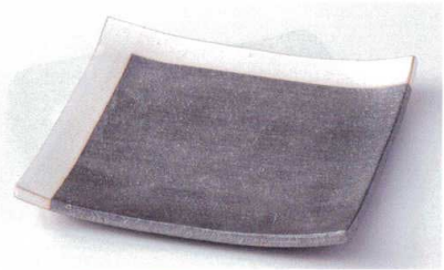
×178-04 黒窯変角白掛け分け6.8角皿 20.5×20.5×1.5cm 2,750円 ×178-05 黒窯変角白掛け分け5.1角皿 15.5×15.5×1.5cm 1,650円