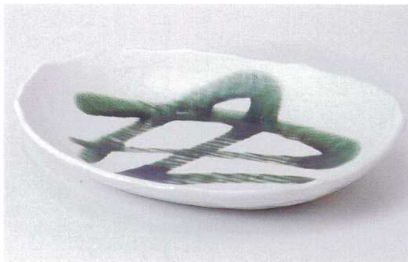
ツ186-15 白マット織部流し大皿 27×20.5×4cm 1,750円