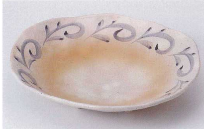
ア186-01 Orange盛鉢 23.7×20.5×5cm 2,600円