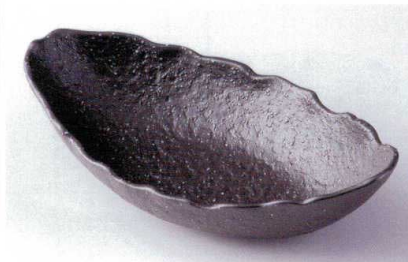
ヤ186-08 星座さざ波舟型盛鉢 28.2×15.2×6.7cm 2,200円