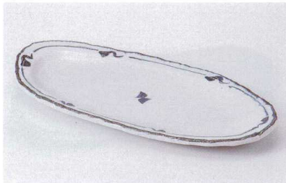
オ186-07 かいらぎ楕円長皿 32×15×3cm 2,250円