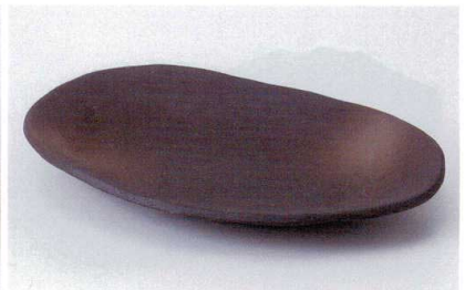
ネ186-13 備前マルチプレート(大) 27.2×18.1×3.4cm 1,900円