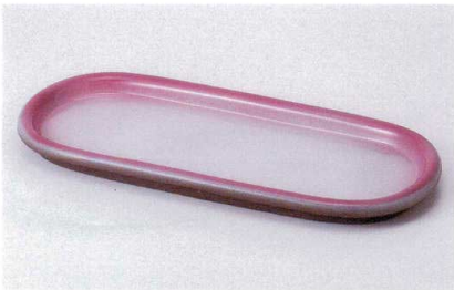
口186-17 瀏ピンク小判長皿 31.7×13.8×2cm 1,500円