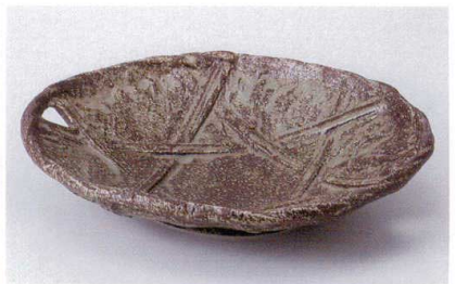
ミ186-19 窯変和紙盛鉢 24.8×20.3×5.5cm 1,400円