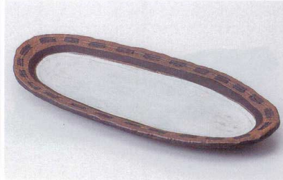
ツ186-02 古代塚尺0.5皿 31.8×14.8×2.8cm 2,850円