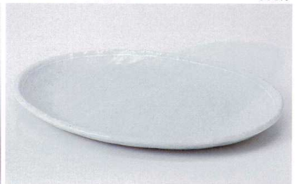
口186-09 オフケ白ライン9.0小判皿 27.3×20.3×2.3cm 2,130円 口186-10 オフケ白ライン6.0小判皿 17.8×13.4×2cm 900円