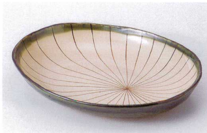
口186-12 織部櫛目楕円8.0鉢 24.5×19×3.5cm 1,900円