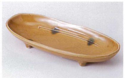
ア186-16 織部流し四ツ足尺皿 31.5×13×5cm 1,450円