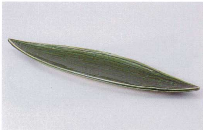
カ186-11 織部笹長皿 38.3×9×2.6cm 2,000円