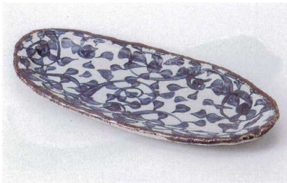
オ186-14 タコ唐草楕円長皿 32×15×3cm 1,900円