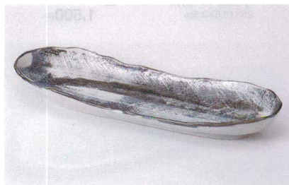
ミ187-16 藍染舟形長皿 33.3×10.5×4cm 550円