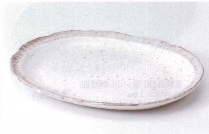
ミ187-05 白唐津楕円盛皿 28.5×21.8×2.5cm 1,300円