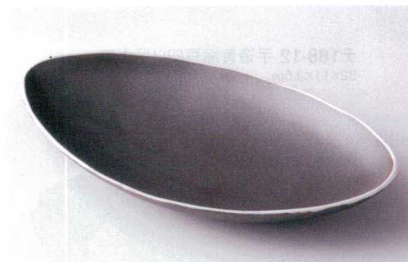
ア187-13 黒釉オーバル皿 27.7×15.7×4.5cm 900円