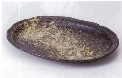
ミ187-04 黒備前楕円盛皿 28.5×21.8×2.5cm 1,300円