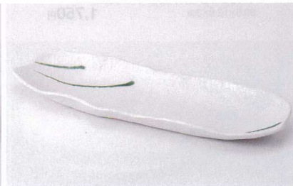
ミ187-18 白釉織部流し岩肌長皿 34×11.2×3cm 550円