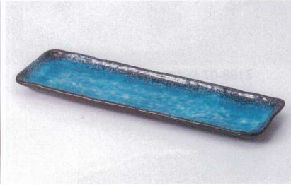
タ187-12 オーシャントルコ長角皿 32.4×9.6×2.2cm 920円