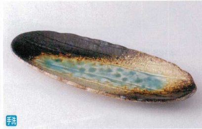
イ187-11 和三彩手造長皿 33×13.8×3cm 950円