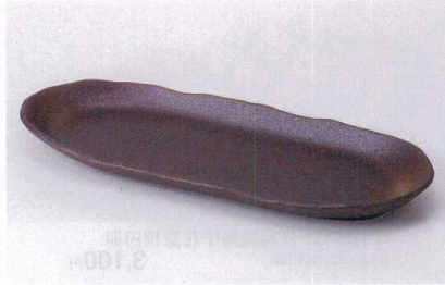
ト187-02 南蛮舟型サンマ皿 34.5×13.3×2.8cm 1,350円