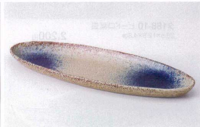
ア187-15 瑠璃オーバルトレイ 32.3×11×2.4cm 770円