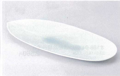
タ187-06 淡青モア長皿大 32.2×13.3×2.2cm 1,000円 タ187-07 淡青モア長皿中 21×11.2×1.8cm 620円 タ187-08 淡青モア長皿小 13.5×9×1.6cm 400円