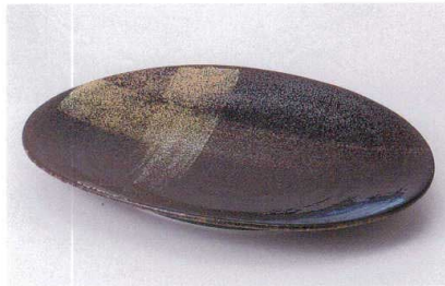
モ187-09 羽衣たわみ8.5楕円皿 26×18.7×3.2cm 960円 モ187-10 羽衣たわみ6.5楕円皿 20×14.2×2.2cm 560円