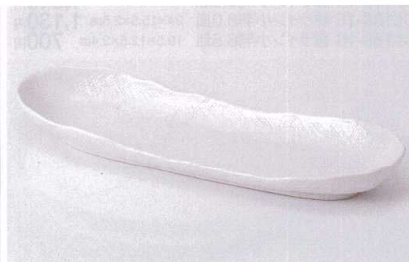
ミ187-17 白マット舟形長皿 33.3×10.5×4cm 550円