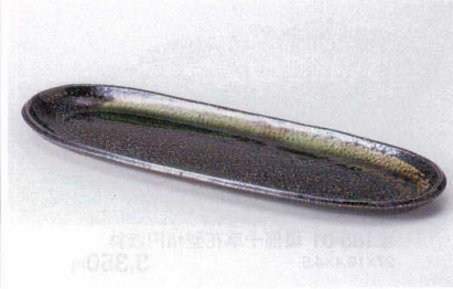
タ187-03 織部流フェスタ皿 34.3×11×1.7cm 1,300円