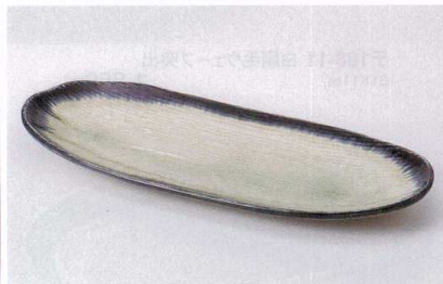
ト187-14 うのふ流し笹型多用皿 30.5×12.5×3cm 870円