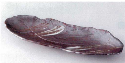
テ188-11 白刷毛ウェーブ突出 31×11cm 1,850円