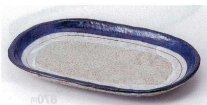
オ188-14 紺ライン小判9.0皿 27×18×3cm 1,640円 オ188-15 紺ライン小判8.0皿 24×15.5×2.5cm 1,130円 オ188-16 紺ライン小判6.5皿 19.5×12.5×2.4cm 700円