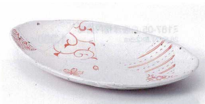
ネ188-08 赤絵古窯楕円焼き物皿 24.6×14.7×3.0cm 2,250円