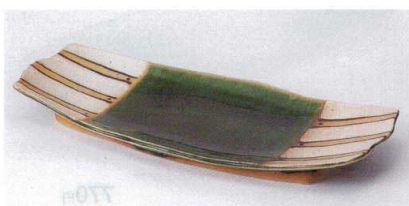
ツ188-13 塗分織部十草長皿 30.5×12.8×3cm 1,750円