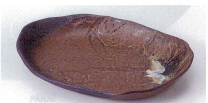
オ188-17 武山パーティー皿 25×18.5×3.5cm 1,500円