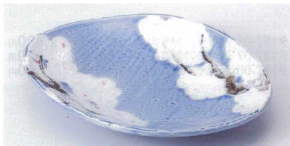
ミ188-07 桜木コバルト三つ足楕円鉢 23.5×17.8×4.2cm 2,400円