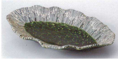
オ188-01 織部十草花型楕円浅鉢 27×16.4×4.5 3,350円