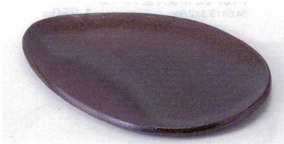
ネ188-05 黒いぶし卵型皿 23.4×16.8×1.5cm 2,585円