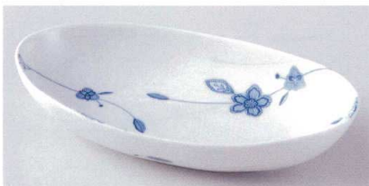
ト188-18 フルーベル楕円盛鉢 26.5×15.5×5cm 1,400円