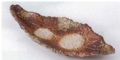
タ188-10 ビードロ葉皿 29.5×12.8×4.8cm 2,200円