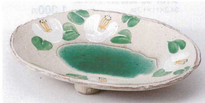
オ188-04 グリン流椿絵楕円浅鉢 23.5×18.0×3.8cm 2,560円