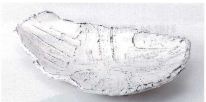
ツ188-09 粉引拭取り変形9.0皿 27×16.5×5cm 2,250円