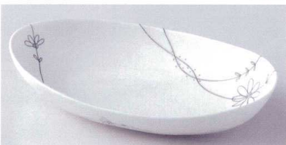
ツ188-19 フラワーライン楕円大鉢 26.5×15.5×5cm 1,400円