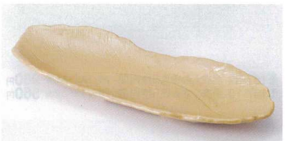
テ188-12 手造黄瀬戸四ツ足大皿 32×11×3.5cm 1,850円