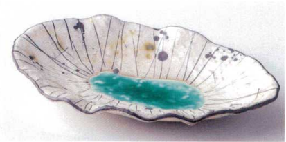
ミ188-03 雨音楕円皿 27×16×4.8cm 2,700円