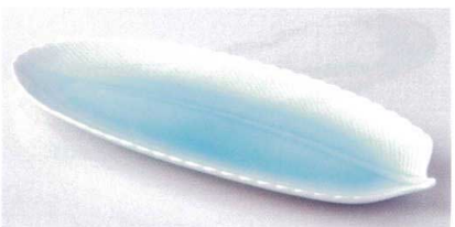
ヤ188-20 青白磁リーフ長皿 27.5×12×2cm 1,350円