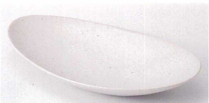
ネ189-14 白釉オーバルディッシュ中 23×12.5×3cm 870円