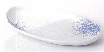
ツ189-01 ゴス吹楕円皿 26×13×3.2cm 1,250円