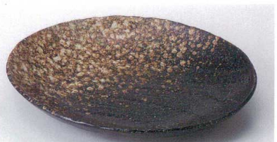
ミ189-15 黒備前縄目楕円皿 24×19.5×3.5cm 850円