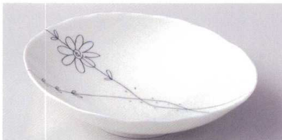
ツ189-13 フラワーライン楕円7.0深皿 22.5×17.5×5cm 880円