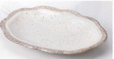
ミ189-22 白唐津雲型皿 22×17×3.2cm 650円