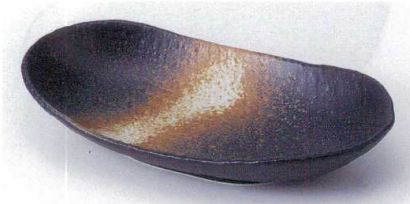
ト189-20 黒吹まゆ型 25.3×13.8×4.5cm 730円