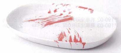
ロ189-07 朱刷毛小判8.0皿 23.5×16.8×2.7cm 1,150円