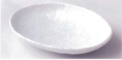
ネ189-11 錆ウズ22cm楕円皿 22×16.5×4cm 1,000円