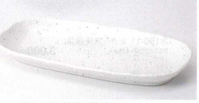
ア189-19 粉引小判型長皿 28.5×13.2×2.8cm 800円