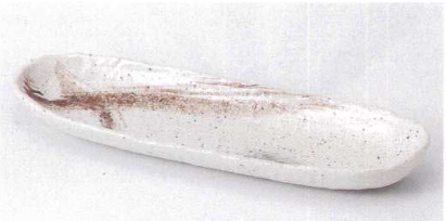
ヤ189-21 みやまトレー皿 30.5×10×3.3cm 720円