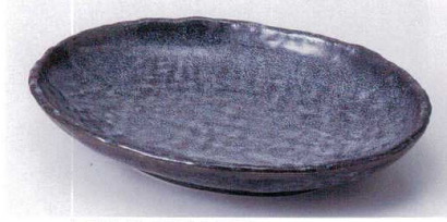
カ189-10 栗石小判皿 22.2×16.3×3.8cm 1,040円