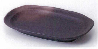
ネ189-17 黒備前楕円皿大 24.5×16.2×3.0cm 850円 ネ189-18 黒備前楕円皿小 20.0×13.0×2.0cm 570円