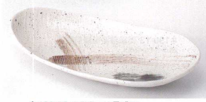
ヤ189-16 みやま三つ足盛皿 28×13.5×5cm 850円