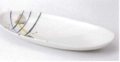
キ189-12 あけぼの緑彩舟型鉢(大) 24×13×4cm 930円