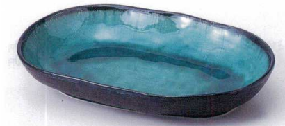
オ189-04 ヒスイ天目小判皿(大) 20×14×3.5cm 1,200円 オ189-05 ヒスイ天目小判皿(中) 16.8×11.5×3cm 700円 オ189-06 ヒスイ天目小判皿(小) 11.4×8.5cm 420円