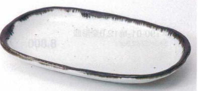
タ189-08 藍8.0小判皿 24.3×16×2.5cm 1,100円 タ189-09 藍6.5小判皿 19.7×12.5×2.3cm 700円