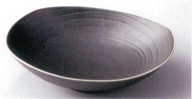
ア189-03 黒釉だ円盛皿 22.8×19.3×5.6cm 1,200円