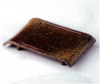
ミ190-04 手造り備前風弓型8.5前菜長角皿 26.5×16.5×3.8cm 4,300円 ミ190-05 手造り備前風弓型7.0長角皿 21×10.3×3.5cm 2,400円