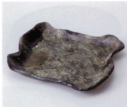
ネ190-11 手作り窯変盛皿 23.5×21.0×4.0cm 3,000円