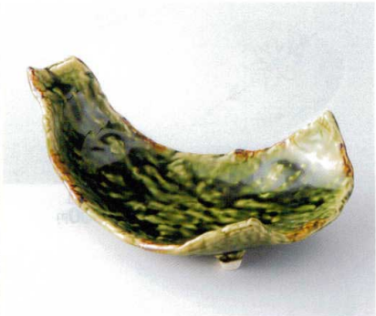
ネ190-13 総織部変形扇前菜皿 26.5×14.5×9.0cm 2,700円