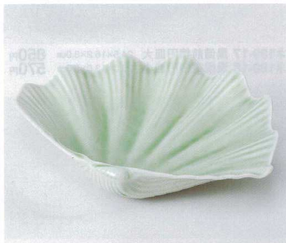
ト190-15 ヒワシェル盛皿 26.5×20×4.3cm 2,100円