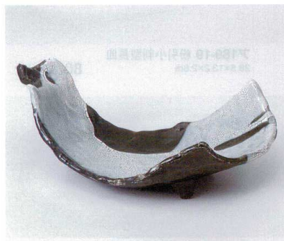
ツ190-14 カイラギミツ足扇皿 26.5×14.5×8cm 2,350円