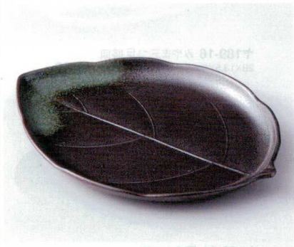
ホ190-16 グリーン吹木の葉特大皿 29×21×2.5cm 2,100円