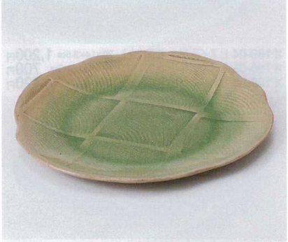
ミ190-09 緑灰釉花形8.5皿 26.2×2.2cm 3,300円 ミ190-10 緑灰釉花形6.5皿 20.4×2cm 2,200円