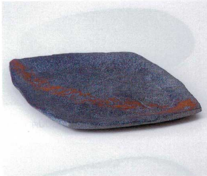
×190-01 暁12.8変形皿 38.3×27×2.5cm 8,800円