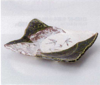
カ190-08 志野織部草花大向付 26×19×4.5cm 3,350円