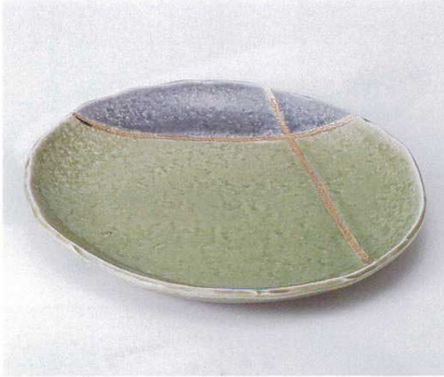
ア190-02 若草金彩10.0皿 28.8×25.7×2.8cm 4,200円 ア190-03 若草金彩8.0皿 24.7×22.5×3cm 2,850円