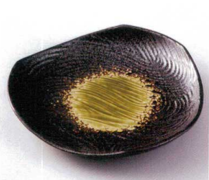
193-11 鉄仙花ヒワ7.0八角皿 22.7×2.9cm 2,560円