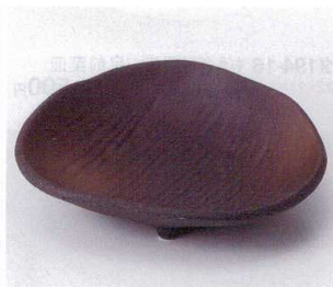
193-16 備前風変形丸鉢(大) 18.3×17.2×4.4cm 1,700円