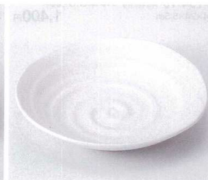
193-23 風流7.5皿 φ23×3.7cm 720円 193-24 風流6.5皿 φ20.5×4.2cm 500円 193-25 風流5.5皿 φ16.6×2.7cm 350円