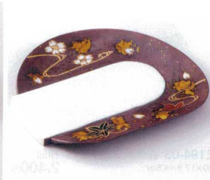
193-04 金流水変形前菜皿 22.5×20.5×2.5cm 3,000円