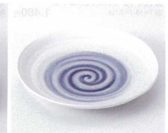
193-26 紫クリスタル6.5深鉢 φ20.5×4.2cm 480円