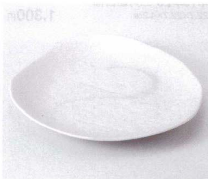
193-21 風流三角8.0皿 24×22.7×3.6cm 770円 193-22 風流三角6.5皿 20.2×19.5×3.8cm 500円