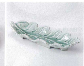
193-14 濃青磁葉型大長皿 31.7×11.7×5.5cm 2,140円