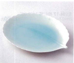
193-15 青白磁リーフ大皿 24.5×19.6×2.7cm 1,750円