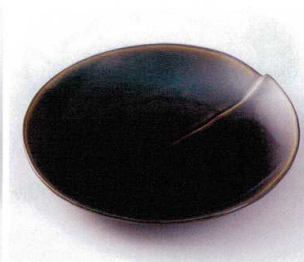
193-08 織部はす型8.0皿 φ24×3cm 2,700円