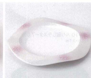
193-13 ピンクボカシラスター和皿 19.5×2.5cm 2,400円