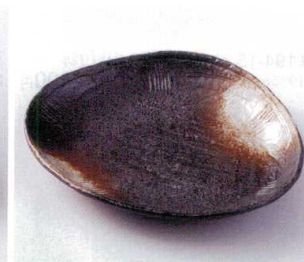
193-17 白吹天目三角大皿 22.5×19.2×3.6cm 1,500円