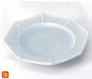
193-07 青白磁雷門八角皿 22.7×22×3.2cm 2,800円