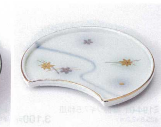
193-06 白吹竜田川半月前菜皿 16×20cm 2,800円