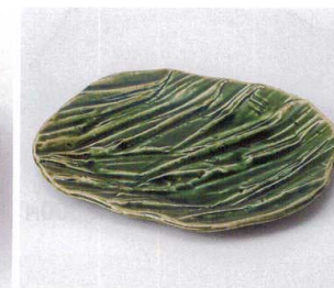
193-09 織部楕円型波彫和皿 20.5×17.5×2.2cm 2,700円