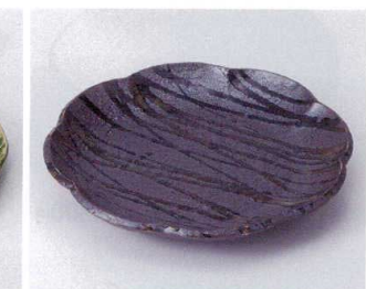
193-10 黒織部流し8.5花型皿 26.5×3.8cm 2,650円