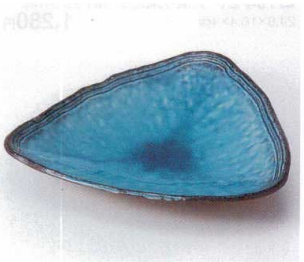
193-19 藍染スカイルー三角皿(大) 22.5×3.7cm 1,200円 193-20 藍染スカイルー三角皿(小) 14×2.5cm 550円