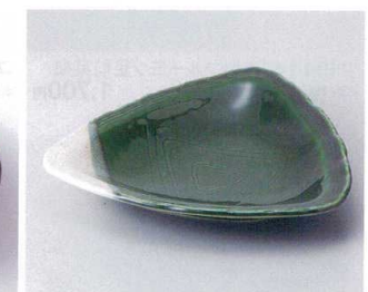
193-18 織部三角7.5皿 23×23×4cm 1,250円