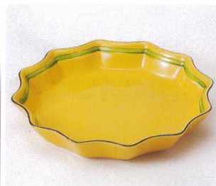
193-12 黄釉十二角口変り皿 18.6×3.2cm 2,500円