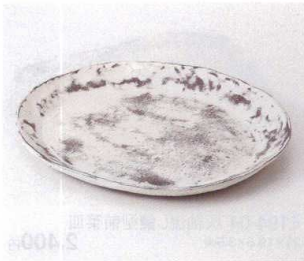
193-01 布目雲海楕円皿(大) 24×21×2.5cm 3,000円 193-02 布目雲海楕円皿(中) 18.5×16.5×2cm 2,200円 193-03 布目雲海楕円皿(小) 14×13×1.8cm 1,200円