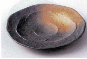
ソ194-25 瀏サビ巻粉引荒瀬前菜皿 21×17×4cm 860円