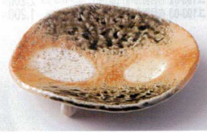
タ194-08 満月6.0皿 19×18.5×4cm 2,200円