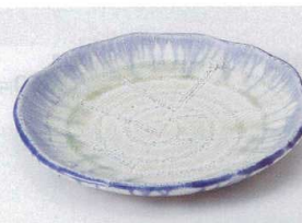
ツ194-09 カイラギくしめ波型6.5皿 20×2.5cm 1,900円