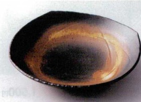
ネ194-19 黒備前つゆ草8.0浅鉢 24×24×5.5cm 1,400円