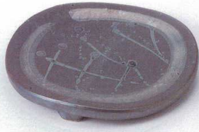
ト194-02 黒釉銀彩丸皿 φ18.5×2.5cm 2,600円