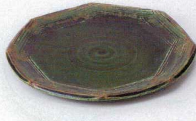
ミ194-01 織部ソギ7.5和皿 φ23.3×2.2cm 3,100円