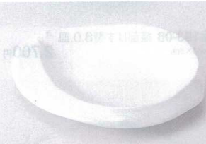
カ194-11 強化白釉ちぎり6.5寸皿 20×16.5×3.5cm 1,700円