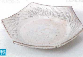
テ194-06 粉引柳目六角皿 19.5×17.5×4.5cm 2,300円