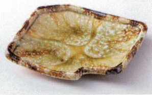
ミ194-04 灰釉流し鍵型前菜皿 21×19.5×3.5cm 2,400円