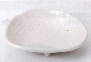
カ194-12 強化白釉ちぎり4.5寸皿 13.8×11.5×3.4cm 1,000円