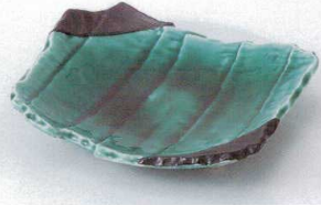
ミ194-03 寄せ木交趾グリーン和皿 20×17.8×4.5cm 2,400円