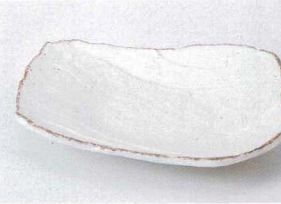
ヤ194-23 みやこ粉引手造り5.0皿 15.5×13×3cm 460円