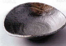
イ194-05 黒備前扇鉢 21.5×19×5.5cm 2,300円