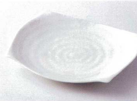
ヤ194-22 みやこ粉引手造り8.0皿 24×20×3.5cm 1,180円