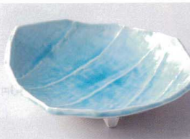
ツ194-14 マリンブルーミツ足前菜皿 23×19.5×5.5cm 1,700円