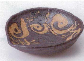
ユ194-15 結晶渦字紋6.5片口鉢 φ19×5cm 1,600円