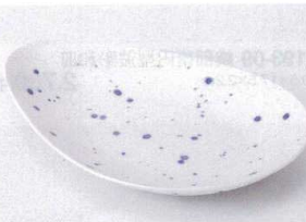
タ194-10 ルリ散しラスター7.0皿 21.5×15×3.7cm 1,800円