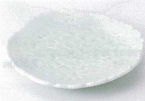
タ194-16 もえぎ砂目ミツ足前菜皿 22×21×4.3cm 1,500円