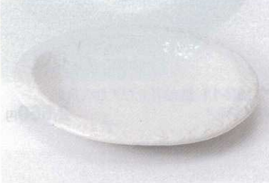
モ194-17 粉引帽子型7.0皿 21×23.5×3.3cm 1,400円