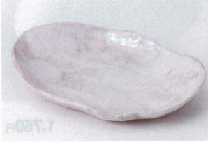
ロ194-21 手作り風志野楕円多用皿 24.8×16.4×4cm 1,280円