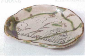
ト194-07 織部流し7.0半月皿 21×18×2.5cm 2,230円