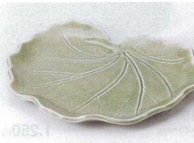
カ194-18 つわぶき23cm中皿 22.7×18.7×2.7cm 1,480円