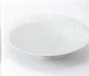
モ199-04 快山窯 青白磁牡丹彫7.0高台皿 22.5×5.3cm 7,500円