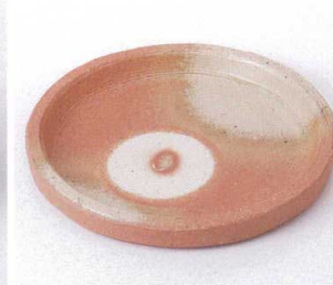
ロ199-12 粉引小花7.0丸皿(赤津焼) φ22.5×3cm 2,900円