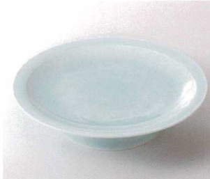
ミ199-02 ウォーターブルー7.5皿 φ23.5×3cm 2,600円