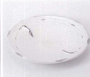
×199-07 古信楽8.0丸皿 φ25×3.5cm 3,000円