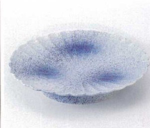
ミ199-03 ウォーターブルー6.0皿 φ20×2.3cm 2,150円