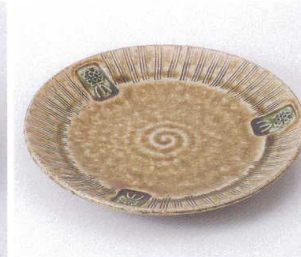
ウ199-16 あめ色平鉢(大) φ25.6×4.8cm 4,100円