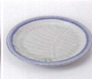
ミ199-15 手造り粉引朱巻フルーツ皿 16×2.2cm 1,600円