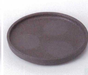
ミ199-19 黒伊賀7.5丸深皿 21.8×3.5cm 2,800円