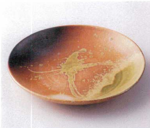
ウ199-05 吹墨菊型8.0高台皿 φ26.4×5cm 3,700円