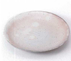
ミ199-17 黒銀河7.5皿 φ23.5×3.3cm 3,800円