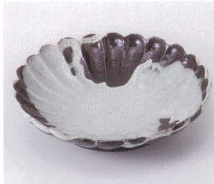
ミ199-06 ヒワ白磁御前型大皿 φ25×5.5cm 3,400円