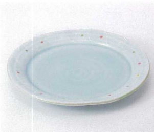
ミ199-01 ウォーターブルー9.0皿 φ27.5×3cm 3,500円