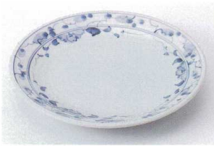
ホ202-04 手描つるバラ6.8皿 φ20.5×3cm 1,300円