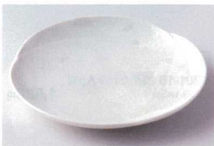
ヤ202-16 みやこ粉引8.0平皿 φ27.5×3.5cm 1,010円