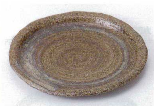
キ202-14 嵯峨野6.0波皿 φ20×2cm 1,050円