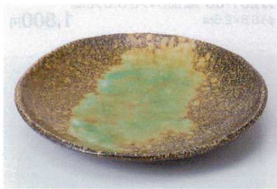
タ202-07 岩清水8.0丸皿 φ24×3.3cm 1,280円 タ202-08 岩清水5.0丸皿 φ17.2×3.2cm 650円