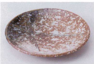
カ202-17 灰釉櫛目手ひねり8.0皿 φ24.3×3.5cm 1,000円