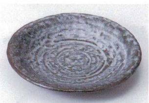
カ202-15 霽石7.0皿 φ23×3.5cm 1,040円