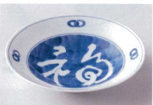
ネ202-21 濃福文字6.0深皿 φ19.3×4cm 1,000円