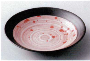
ハ202-01 紅染7.5皿 φ23.7×4.4cm 1,380円 ハ202-02 紅染6.0皿 φ20×4cm 950円