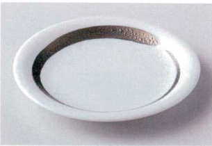
ト202-05 銀大文字6.0皿 φ19.5×2cm 1,300円 ト202-06 銀大文字5.0皿 φ16×2cm 760円