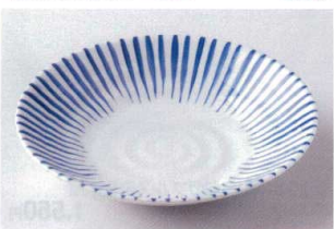
イ202-24 藍十草リップ7.5皿 φ23.7×4.4cm 950円 イ202-25 藍十草リップ5.0鉢 φ16.7×4.5cm 580円