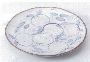
ツ202-13 粉引染付波型6.5皿 19.6×2.5cm 1,150円