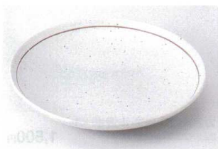
ネ202-22 粉引ライン丸7.5皿 φ23.7×4cm 990円