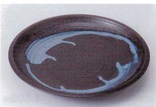
カ202-23 青均窯くくりて8.0皿 φ24.5×3.3cm 950円