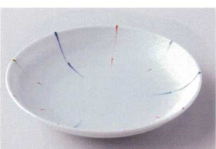
ホ202-28 シンプル十草7.0深皿(軽量) φ22.5×3.5cm 920円