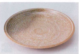
ハ202-26 大地括り手8.0皿 φ24.9cm 930円