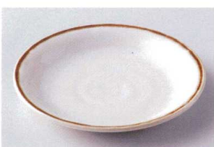
ネ202-27 瀏茶6.5皿 φ19.3×2.7cm 920円