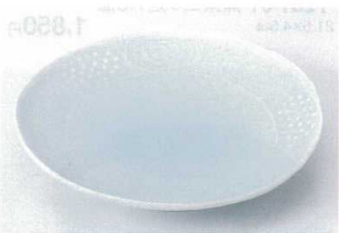
ホ202-11 青白磁芸術6.5和皿 φ20.5×3.2cm 1,200円