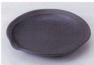
ツ202-12 黒緑片口大皿 25×24.5×4cm 1,200円