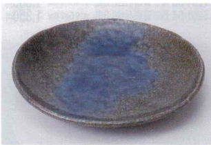
ミ202-09 深海8.0皿 24.2×23.2×3.3cm 1,250円