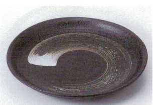
キ202-32 黒結晶刷毛目三ツ山7.0皿 φ23×3cm 850円 キ202-33 黒結晶刷毛目三ツ山5.0皿 φ16.8×3cm 360円