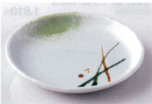
ホ202-10 美濃路玉淵6.5皿 φ20.5×3cm 1,200円