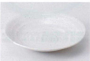
ネ202-18 白萩リップル7.0皿 23.7×4.4cm 1,000円 ネ202-19 白萩リップル6.0皿 20.0×4.0cm 700円 ネ202-20 白萩リップル5.0皿 16.5×3.3cm 580円