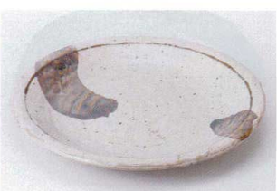
ト202-29 くるみ7.0皿 φ23×3.2cm 900円 ト202-30 くるみ6.0皿 φ19.7×3cm 650円 ト202-31 くるみ5.0皿 φ16.5×2.2cm 480円