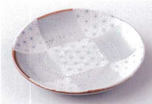
ホ203-05 刺子市松6.0皿 φ18.3×3cm 850円