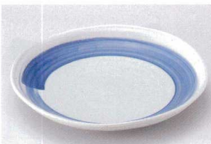
ヤ203-14 ワラ白呉須刷毛7.0丸皿 23.5×3.4cm 760円