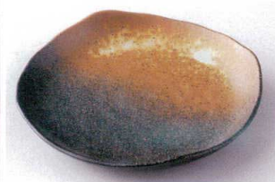
イ203-06 黒信楽7.0皿 20.7×20.7×3.5cm 840円