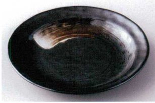
ハ203-03 白刷毛鉄結晶タタキ8.0皿 φ24.5×3cm 860円