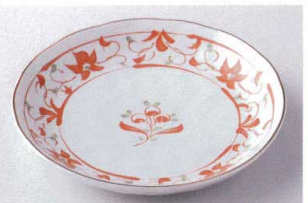
ヤ203-25 赤絵唐草7.0皿 φ21.2×3.5cm 610円