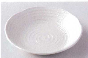
タ203-23 吉祥粉引8.0深皿 φ23.4×4.7cm 620円