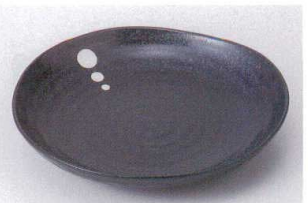
ヤ203-17 ドット黒三角8.0皿 23×4cm 650円