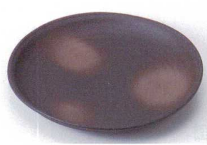
ネ203-01 黒備前7寸皿 φ23.0×3.2cm 870円