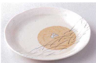
ヤ203-30 遊月7.0皿 φ24.2×2.8cm 570円