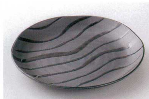
ア203-11 ジュピター-B7.5皿 φ24.5×3cm 800円