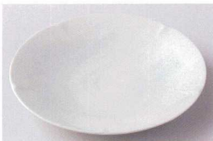
ハ203-16 湖水8.0皿 φ24.4×3.2cm 660円