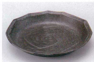
カ203-15 竹彩パスタブルーマット 24×3.7cm 710円