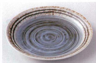
キ203-21 うずしお7.0皿 φ24.2×2.8cm 630円