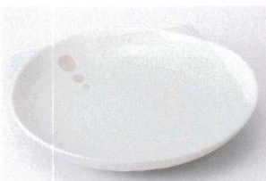
ヤ203-19 ドット白三角8.0皿 23×4 650円