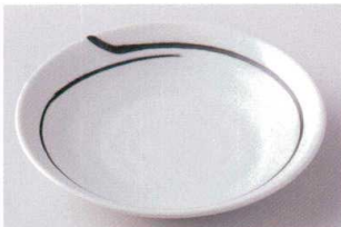
ハ203-12 初筆6.0皿 φ20×3.5cm 780円