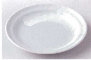
ハ203-02 白刷毛青磁タタキ8.0皿 φ24.5×3cm 860円