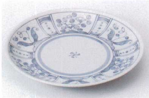
ヤ203-08 花間取7.0皿 φ23cm 840円