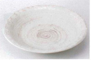
キ203-04 東風石目7.0皿 φ22.8×3.5cm 850円