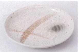
ヤ203-13 みやま丸7.0皿 23.5×3.4cm 760円