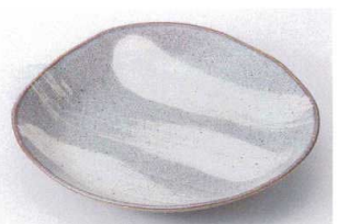
ヤ203-31 均窯粉引三角6.5皿 20×19.5×3.5cm 500円