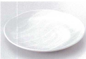
ア203-10 ジュピター-W7.5皿 φ24.5×3cm 800円