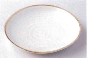
ネ203-09 粉引7.0皿 φ23×3.2cm 830円