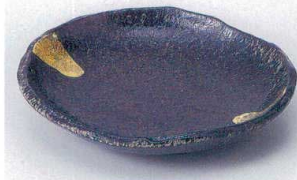
ア205-03 南蛮金彩デザート皿 16.8×15.5cm 1,430円