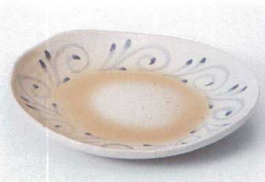
ア205-05 オレンジ吹唐草小判多用皿 18.2×16.2cm 1,400円