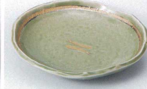
ア205-04 グリーン魚紋6.0多用皿 17×15.6cm 1,450円