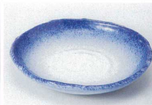
ア205-12 吹墨変形6.0皿 17×15.5×2.7cm 950円