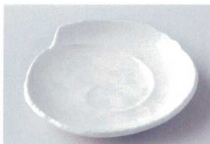
イ205-24 練色シェル銘々皿 φ15.3×3cm 580円