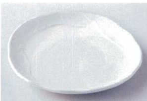
イ205-19 練色塗り壁銘々皿 17.5×16×2.5cm 720円