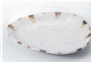
カ205-08 白砂錆十草三角取皿 19×15.4×3cm 1,100円