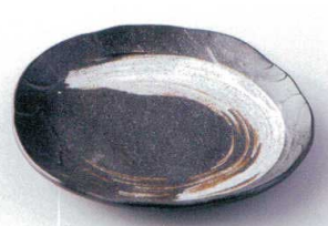
イ205-17 栗色刷毛目塗り壁銘々皿 17.5×16×2.5cm 720円