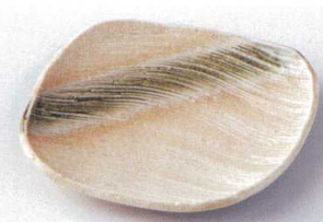
モ205-14 刷毛目半月銘々皿 15.8×15.5×2cm 750円