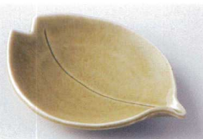
モ205-21 灰釉桜花銘々皿 20×14×3.5cm 650円