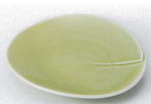
モ205-22 ひわ丸合せ取皿 14.5×16×2.6cm 580円