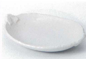
ヤ205-16 粉引耳付デザート皿 19.5×14cm 720円