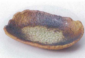
テ205-06 南蛮吹6.0皿 19×13cm 1,380円