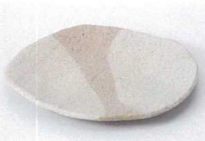
オ205-13 リブルフルーツ皿 17×15.5×1.8cm 850円