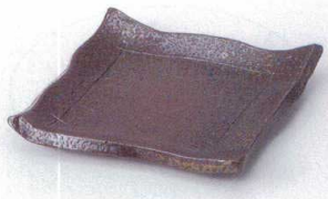
ミ205-01 備前風モダンカット5.5角皿 16×14×2.8cm 1,750円