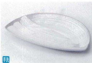
キ205-15 刷毛目半月銘々皿 18×11.8×1.7cm 800円