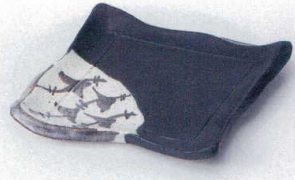
ミ205-02 黒織部モダンカット5.5角皿 16×14×2.8cm 1,750円