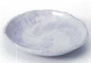
ネ205-09 紫においモッコ型5.5皿 16.8×15.2×3cm 1,100円