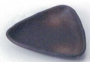
ネ205-10 備前三角皿(中) 14.5×14.5×2.5cm 1,050円