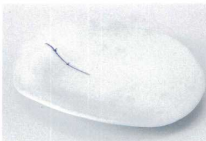
ツ205-11 青白磁切合皿 17.2×15.2×2.2cm 970円