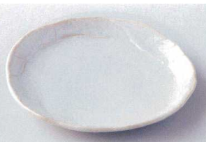
イ205-18 うのふ窯変塗り壁銘々皿 17.5×16×2.5cm 720円