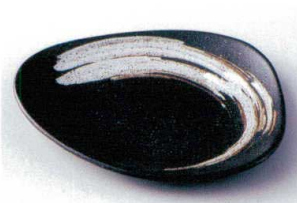
イ205-23 栗色刷毛目マロン銘々皿 17.6×14.5×2cm 580円