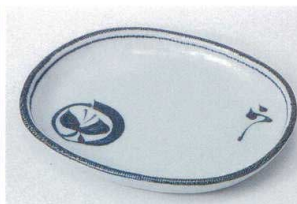
ロ205-20 丸紋蝶小判5.0皿 15.6×13.2×1.4cm 710円