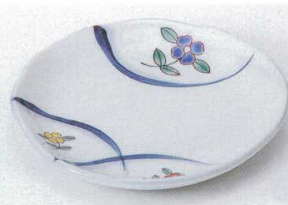
ミ206-14 錦花紋フルーツ皿 φ15.4×1.7cm 1,100円