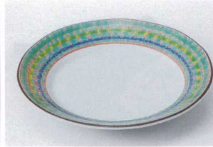
ミ206-03 京三彩5.5皿 φ16.8×2.8cm 2,300円