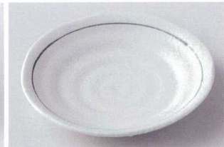
ネ206-24 粉引刷毛目5.0皿 φ16.5×2.5cm 300円