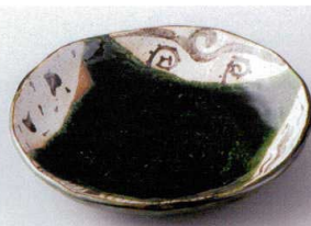
イ206-17 里山織部5.5丸皿 φ17.2×3cm 780円