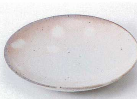
ネ206-13 粉引丸5.5皿 φ17.3×3.3cm 1,300円