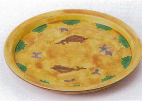
ミ206-02 交趾双魚和皿 φ17.1×2cm 3,600円