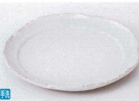
キ206-09 かいらぎ5.5皿 17.5×17.5×1.8cm 1,500円