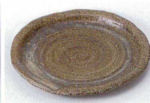
キ206-15 嵯峨野5.0波皿 φ17.3×1.7cm 900円