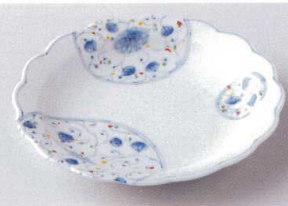
カ206-10 色花伊万里花割6.0皿 φ19×3cm 1,450円