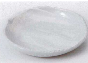
ネ206-22 化粧刷毛5.5深皿 φ16.8×2.8cm 700円