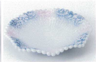
ソ206-12 玉淵波しぶき5.5皿 17.5×3.3cm 1,350円