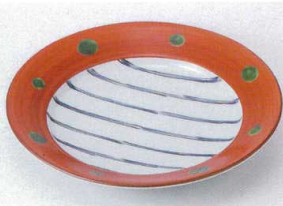
ミ206-01 朱巻十草6.0リム皿 φ18.5×3.1cm 3,080円