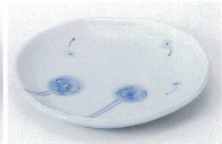
ミ206-16 ボンボン綿花銘々皿 15.2×15×2.2cm 860円