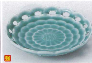
ソ206-11 深海青磁フルーツ皿 15.5×3.2cm 1,450円