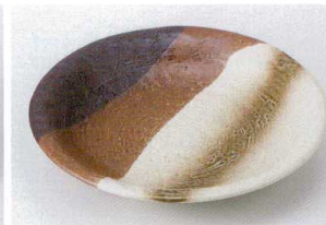
ハ206-23 京織部石目5.0皿 φ16.5×2.5cm 480円