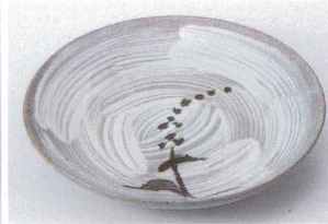
オ206-07 刷毛釉前菜皿 φ18.8×3.5cm 1,650円