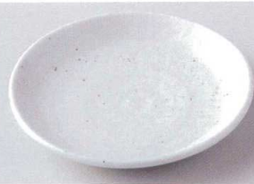
ネ206-05 錆ウズ5.0丸皿 φ16.5×2.3cm 720円