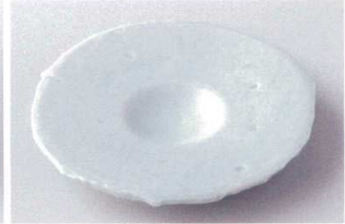
タ206-08 青白磁うず潮6.0丸くぼみ皿 φ18.5×2.7cm 1,520円