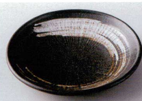
イ206-18 栗色刷毛目葵5.0皿 φ16.3×3.5cm 750円