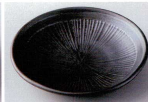
イ206-19 銀煤竹葵5.0皿 φ16.3×3.5cm 750円