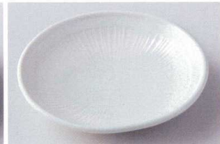
イ206-20 練色葵5.0皿 φ16.3×3.5cm 750円