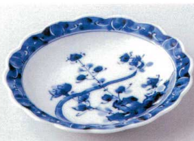
ネ206-21 岩花花割6.0皿 φ19×2.9cm 700円