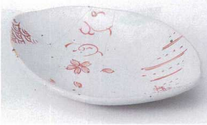
ネ207-03 赤絵古窯楕円銘々皿 18.2×13.4×2.1cm 1,500円