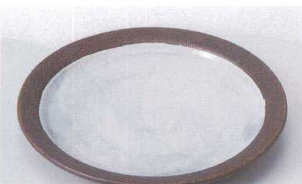
ホ207-19 伊賀風粉引ム4.0皿 φ15.2×1.8cm 600円