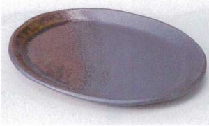
ネ207-02 いぶし楕円(中) 19×14.3cm 1,810円