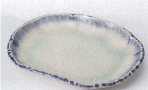
カ207-07 オフケ小判皿(小) 15.8×12.5cm 830円