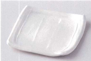
イ207-13 練色潤厚銘々皿 14.9×13.8×2.5cm 640円