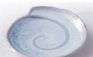
ヤ207-18 うきぐもシェル銘々皿 φ15.5×2.5cm 600円