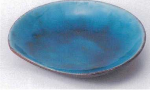
イ207-04 トルコ盛半月皿 15.5×13.8cm 1,450円