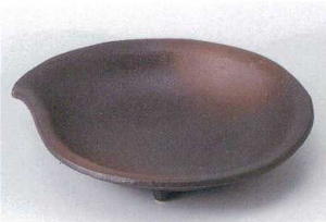
ウ207-14 黒伊賀吹き取皿 15.6×13.8×3cm 630円