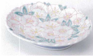
ミ207-01 花絵和皿 φ16.5×13.8cm 2,200円