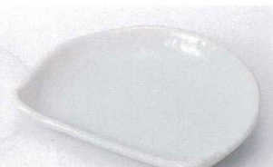
ヤ207-20 粉引半月銘々皿 15.5×13cm 590円