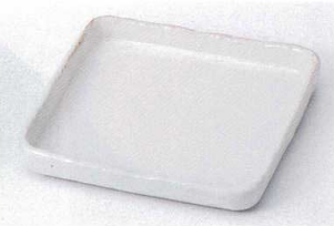
ネ207-16 黄化粧土13cm角皿 13.8×13.8×1.5cm 630円