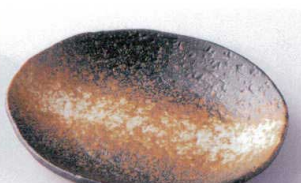
タ207-24 黒備前銘々皿 15.5×13×2.5cm 430円