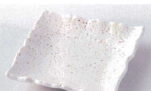
ミ207-23 萩志野チギリ銘々皿 15.5×15.5×3cm 550円