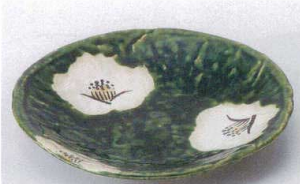
カ207-06 織部椿銘々皿 φ15.5×2.4cm 900円