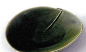
モ207-21 織部丸合せ取皿 16×14.5×2.6cm 580円