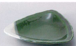
ホ207-22 織部三角4.8皿 15cm 570円