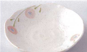
モ207-10 一珍たんぼ銘々皿 φ14×2.8cm 680円