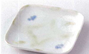
ト207-05 カトレアブルーなで角デザート皿 14.5×14.5×2.3cm 1,080円