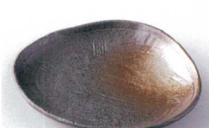
モ207-17 白吹天目三角中皿 17.5×15.2×2.7cm 600円