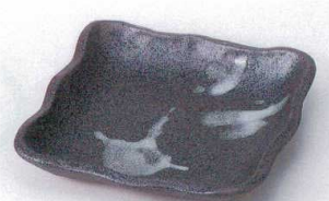
ウ207-08 備前白流取皿 14.1×13.8×2cm 810円