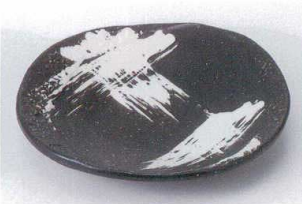
キ207-15 黒刷毛石目取皿 15.8×14.5×2.8cm 630円