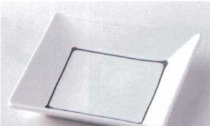
モ207-11 一珍新粉引四方取皿大 14×14×2.8cm 650円