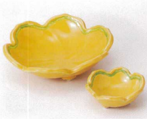
オ201-01 黄釉グリーン梅型向付 φ15.5×4.7cm 1,920円 オ201-02 黄釉グリーン梅型千代口 8.1×3.3cm 780円