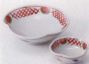
テ201-29 日輪輪花向付 14×4.8cm 1,700円 テ201-30 日輪輪花千代口 8×3.5cm 1,280円