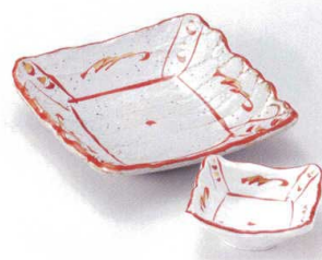
イ201-05 手描赤絵ソギ刺身鉢 17×17×4cm 1,850円 イ201-06 手描赤絵ソギ千代口 9×8.7×4cm 900円