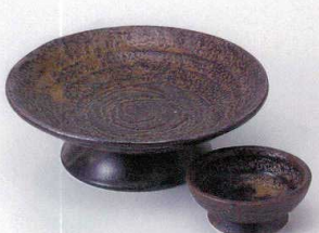
ミ201-25 伊賀釉高台6.0皿 φ19.4×6.3cm 1,750円 ミ201-26 伊賀釉高台千代口 φ8.5×4cm 380円