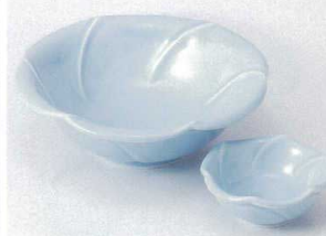
テ201-15 青地輪花向付 16×5.5cm 1,900円 テ201-16 青地輪花千代口 8×3.3cm 720円