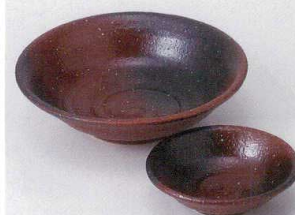
テ201-39 赤染黒吹向付 φ15.5×4.3cm 1,600円 テ201-40 赤染黒吹千代口 φ9.5×2.7cm 700円