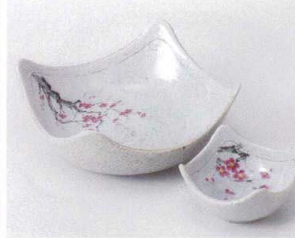
オ201-07 野書紅梅5.5四方鉢 15.5×15.5×7.7cm 1,890円 オ201-08 野書紅梅3.3四方鉢 8.5×8.5×4.5cm 810円