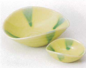
ト201-03 黄釉グリーン流し向付 15.8×13.5×5.5cm 1,900円 ト201-04 黄釉グリーン流し千代口 8.8×6.8×3cm 850円