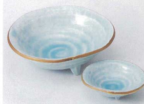
ミ201-23 鳴海青地三ツ足向付 φ15.3×5.2cm 1,850円 ミ201-24 鳴海青地三ツ足千代口 φ8.7×3.2cm 800円