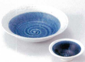
ソ201-33 ゴス巻平向付 φ15.7×4.2cm 1,700円 ソ201-34 ゴス巻丸千代口 φ8×3cm 650円