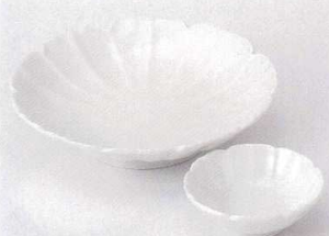
テ201-27 黄青磁花形刺身鉢 16.8×3.8cm 1,600円 テ201-28 黄青磁花形千代口 8×3cm 640円