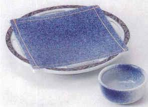
ミ201-13 呉須吹透し高台皿 φ18.5×3cm 1,850円 ミ201-14 呉須吹透し丸千代口 9×8.2×3.1cm 550円