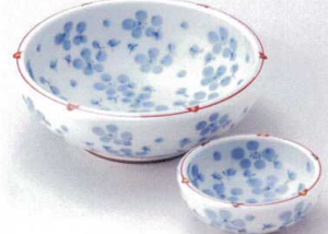
マ201-11 梅花詰 向付 16×4.55cm(有田焼) 1,800円 マ201-12 梅花詰 千代口 9×3.5cm(有田焼) 900円