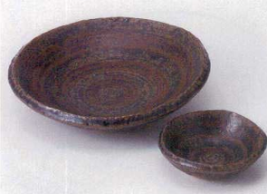
ト201-21 紺結晶刺身鉢 φ17×4cm 1,900円 ト201-22 紺結晶千代口 φ8.5×2.7cm 1,100円