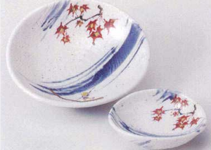
オ201-19 粉引あらしやま楕円向付鉢 15.8×14.5×4.3cm 1,840円 オ201-20 粉引あらしやま千代口 10.2×9.2×3cm 1,180円