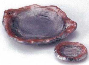
ト201-17 炭化手ひねり5.5向付 17×16×3.2cm 1,900円 ト201-18 炭化豆皿 φ8×2cm 950円