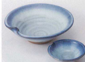
ト201-31 うのふ刺身鉢 φ16×5cm 1,700円 ト201-32 うのふ千代口 φ8.5×2.5cm 650円