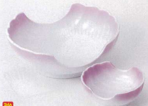
ト201-35 紫吹二方切刺身鉢 13.6×11.7×5cm 1,680円 ト201-36 紫吹二方切千代口 7.3×6.2×3cm 800円