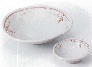
テ201-09 赤絵草紋向付 16.3×4.3cm 1,900円 テ201-10 赤絵草紋千代口 8.3×2.8cm 1,350円