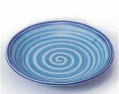
ネ210-26 青釉4.0皿 φ14×2cm 280円