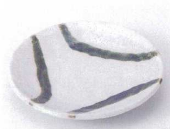
モ210-06 小雪5.0皿 φ16.5×2.5cm 390円 モ210-07 小雪4.0皿 φ13.5×2.5cm 310円