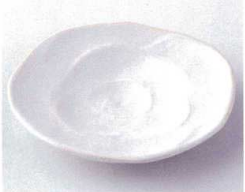
カ210-15 白斑点バラ型4.8皿 φ15×2.5cm 330円