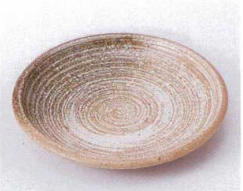
ハ210-21 大地括り手4.0皿 φ14.2cm 300円