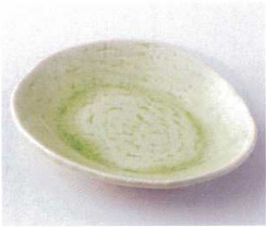
タ210-02 ヒワ銘々皿 15.5×13×2.5cm 430円