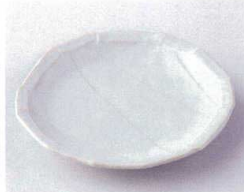
カ210-28 白斑点十二角皿 15×2.2cm 280円