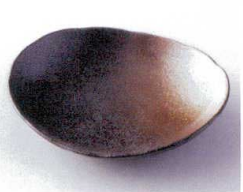
モ210-16 白吹天目楕円皿小 13.3×12×3.3cm 330円