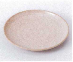
ハ210-05 いにしえ粉引4.0皿 φ13.5cm 400円