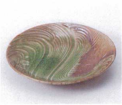
ホ210-03 織部清流5.0皿 φ15×2.5cm 410円