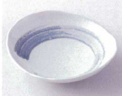
ホ210-12 清瀬だえん4.0皿 13×12×3cm 360円