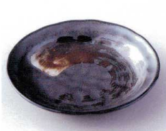
ハ210-14 白刷毛鉄結晶タタキ4.0皿 φ14×2.2cm 330円