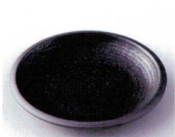
カ210-25 黒マツくくりて4.0皿 φ14.4×2.2cm 300円