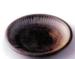
ハ210-22 民芸十草括り手4.0皿 φ14.3×2.3cm 300円