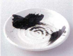
カ210-09 黒刷毛六兵衛4.0皿 φ14.2×2cm 380円