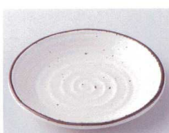
モ210-23 白河4.0皿 φ14×2.5cm 300円