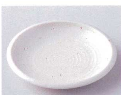
カ210-24 白マツくくりて4.0皿 φ14.4×2.2cm 300円