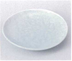
ホ210-04 青白磁岩清水5.0皿 φ15×2.5cm 410円