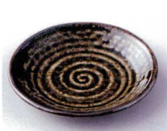
ネ210-19 窯炎熊野4.0皿 φ14×2.3cm 300円