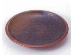
ハ210-27 朱金彩括り手4.0皿 φ14cm 280円