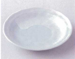
ハ210-13 白刷毛青磁タタキ4.0皿 φ14×2.2cm 330円