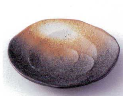
カ210-17 黒備前吹バラ型4.8皿 φ15×2.5cm 330円