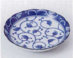
ア210-31 ダミ唐草4.0深皿 φ13.4×2.5cm 220円