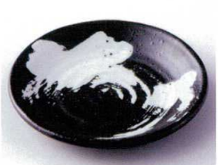
カ210-10 白刷毛六兵衛4.0皿 φ14.2×2cm 380円