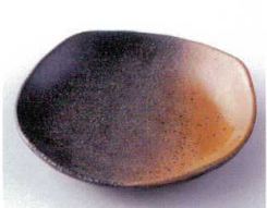
イ210-20 黒信楽4.0皿 13.6×13.6×3cm 320円