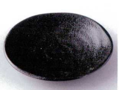
ア210-11 ヴォルテックス14.5cm皿 φ14.4×2.3cm 370円