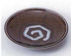
ハ210-30 渦織部3.5皿 φ12.4cm 250円