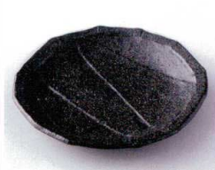
カ210-29 黒備前十二角皿 15×2.2cm 280円