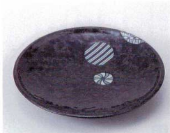
ハ210-18 丸小紋丸4.0皿 φ13.3×2cm 300円