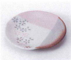
ホ210-01 吉野桜三ツ押銘々皿 14.5cm 570円