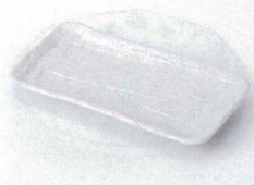
ヤ212-27 削ぎ型白串皿 18.5×9.5×2cm 400円