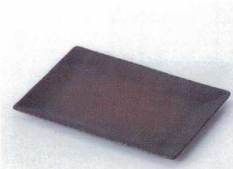
カ212-18 備前風平城型5.0長角皿 17×11.5cm 630円