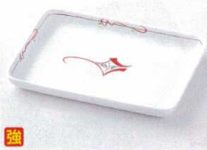
カ212-02 手描き京小花長角皿(小) 17×12.3×1.7cm 2,350円