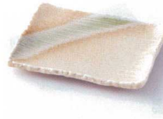
モ212-09 潤厚四角千筋久取皿 16.5×12×2cm 800円