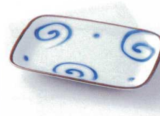
ヤ212-30 うず銘々皿 16.4×10.8×2cm 340円