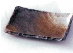
カ212-24 匠さの串皿 17.2×12×2.5cm 540円