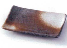
モ212-22 白吹天目串皿 16.4×11×2cm 580円