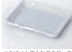
キ212-14 青白釉長角銘々皿 14.5×10.8×1.9cm 650円