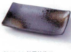
イ212-11 鉄黒焼物皿 19×12×2cm 700円