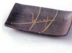
イ212-10 織部筆散し焼物皿 19×12×2cm 700円