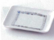
ト212-29 おふけ取皿 15×11.5×2cm 360円