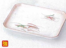
カ212-03 加茂川焼鳥皿 16×12.2×2.4cm 2,000円