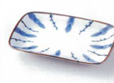
ヤ212-31 太細十草銘々皿 16.4×10.8×2cm 340円