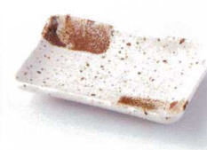
モ212-26 斑点マット取皿 13.5×9.5×2.1cm 440円