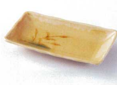
モ212-28 織部葎串皿 18×9.5×2.4cm 390円