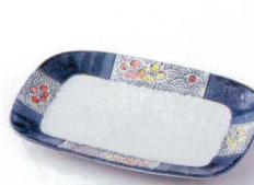
モ212-19 梅祥瑞長角皿 17.5×12×1.7cm 600円