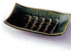
カ212-04 織部ソギ焼物皿 16.2×11×3cm 1,600円