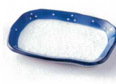
ホ212-25 きらのり皿 13.5×9.5cm 480円