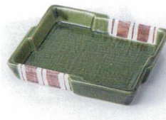
モ212-23 織部十草切立銘々皿 12×14.5×2.5cm 550円