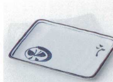
キ212-21 丸紋蝶長角銘々皿 14.2×11×1.7cm 600円