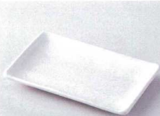
タ212-16 桃山志野6.0長角皿 18.5×11.5×2cm 640円