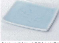
ミ212-13 青白磁つゆ草長角6.0前菜皿 14.8×12.5cm 680円