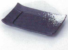
ウ212-06 いぶし黒白吹長角四方皿 16.5×10.5×1.8cm 1,220円