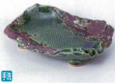
テ212-01 織部波紋(手造り)銘々皿 15×11×3.5cm 3,100円