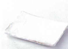
ネ212-20 くらま串皿 16.5×11.5×1.5cm 600円