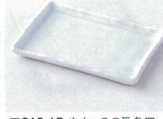
キ212-15 やよい5.5長角皿 16.5×11×1.5cm 640円