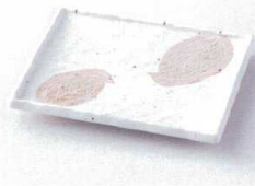
モ212-07 なごり葉荒波角皿 16×13×2cm 830円