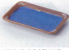
ツ212-12 南蛮交趾のり皿 16.3×10×2.1cm 700円