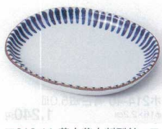
口213-11 藍十草小判型銘々皿 15.8×13.4×1.4cm 890円