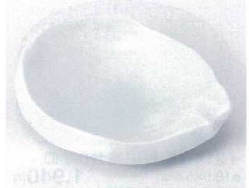
タ213-10 青磁ちぎり小皿 14×11.5×3.5cm 930円