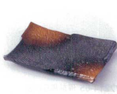
タ213-23 黒備前金茶吹玄申皿 17×11×1.9cm 540円