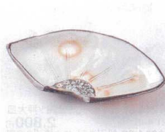
ネ213-03 三島扇皿 18.3×11.0×2.8cm 1,600円