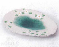
オ213-02 グリン流楕円銘々皿 17.7×12.3×2.0cm 1,680円