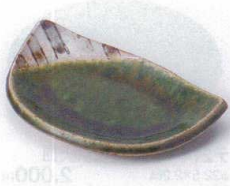
ツ213-01 織部半月フルーツ皿 16×10.5cm 1,700円