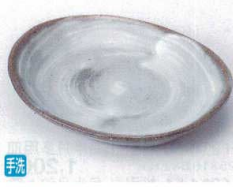
キ213-18 刷毛目ヌカ取皿 15.5×12.5×2.5cm 700円