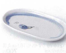
ヤ213-29 刷毛ナス一品皿 17.5×10cm 380円