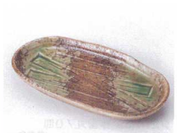
ヤ213-25 削ぎ型伊賀おかず皿 18.2×10×2.2cm 400円