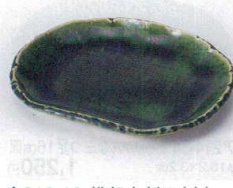
カ213-13 織部小判皿(小) 15.8×12.5cm 830円