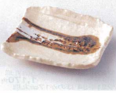
モ213-17 月虹ちぎり取皿 15×12.5×2.8cm 790円