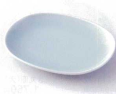
モ213-08 青白磁楕円皿 17×13×2.5cm 1,100円