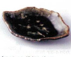
ネ213-12 織部ちぎり皿 18.5×13×2.3cm 870円