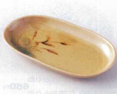
モ213-28 織部葎おかず皿 18×10×2.2cm 390円