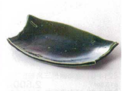
カ213-05 織部銘々皿 18×11.3×3cm 1,500円