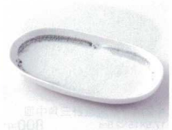
ト213-30 おふけ楕円皿 17.5×10×2cm 360円