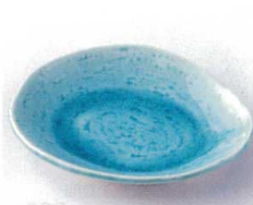
タ213-24 トルコ銘々皿 15.5×13×2.5cm 430円