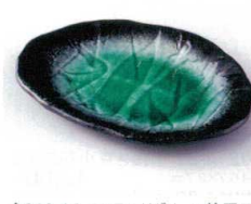
タ213-14 エメラルドグリーン楕円皿 19.2×13.9×1.8cm 800円