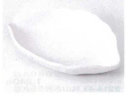
タ213-20 白マット木の葉小皿 17×11.6×3cm 580円