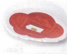
オ213-04 赤椿楕円銘々皿 17.7×12.3×2.0cm 1,580円