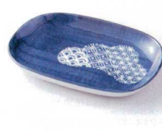
モ213-19 藍染波松葉小判皿 18.5×12.5×2.2cm 660円