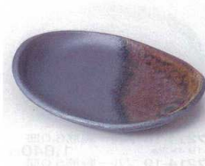
ネ213-09 いぶし楕円(小) 14.8×10.9cm 1,100円