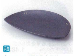
キ213-15 黒結晶半月銘々皿 18×11.8×1.7cm 800円