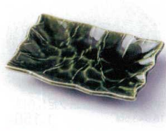
モ213-16 織部手織取皿 15×11.5×2cm 790円