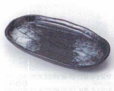
ヤ213-26 削ぎ型黒おかず皿 18.2×10×2.2cm 400円