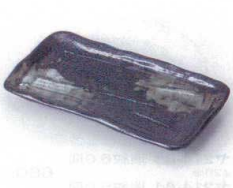
ヤ213-27 削ぎ型黒申皿 18.5×9.5×2cm 400円