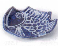
タ213-07 魚銘々皿 15×12.7×3.4cm 1,100円