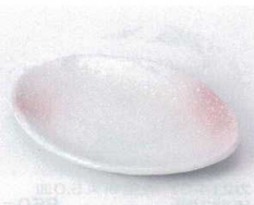
ホ213-22 ピンク吹舟型銘々皿 16.5×12×2.5cm 550円