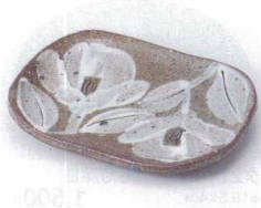
ト213-06 タタラ白盛山茶花楕円銘々皿 16×11.2×2.5cm 1,200円