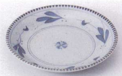
Ya215-05 益子風ツタ6.0皿 φ20cm 680円 Ya215-06 益子風ツタ5.0皿 φ16.5cm 450円 Ya215-07 益子風ツタ4.0皿 φ13.3cm 420円 Ya215-08 益子風ツタ3.5皿 φ11.5cm 370円