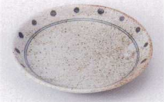
Ya215-44 朝露5.0皿 φ17cm 450円 Ya215-45 朝露4.0皿 φ13cm 420円 Ya215-46 朝露3.5皿 φ11.2cm 370円