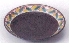
Ya215-13 黒釉モダン格子6.0皿 φ19.1×3.3cm 650円 Ya215-14 黒釉モダン格子5.0皿 φ16.5×3cm 500円 Ya215-15 黒釉モダン格子4.0皿 φ14×2.5cm 420円 Ya215-16 黒釉モダン格子3.5皿 φ12×2.5cm 350円