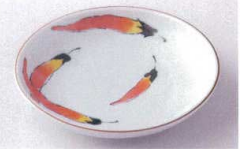
Ya215-47 染付 とうがらし6.0皿 φ19.3×3.6cm 450円 Ya215-48 染付 とうがらし5.0皿 φ16.6×3cm 320円 Ya215-49 染付 とうがらし4.0皿 φ13.8×2.7cm 260円 Ya215-50 染付 とうがらし3.5皿 φ12.5×2.4cm 220円