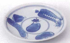
Ya215-09 朝市6.0皿 φ20.5cm 680円 Ya215-10 朝市5.0皿 φ16.5cm 450円 Ya215-11 朝市4.0皿 φ13.3cm 420円 Ya215-12 朝市3.5皿 φ11.2cm 370円