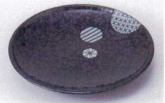
Ha215-32 丸小紋丸6.0皿 φ19.3×2.8cm 530円 Ha215-33 丸小紋丸5.0皿 φ16.8×2.3cm 390円