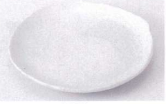
Ha215-93 粉引5.0皿 φ15.6cm 260円 Ha215-94 粉引4.0皿 φ12.5cm 240円