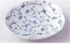
Ya215-91 つばみ唐草5.0平皿 φ16.3×2.8cm 280円 Ya215-92 つばみ唐草3.8平皿 φ12.7×3cm 200円