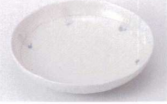
Mo215-89 粉引格子5.0皿 φ16.2×3.5cm 310円 Mo215-90 粉引格子3.5皿 φ12.7×2.7cm 230円