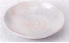
Ya215-86 窯変唐津5.0皿 φ16.7×3cm 310円 Ya215-87 窯変唐津4.0皿 φ13.8×2.6cm 250円 Ya215-88 窯変唐津3.5皿 φ12×2.5cm 205円