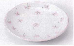
Mo215-81 リーフFS型5.0皿ピンク φ16.6×2.8cm 310円 Mo215-82 リーフFS型4.0皿ピンク φ13.2×2.6cm 240円 Mo215-83 リーフFS型3.5皿ピンク φ12×2.5cm 220円