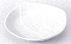
A215-23 ジュピター-W6.0角皿 18.8×18.8×3.5cm 620円 A215-24 ジュピター-W5.0角皿 15.8×15.8×3.2cm 440円 A215-25 ジュピター-W4.0角皿 13.4×13.4×3cm 370円