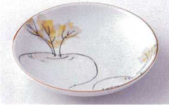
Ya215-54 染付 かぶ6.0皿 φ19.3×3.6cm 450円 Ya215-55 染付 かぶ5.0皿 φ16.6×3cm 320円 Ya215-56 染付 かぶ4.0皿 φ13.8×2.7cm 260円 Ya215-57 染付 かぶ3.5皿 φ12.5×2.4cm 220円