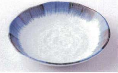
Ya215-75 古染刷毛5.0皿 φ16.7×3cm 320円 Ya215-76 古染刷毛4.0皿 φ13.8×2.5cm 250円 Ya215-77 古染刷毛3.5皿 φ12×2.4cm 210円