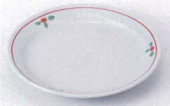
Ya215-37 青磁赤絵花紋6.0皿 19cm 510円 Ya215-38 青磁赤絵花紋5.0皿 16.5cm 430円 Ya215-39 青磁赤絵花紋4.0皿 14cm 360円 Ya215-40 青磁赤絵花紋3.5皿 12cm 320円