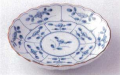
Yo215-30 なずな6.0皿 φ19.3×4cm 580円 Yo215-31 なずな5.0皿 φ16.5×3.5cm 400円