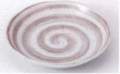
Ki215-66 茶巻粉引5.0皿 φ16.8×3cm 340円 Ki215-67 茶巻粉引4.0皿 φ14×3cm 280円 Ki215-68 茶巻粉引3.5皿 φ12×2.6cm 230円