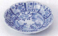
Ya215-41 雪輪型花鳥5.0皿 φ16cm 510円 Ya215-42 雪輪型花鳥4.0皿 φ13.5cm 420円 Ya215-43 雪輪型花鳥3.5皿 φ12cm 320円