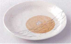
Ya215-62 遊月6.0皿 φ19.2×2.8cm 350円 Ya215-63 遊月5.0皿 φ16.6×2.6cm 270円 Ya215-64 遊月4.0皿 φ14×2cm 230円 Ya215-65 遊月3.5皿 φ12.3×2cm 200円