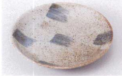
Ya215-51 刷毛目白唐津5.0皿 φ17cm 450円 Ya215-52 刷毛目白唐津4.0皿 φ13cm 420円 Ya215-53 刷毛目白唐津3.5皿 φ11.2cm 370円