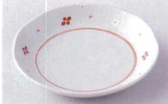
Ho215-34 花散5.0皿 φ16.5×3cm 540円 Ho215-35 花散4.0皿 φ14×2.6cm 420円 Ho215-36 花散3.5皿 φ12×2.5cm 380円