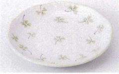
Mo215-78 リーフFS型5.0皿グリーン φ16.6×2.8cm 310円 Mo215-79 リーフFS型4.0皿グリーン φ13.2×2.6cm 240円 Mo215-80 リーフFS型3.5皿グリーン φ12×2.5cm 220円