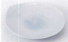
Ta215-20 淡青モア銘々皿 17.5×16×2.5cm 620円 Ta215-21 淡青モア小皿 12.5×11.4×2cm 360円 Ta215-22 淡青モアプチ小皿 6.8×6×1.5cm 260円