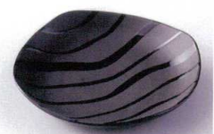
A215-17 ジュピター-B6.0角皿 18.8×18.8×3.5cm 620円 A215-18 ジュピター-B5.0角皿 15.8×15.8×3.2cm 440円 A215-19 ジュピター-B4.0角皿 13.4×13.4×3cm 370円