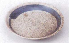
Ya215-26 白唐津大文字6.0皿 20cm 680円 Ya215-27 白唐津大文字5.0皿 17cm 450円 Ya215-28 白唐津大文字4.0皿 13cm 420円 Ya215-29 白唐津大文字3.5皿 11.5cm 370円