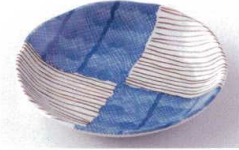
Ya215-72 益子錆市松5.0皿 φ16.7×3cm 320円 Ya215-73 益子錆市松4.0皿 φ13.8×2.5cm 250円 Ya215-74 益子錆市松3.5皿 φ12×2.4cm 210円