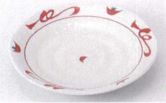
Ho215-58 赤絵唐草5.0皿 φ16.5×2.5cm 440円 A215-59 赤絵唐草4.0皿 φ14×2.3cm 420円 Ho215-60 赤絵唐草3.5皿 φ12×2.3cm 350円 Ho215-61 赤絵唐草3.0皿 φ10×2cm 340円