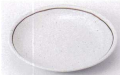
Ya215-01 粉引ライン6.0皿 20.4cm 680円 Ya215-02 粉引ライン5.0皿 16.7cm 450円 Ya215-03 粉引ライン4.0皿 13.2cm 420円 Ya215-04 粉引ライン3.5皿 11.3cm 370円