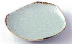
ト216-01 翠玉流水7.0三角皿 22×21.5×3.6cm 2,950円 ト216-02 翠玉流水6.0三角皿 17×17×3.2cm 2,350円 ト216-03 翠玉流水5.0三角皿 14.5×14×2.5cm 1,620円