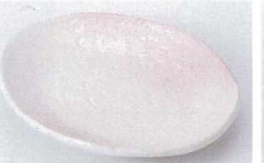
ヤ216-80 桜志野変形皿(大) 17.5×14.5×2.5cm 580円 ヤ216-81 桜志野変形皿(小) 15.3×13×2.5cm 420円