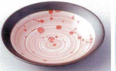
ハ216-34 紅染5.0皿 φ16.5×3.3cm 750円 ハ216-35 紅染4.0皿 φ12×2.5cm 630円