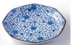
ヤ216-62 花唐草7.0皿 φ22.6×3.6cm 600円 ヤ216-63 花唐草6.0皿 φ19×3.5cm 380円 ヤ216-64 花唐草5.0皿 φ15.7×3cm 290円 ヤ216-65 花唐草4.0皿 φ12.5×2.6cm 250円 ヤ216-66 花唐草3.5皿 φ11×2.5cm 200円