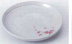
オ216-22 野書紅梅6.0皿 φ19.2×3cm 1,190円 オ216-23 野書紅梅5.0皿 φ16.3×2.7cm 800円 オ216-24 野書紅梅4.0皿 φ13×2.5cm 520円