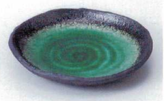
ア216-29 深海6.0多用皿 17×15.5cm 880円 ア216-30 深海5.0多用皿 15.5×13.7×2.3cm 700円