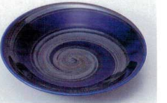
ハ216-36 銀彩ブルー六兵衛6.0皿 φ20×4cm 700円 ハ216-37 銀彩ブルー5.0皿 φ16.5×3.3cm 580円 ハ216-38 銀彩ブルー4.0皿 φ12×2.5cm 450円