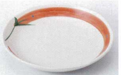
ヤ216-77 赤絵とうがらし5.0皿 φ16.7cm 530円 ヤ216-78 赤絵とうがらし4.0皿 φ14cm 460円 ヤ216-79 赤絵とうがらし3.5皿 φ12cm 365円