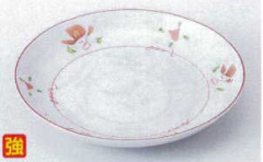
ウ216-16 花つばみ5.0皿 φ16.6×2.7cm 1,370円 ウ216-17 花つばみ4.0皿 φ13.6×2.3cm 1,100円 ウ216-18 花つばみ3.5皿 φ12.2×2.1cm 900円