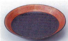
キ216-39 金彩茶結晶6.0皿 φ19.2×3.2cm 700円 キ216-40 金彩茶結晶5.0皿 φ16.5×3cm 580円 キ216-41 金彩茶結晶4.0皿 φ14.2×2.5cm 480円 キ216-42 金彩茶結晶3.5皿 φ12.2×2.5cm 400円