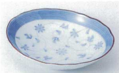
ホ216-56 唐草6.0だえん皿 19.5×16×4cm 610円 ホ216-57 唐草5.0だえん皿 16.5×13×3.5cm 440円 ホ216-58 唐草3.5だえん皿 12×9.5×2.5cm 280円