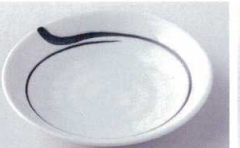
ハ216-67 初筆5.0皿 φ16.5×3.3cm 600円 ハ216-68 初筆4.8皿 φ14.5×2.9cm 550円 ハ216-69 初筆4.0皿 φ12×2.5cm 500円