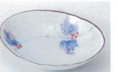
ホ216-52 みのり6.0深皿(だえん) 19.5×16×4cm 610円 ホ216-53 みのり5.0深皿(だえん) 16.5×13×3.5cm 440円 ホ216-54 みのり4.0深皿(だえん) 14×11×3cm 350円 ホ216-55 みのり3.5深皿(だえん) 12×9.5×2.5cm 280円