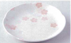
ヤ216-59 志野さくら梅型7.0皿 φ21.2×3.2cm 610円 ヤ216-60 志野さくら梅型5.0皿 16.5cm 290円 ヤ216-61 志野さくら梅型3.5皿 φ11.6×2.2cm 200円