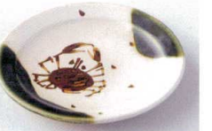
ロ216-25 織部かに絵5.0丸皿 φ15×2cm 1,140円 ロ216-26 織部かに絵3.0丸皿 φ9.8×1.5cm 640円