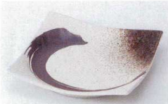
ハ216-72 志野サビ刷毛正角5.5皿 17.3×17.3cm 600円 ハ216-73 志野サビ刷毛正角4.5皿 13.7×13.7cm 370円