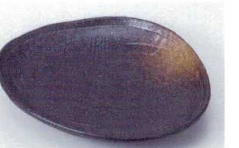
ヤ216-70 黒備前金茶吹三角中皿 17.5×15cm 600円 ヤ216-71 黒備前金茶吹三角小皿 13.5×11.2cm 410円