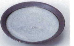
テ216-12 黒ガラス灰取皿 φ16.5×3.3cm 1,500円 テ216-13 黒ガラス灰小皿 φ12.5×2.5cm 800円