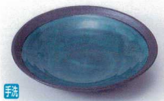
キ216-14 黒釉ヒスイ中皿 φ16.5×3.5cm 1,480円 キ216-15 黒釉ヒスイ小皿 φ12.3×2.5cm 880円