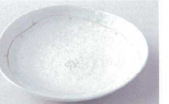
ヨ216-82 四つ葉6.0皿 φ19.2×3.7cm 500円 ヨ216-83 四つ葉5.0皿 φ16.5×3.2cm 350円 ヨ216-84 四つ葉3.5皿 φ12×2.5cm 280円