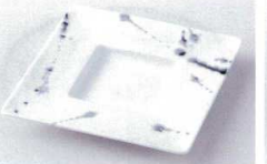
ウ216-10 黒吹染プリムプレート(M) 18×2cm 1,500円 ウ216-11 黒吹染四角皿 11.5×1.5cm 1,200円