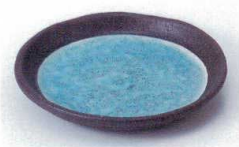
ホ216-27 トルコ5.5皿 φ17×2.5cm 940円 ホ216-28 トルコ4.5皿 φ13.8×2cm 770円