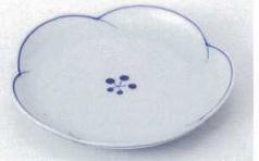
ロ216-19 染付梅ライン5.5皿 φ16.9×2.7cm 1,150円 ロ216-20 染付梅ライン4.5皿 φ13.7×2.3cm 760円 ロ216-21 染付梅ライン3.5皿 φ11.2×2.6cm 530円