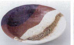
ハ216-49 京織部石目5.0鉢 φ16.7×4.2cm 630円 ハ216-50 京織部石目4.0鉢 12.7×3.7cm 400円 ハ216-51 京織部石目3.3鉢 11×3.4cm 330円