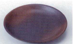
ヤ216-43 いぶし赤吹6.0皿 20cm 680円 ヤ216-44 いぶし赤吹5.0皿 16.5cm 450円 ヤ216-45 いぶし赤吹4.0皿 13cm 420円 ヤ216-46 いぶし赤吹3.5皿 11.3cm 370円