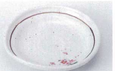
オ216-47 粉引ライン紅梅ナブリ5.0皿 φ16×3.2cm 810円 オ216-48 粉引ライン紅梅ナブリ4.0皿 φ13×2.8cm 550円