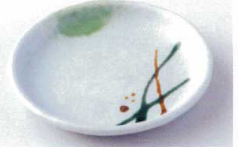
ホ216-31 美濃路玉瀾5.5皿 φ16.8×2.5cm 760円 ホ216-32 美濃路玉瀾4.5皿 φ14×2.2cm 580円 ホ216-33 美濃路玉瀾3.5皿 φ10.8×2cm 460円