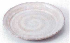
テ216-04 粉引波大皿 φ22×2.5cm 2,000円 テ216-05 粉引波中皿 φ17.5×2.3cm 1,450円