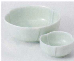
オ022-05 もえぎ手造り向付