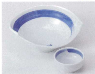
ト022-09 呉須刷毛ちぎり向付