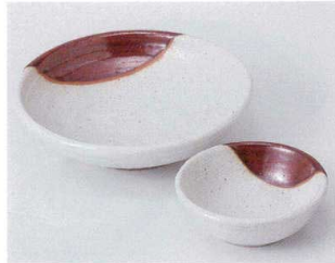
口022-25 赤釉掛玉漉刺身鉢