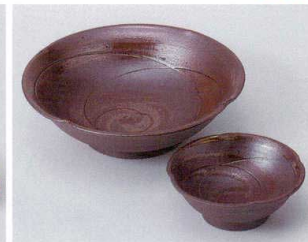
ト022-15 灰釉流し刺身鉢