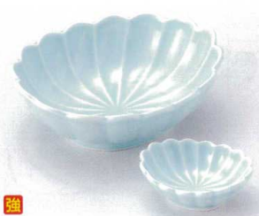
ウ022-03 ヒスイ菊型楕円刺身鉢