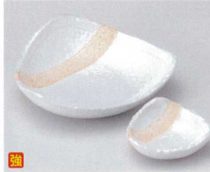
口022-29 粉引塗分け5.5三角皿