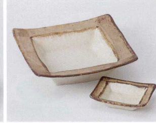
ト022-41 角漉サビ刺身鉢