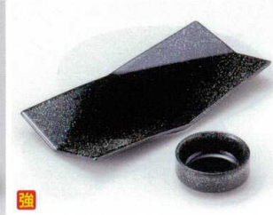
ホ022-31 銀河四方上長角皿