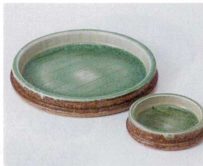
ト022-13 灰釉荒土切立5.5皿