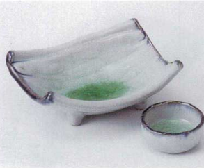
ツ022-27 かいらぎ両切刺身鉢