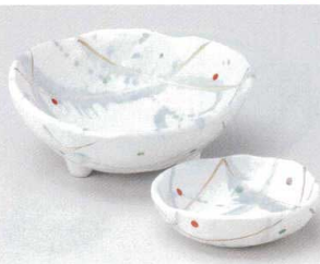
ト022-11 銀彩ちらし三ツ足向付