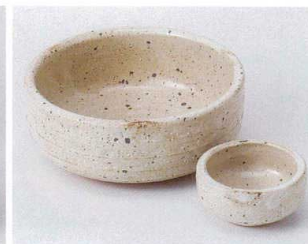
ト022-07 白灰釉玉漉刺身鉢