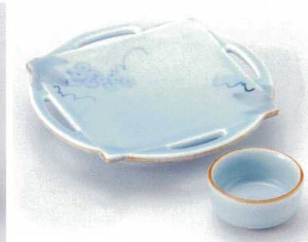
ミ022-23 手書きぶどうスカシ高台皿