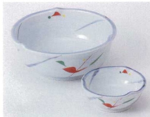
口022-17 赤絵三輪花刺身