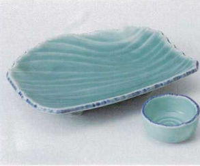
ミ022-36 深海青磁流水彫7.0皿