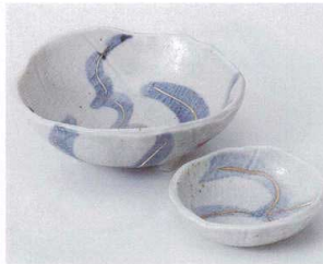
オ022-21 銀彩三ツ足向付