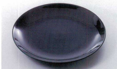
ス227-07 黒釉12号丸皿 φ37×4.5cm(萬古焼) 2,350円 ス227-08 黒釉10号丸皿 φ32×3.5cm(萬古焼) 1,800円