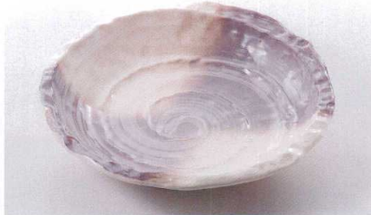
ス227-03 萩風10号変形丸皿 φ29.5×6cm(萬古焼) 3,000円 ス227-04 萩風8号変形丸皿 φ24.5×5cm(萬古焼) 1,800円