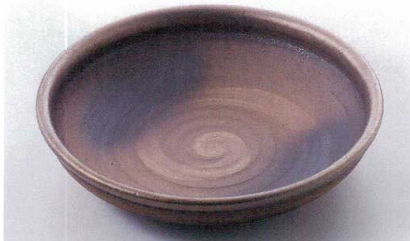
ス227-18 金彩10号盛鉢 φ29.5×6cm(萬古焼) 4,300円 ス227-19 金彩7号盛鉢 φ21×4.5cm(萬古焼) 1,950円