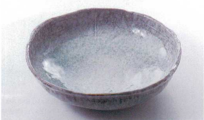
ス227-28 青釉10号盛鉢 φ30×8.5cm(萬古焼) 4,500円 ス227-29 青釉8号盛鉢 φ24×7cm(萬古焼) 2,100円