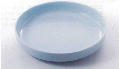
ス227-17 青地ドラ鉢 φ30×5.8cm(萬古焼) 2,250円