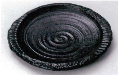
ス227-05 黒いぶし彫刻皿(大) 34×32.5×3.5cm(萬古焼) 3,500円 ス227-06 黒いぶし彫刻皿(小) 19×18×2.5cm(萬古焼) 1,000円