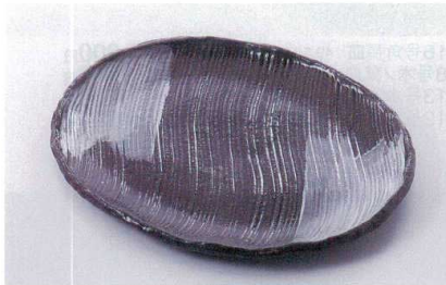
ス227-15 グレー刷毛目10号小判皿 31.5×25.5×2.5cm(萬古焼) 2,500円