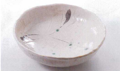
ス227-26 まりも10号盛鉢 φ30×8.5cm(萬古焼) 4,500円 ス227-27 まりも8号盛鉢 φ24×7cm(萬古焼) 2,100円