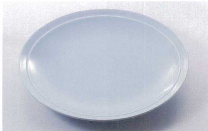
ス227-09 青地12号高台皿 φ37.5×5cm(萬古焼) 2,500円 ス227-10 青地11号高台皿 φ34.5×5cm(萬古焼) 2,300円 ス227-11 青地10号高台皿 φ32×5cm(萬古焼) 1,800円