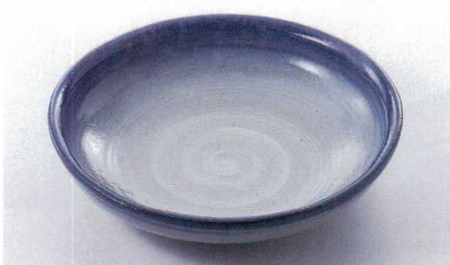
ス227-24 清流10号盛鉢 φ29.5×6.5cm(萬古焼) 4,300円 ス227-25 清流7号盛鉢 φ21×4.5cm(萬古焼) 1,950円