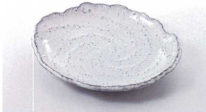
ス227-01 白濁10号丸皿 30.5×26.5×3.8cm(萬古焼) 2,100円 ス227-02 白濁8号丸皿 24.5×21.5×3.5cm(萬古焼) 1,280円