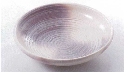
ス227-22 萩風10号めん鉢 φ30×8cm(萬古焼) 3,500円 ス227-23 萩風8号めん鉢 φ24.5×6.5cm(萬古焼) 1,950円