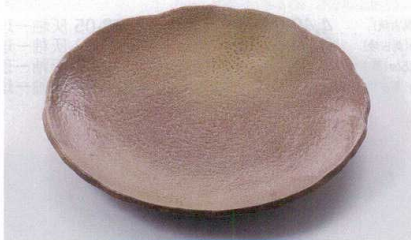
ス227-16 黒茶吹10号丸皿 φ31×4.2cm(萬古焼) 2,100円