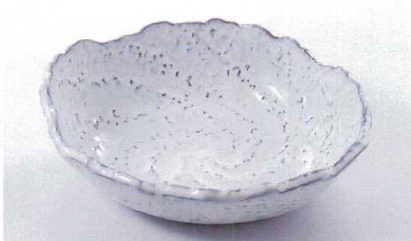
ス227-20 白濁9号鉢 26.5×23.5×7cm(萬古焼) 2,250円 ス227-21 白濁8号鉢 24×21.5×5cm(萬古焼) 1,650円