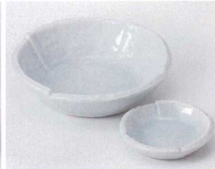
口023-31 青白釉刺身鉢 φ15.2×3.9cm 1,300円 口023-32 青白釉丸千代口 φ8.2×2cm 390円