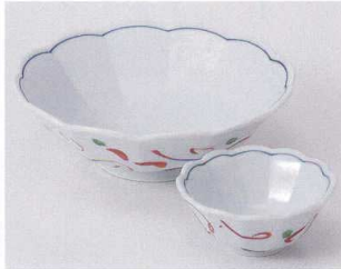
ネ023-11 十二角紺筋赤絵向付 φ15×4.9cm 1,400円 ネ023-12 十二角紺筋赤絵千代口 φ8×3.5cm 720円