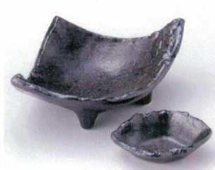
ヤ023-37 茶しぶぎ21cm三角鉢 21×16.5×8cm(刺身組) 1,280円 ヤ023-38 茶しぶぎちぎり角小付 10.5×8.5×2.8cm(刺身組) 450円