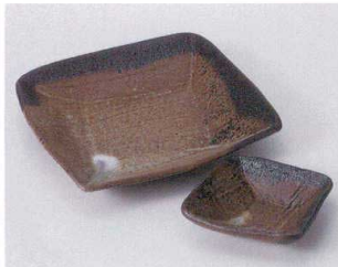
ト023-35 春雪角刺身鉢 18.5×18.5×3.5cm 1,250円 ト023-36 春雪角千代口 10×10×3cm 620円