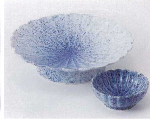
ホ023-07 墨吹菊形高台皿 φ15.5×4cm 1,320円 ホ023-08 墨吹菊形千代口 φ6.8×2.8cm 460円