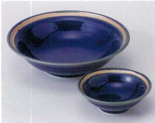
オ023-09 紺結晶金彩向付 φ15.4×4cm 1,470円 オ023-10 紺結晶金彩千代口 φ8.7×2.7cm 950円