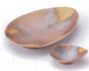
ウ023-05 美膳しずく中皿 20.8×15×3.8cm 1,550円 ウ023-06 美膳しずく千代口 9.2×7.2×3cm 520円