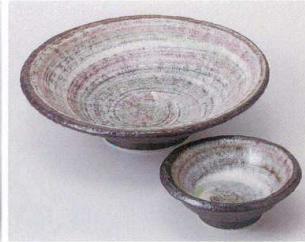
タ023-15 粉引5.5平鉢 φ17×4.7cm 1,300円 タ023-16 粉引丸千代口 φ9×3.3cm 450円