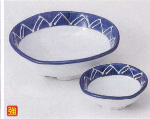
口023-23 一珍清流刺身鉢 15×4.5cm 1,300円 口023-24 一珍清流千代口 9×3.2cm 540円