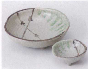
ツ023-29 ビードロ三ツ足向付 14×14×4cm 1,430円 ツ023-30 ビードロ三ツ足千代口 7.2×7.2×2.8cm 470円