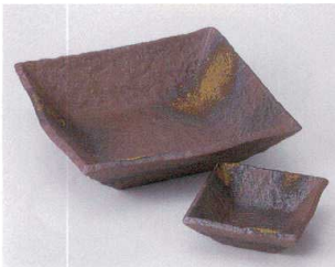
ト023-33 焼締正角向付 16.7×16.7×4.1cm 1,400円 ト023-34 焼締正角千代口 8.4×8.4×2.8cm 490円