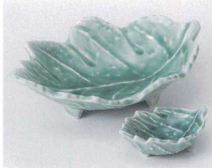
ト023-03 深青地葉型向付 20×13.5×5.7cm 1,480円 ト023-04 深青磁葉型千代口 8.5×5×3cm 760円