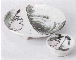
タ023-21 織部刷毛目6.0皿 18.7×18.5×3.8cm 1,300円 タ023-22 織部刷毛目丸千代口 φ8.5×3.5cm 360円