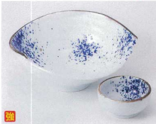
ツ023-17 ちぎり吹墨5.5向付 18×14.5×7.5cm 1,350円 ツ023-18 ちぎり吹墨丸千代口 φ6.7×3.2cm 670円