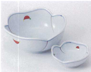
口023-25 赤絵花型刺身 15.5×6cm 1,400円 口023-26 赤絵花型千代口 9×3.2cm 370円