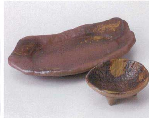
ア023-39 美濃岩石刺身皿 21.5×12.6×3.3cm 1,350円 ア023-40 美濃岩石千代口 8.9×8.7×3.2cm 520円