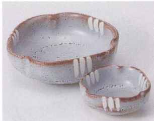
タ023-27 鼠志野刺身鉢 15.3×14.5×5cm 1,320円 タ023-28 鼠志野千代口 9.2×8.5×3.5cm 550円