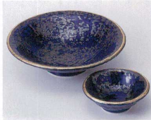
タ023-13 銀彩刺身鉢 φ17×4.5cm 1,300円 タ023-14 銀彩千代口 φ9×3.5cm 480円