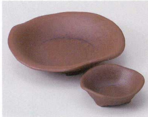
タ023-19 焼締赤土三ツ足6.0皿 19×18.7×4cm 1,300円 タ023-20 焼締赤土三ツ足3.0皿 9.5×9.3×3.3cm 450円