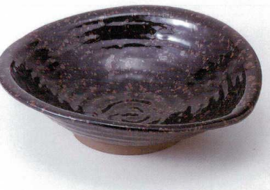
ト232-13 こはく大鉢 33×30.5×9.2cm 4,300円