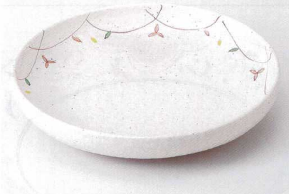
ミ232-14 粉引小花尺盛鉢 φ31×6cm 5,700円