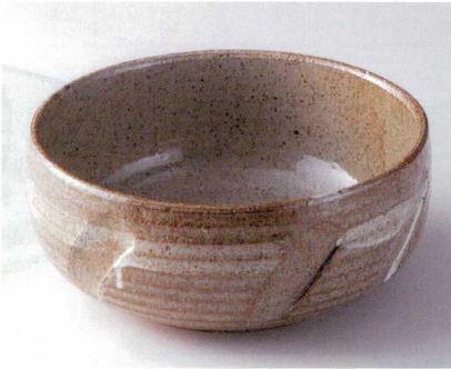
ト232-02 白刷毛土灰釉どら鉢 φ31.5×13.3cm 13,600円