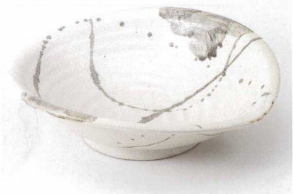
ト232-15 織部チラシ楕円盛鉢 33.7×30.5×9.5cm 4,350円