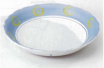
ミ232-12 トリトン尺二深皿 φ36.7×6.5cm 7,200円