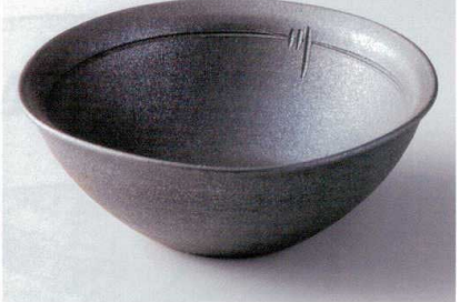
×232-08 炭化窯変11.0大鉢 φ33.5×11.5cm 9,900円