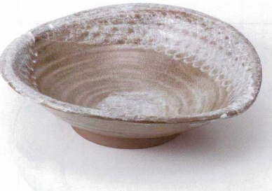
ト232-10 唐津白タタキ盛鉢 33.7×30.5×9.5cm 4,350円