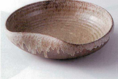
×232-06 古窯13.0大鉢 38×36×10cm 12,000円