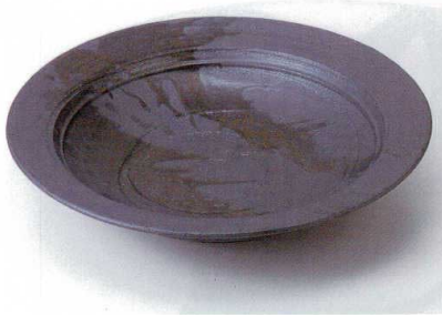
ト232-01 黒砂流し尺三深皿 φ41×7.7cm 38,000円