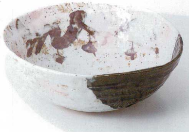
ツ232-05 織部古木大鉢 31×27×11cm 11,800円