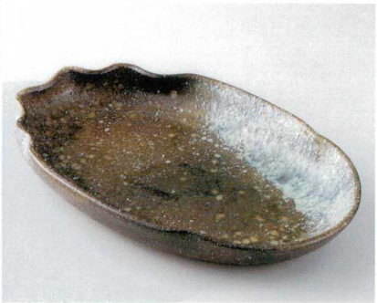
×232-03 焼ムビーードロ16.0小判鉢 48×30×6.5cm 12,000円 ×232-04 焼ムビーードロ13.0小判鉢 39×23.5×6cm 7,150円