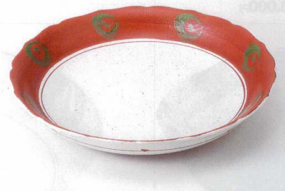
ミ232-11 火の国尺二深皿 φ36.7×6.5cm 7,200円