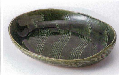
ミ235-03 織部楕円串目大盛込鉢 32.5×26×5cm 10,300円