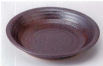
ネ235-04 大盛鉢錆油滴大 φ33×5.0cm 7,300円