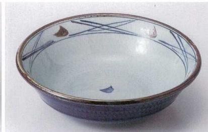
ネ235-06 呉須巻錆点9.0鉢 φ28×8.2cm 4,500円