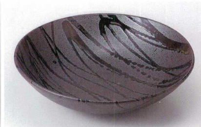
ツ235-08 黒織部流し尺鉢 30×8cm 5,300円