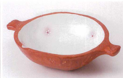
ミ235-11 ピンク吹小花朱巻手付大鉢 32.5×23.2×8cm 3,750円