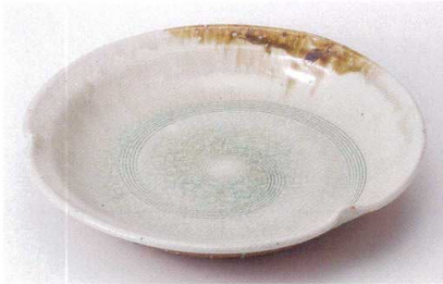
ネ235-01 伊賀渦三ツ押尺鉢 φ29.7×5.0cm 5,650円