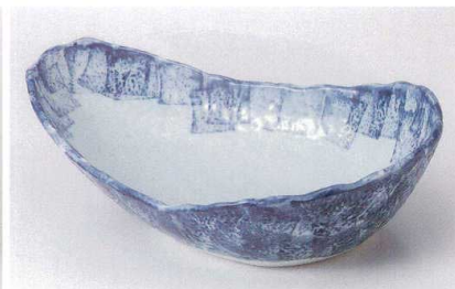
ツ235-15 ゴスハケメ三角型大鉢 32.3×19.8×8.6cm 3,400円 ツ235-16 ゴスハケメ三角型中鉢 17.8×12.3×5.6cm 840円 ツ235-17 ゴスハケメ三角型小鉢 12.4×8.7×4cm 550円