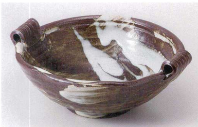
ユ235-10 白流両手付盛鉢 28×25×11cm 4,000円