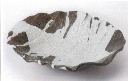
ツ235-09 カイラギ甲羅型大皿 30.5×28.5×7cm 4,800円