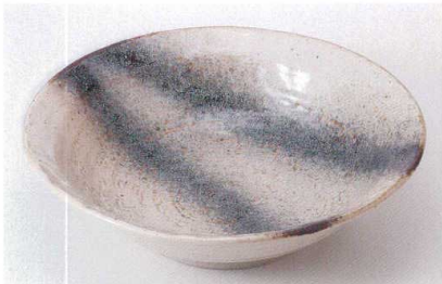
ハ235-07 銀河石目リム尺鉢 φ31×8.6cm 5,400円