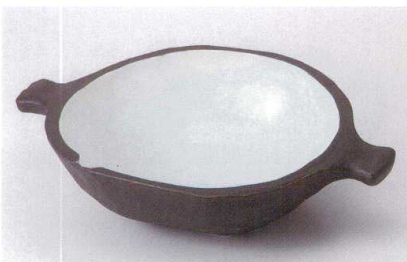
テ235-13 黒伊賀中白手付大鉢 33×22.5×8.8cm 3,600円