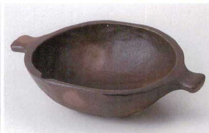
ミ235-14 黒伊賀備前吹手付大鉢 32.5×23.2×8cm 3,100円