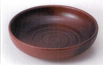
テ235-02 赤楽黒吹10.0鉢 φ32.2×7.8cm 16,500円