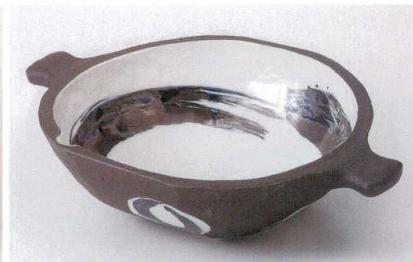
オ235-12 黒伊賀ゴスハケ手付大鉢 32.8×22.5×8.6cm 3,650円