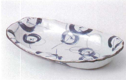
ア239-01 かいらぎ丸紋楕円尺一盛鉢 33.5×19.7×5.8cm 4,000円