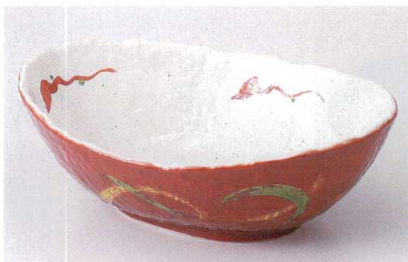
ミ239-07 朱巻武蔵野楕円大鉢 27.3×19.8×9.2cm 4,100円