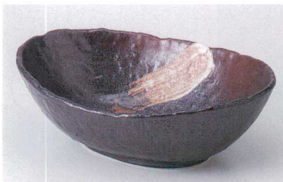
ツ239-10 白刷毛唐津石目楕円鉢(大) 27.5×19.5×9.5cm 3,100円