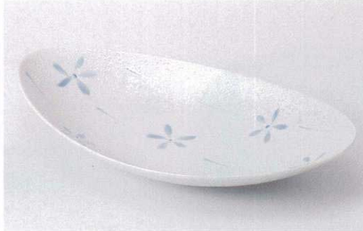
オ239-02 ラスターブルー花楕円鉢 30.8×17.2×5.4cm 3,450円