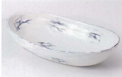
タ239-03 化粧流ダ円大鉢 30.3×16.2×7.3cm 3,300円