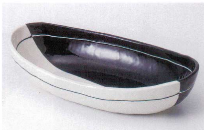
ホ239-12 W&B楕円盛鉢 28.5×15×6cm 2,800円