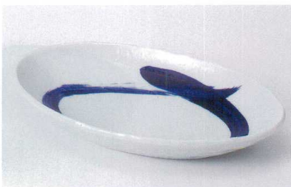
ホ239-15 呉須刷毛目舟形盛鉢 29.5×18×4.5cm 1,800円 ホ239-16 呉須刷毛舟型鉢 24.5×13.5×4cm 950円