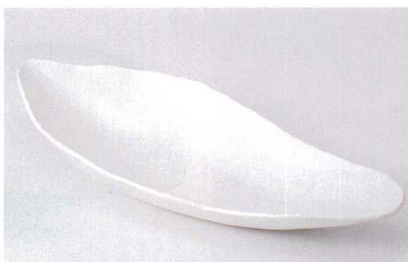
ミ239-05 白釉木の葉型盛鉢 43×18×6.5cm 2,800円