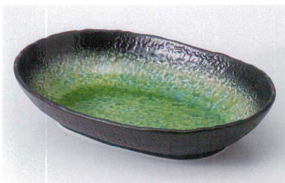
ホ239-13 有明小判型8.0盛鉢 26×18cm 1,900円 ホ239-14 有明小判型7.0盛鉢 22.5×15.5cm 1,520円