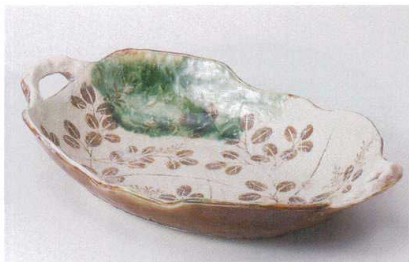
ア239-09 織部萩両手付尺一盛鉢 34.5×20×6cm 3,800円