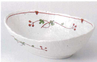
ミ239-08 さくらんぼ楕円大鉢 27.4×19.7×9.2cm 4,000円