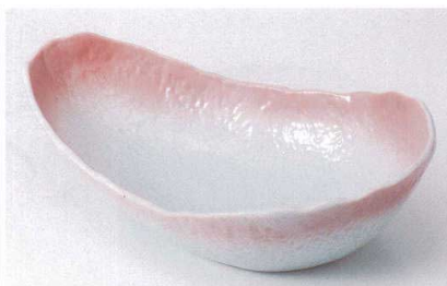
ホ239-06 ピンク吹クジラ鉢(大) 32×20×9cm 3,570円