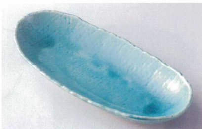
ホ239-17 トルコ舟型盛鉢 33×14×5cm 1,700円