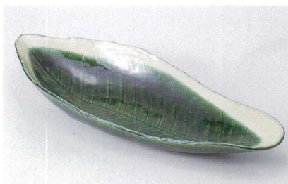
ミ239-04 和匠木の葉型盛鉢 43×18×6.5cm 3,000円