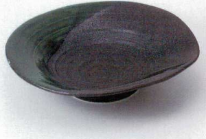
ア240-01 黒結晶緑流盛皿大 φ26.8×6.5cm 4,000円 ア240-02 黒結晶緑流盛皿小 φ20.3×5cm 2,600円