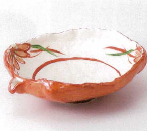
ミ240-07 粉引朱巻花絵片口盛鉢 26.5×22×8cm 4,550円