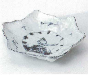
オ240-14 染付岩鳥変型六角9.0皿 29.0×27.5×6.8cm 4,260円