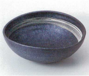
×240-10 黒窯変刷毛目8.0足付楕円鉢 25×22×10cm 3,850円