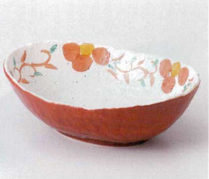
ミ240-09 朱巻唐草花楕円大鉢 27.3×19.8×9.2cm 4,200円