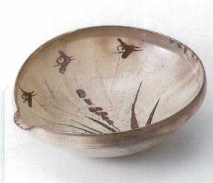
オ240-08 唐津麦片口楕円鉢 23.5×20×8cm 4,680円