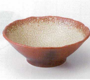
タ240-15 赤伊賀炭吹8.0反鉢 φ26.3×9.5cm 3,700円