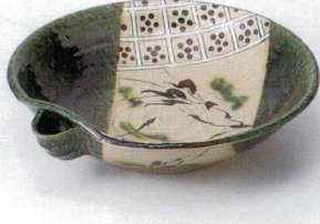
ツ240-03 片口織部新格子9.0盛鉢 26.7×25×6.5cm 7,500円