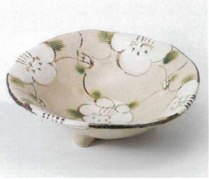
ア240-13 山茶花三ツ足8.0盛鉢 φ24×7cm 3,800円