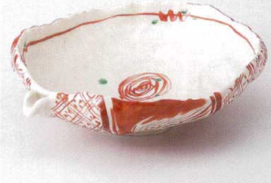
カ240-04 赤絵片口手鉢 26×21.7×7.3cm 5,800円