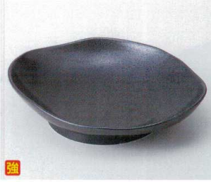
ミ240-16 強化黒釉楕円盛鉢 28×23×5.5cm 3,550円