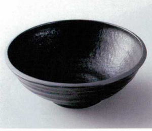
ハ240-19 黒水晶荒引大鉢 φ23.6×8.8cm 1,680円