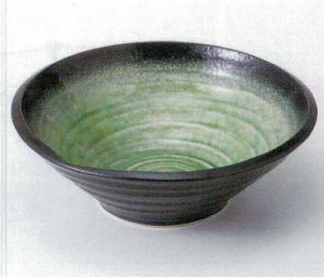
ト240-12 有明富士型8.5井 φ26.5×9cm 4,000円