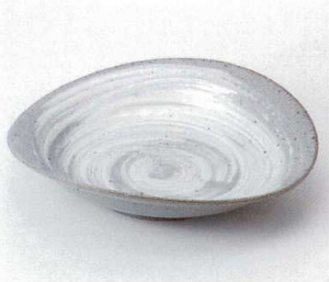
ネ240-06 粉引刷毛目楕円盛皿 28×26×6.5cm 4,700円