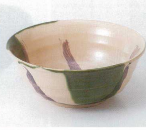
ア240-20 織部流し8.0井 φ23.5×9.6cm 2,400円