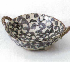
ア240-11 タコ唐草両手付盛鉢 30.5×26×9.5cm 3,800円