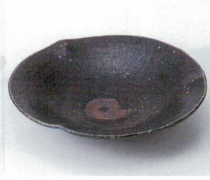
ヤ240-21 いぶし天目8.0なぶり平皿 φ23.5×5.2cm 1,780円 ヤ240-22 いぶし天目7.0なぶり平皿 φ19×5cm 1,100円 ヤ240-23 いぶし天目5.0なぶり平皿 φ15.5×4cm 760円