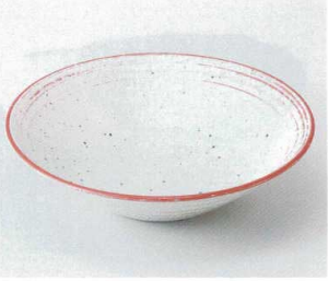
ハ240-17 朱音8.0鉢 φ26.2×7cm 2,580円 ハ240-18 朱音7.0鉢 φ23.2×6.4cm 2,080円