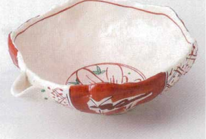
ア240-05 志野赤絵片口8.0鉢 24.5×19.5×8.7cm 4,400円