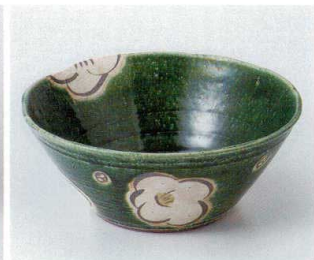
オ246-10 織部椿盛鉢 21.5×9cm 3,500円