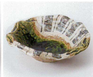
夕246-14 織部錆十草向付 22×20×6.5cm 2,860円