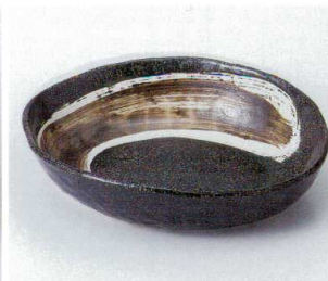
イ246-23 一文字彫刻楕円鉢 24.8×21×6cm 1,490円