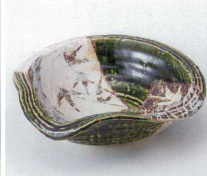
カ246-03 志野織部片口7.0盛鉢 21.5×19×7.8cm 5,300円