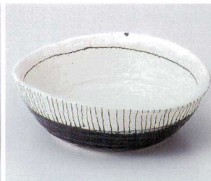
キ246-18 黒釉錆十草変形7.0鉢 22×20×7.5cm 2,300円