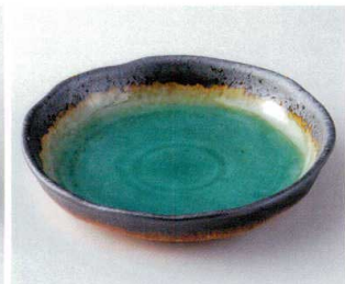
ミ246-24 緑彩70浅鉢 φ21.5×4cm 1,100円