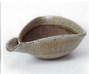
オ246-19 唐津花紋片口(中) 17.5×13×6.8cm 2,080円 オ246-20 唐津花紋片口(小) 14.5×11×5cm 1,660円