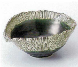
オ246-11 織部十草片口深鉢 20×17.6×8.7cm 3,410円