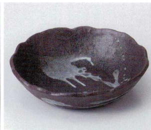
ウ246-08 備前白流8.0丸鉢 24.4×6cm 4,100円 ウ246-09 備前白流6.0鉢 21×5.4cm 3,250円