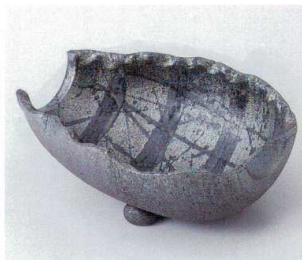
×246-07 黒窯変7.0変型鉢 21×16×8cm 4,400円