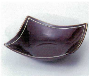
ア246-15 琥珀スクエアボール大 21.7×21.7×7.5cm 2,470円