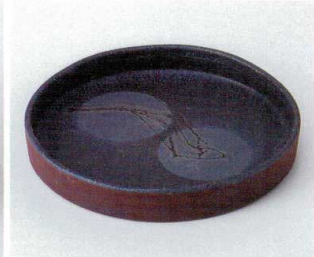
×246-04 暁ボタモチ丸鉢 φ22.5×3cm 4,850円