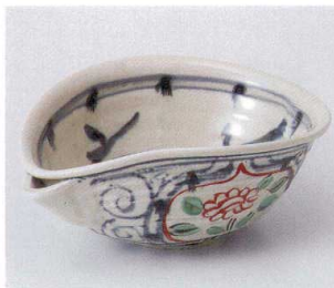
オ246-12 赤絵安南片口6.5鉢 20×15×8.5cm 3,280円