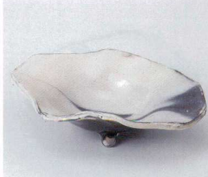
×246-02 白化粧ぼかし8.0三ツ足変型鉢 24×17.5×6.5cm 5,800円