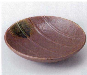
ウ246-22 信楽十草彫6.0鉢 φ18×4.6cm 1,500円