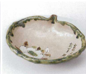
夕246-13 乾山白牡丹向付 22×18.5×7cm 3,000円