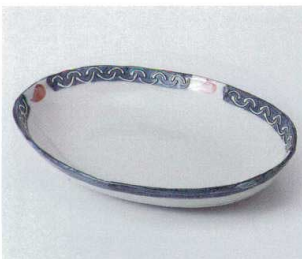
口246-21 潤一珍8.0小判型鉢 24.4×18.7×4.1cm 1,800円