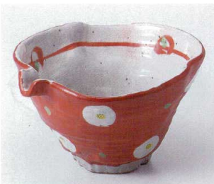
オ246-05 志野釉赤巻梅5引し片口大鉢 20.5×18×12cm 4,520円 オ246-06 志野釉赤巻梅5引し片口中鉢 17.3×15.5×9.8cm 3,400円