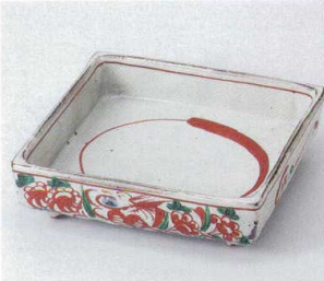
カ246-01 粉引花鳥8.0角鉢 18.5×18.5×5.5cm 9,000円