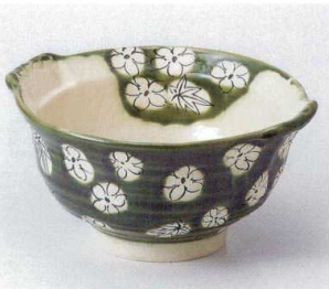
ソ248-09 織部春秋鍋型6.0鉢 18×16.3×9cm 3,200円