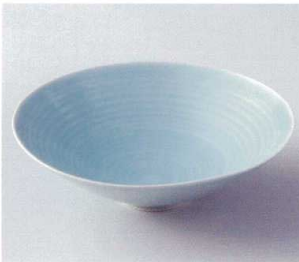
イ248-11 波紋7.5盛鉢 φ23×7cm 2,850円