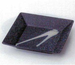
カ248-14 銀彩黒スクウェア角鉢 23.8×23.8×4.5cm 2,460円