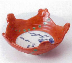
オ248-01 ダミ山水赤巻五角鉢 22.0×21.5×9.8cm 5,100円