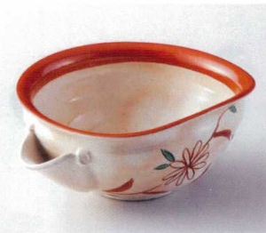
ウ248-06 赤絵菊粉引片口中鉢 19.7×16.4×8cm 3,680円