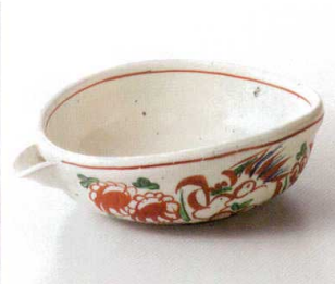
カ248-04 粉引花鳥片口鉢 23×18.5×7cm 9,000円