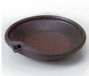
ソ248-08 炭化土片口7.5寸鉢 23.3×23×6.4cm 3,300円