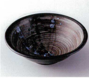
モ248-20 寒露円8寸深鉢 φ24×7.8cm 1,350円