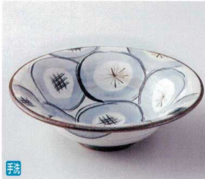
テ248-03 粉引呉須丸紋測反7.5平鉢 φ23.8×7.2cm 4,000円