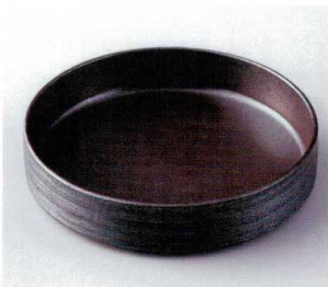
ト248-07 銀吹外クシメ21cm鉢 φ21.2×4.5cm 3,350円