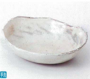
テ248-05 粉引櫛目楕円鉢 21×17×5.5cm 3,800円