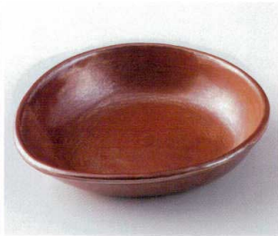
口248-17 紅結晶たまご型7.0浅鉢 21.7×20×4.8cm 2,200円