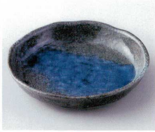
ミ248-21 深海70浅鉢 φ21.5×4cm 1,100円