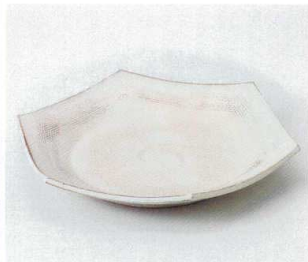
オ248-12 粉引櫛目六角大皿 24×4.8cm 2,800円