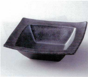
カ248-15 銀黒回角盛鉢 21.5×21×6.5cm 2,600円 カ248-16 銀黒回角平鉢 16.5×16.5×4.5cm 1,600円