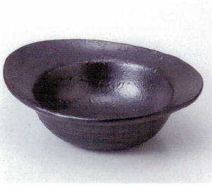
カ248-18 ブラック包み鉢 18.7×15.8×6cm 1,400円