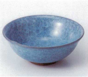
A248-13 青磁亀甲貫入一押盛鉢 φ18.8×7.5cm 2,500円