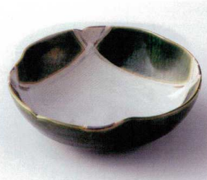
口248-02 織部格子三ツ押盛鉢 19.5×19.2×6.5cm 4,130円