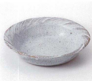
タ249-14 さざ波盛鉢 20.5×20×4.8cm 2,100円