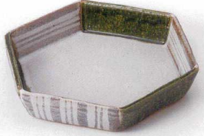
カ249-02 織部十草六角前菜皿 21.5×19cm 4,700円