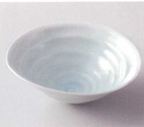
タ249-15 青白磁うず瀬6.5鉢 20.5×19.2×7.5cm 2,200円 タ249-16 青白磁うず瀬6.0鉢 18×17×6.7cm 1,400円