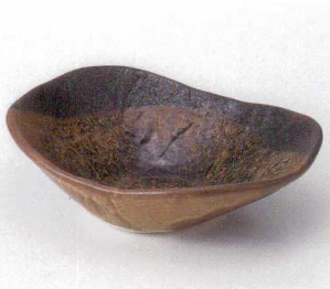
カ249-17 武山楕円多用鉢 21×17×6.5cm 1,850円