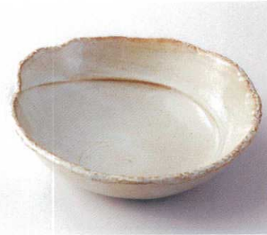
ネ249-10 黄化粧土具型大鉢 26×24×7.3cm 2,600円