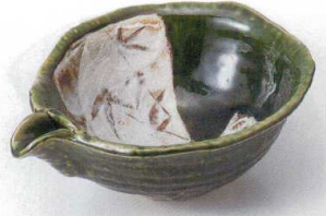
ミ249-03 山草花片口盛鉢 24×19×8.5cm 3,800円