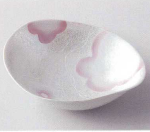
ト249-12 桃花ラスターネジリ鉢 22.5×17.8×6.7cm 2,500円