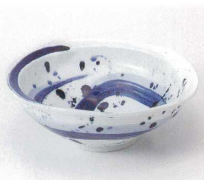
ト249-07 ゴス刷毛7.5寸深鉢 22.3×20.5×7.4cm 3,150円