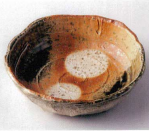
タ249-11 満月丸鉢 φ19×5.7cm 2,500円