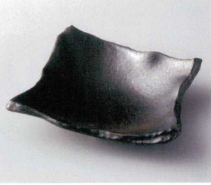
カ249-04 銀サビ黒ちぎり角皿(大) 23.7×20.7×6.2cm 2,400円 カ249-05 銀サビ黒ちぎり角皿(中) φ17.7×16×5cm 1,800円