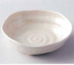
ウ249-13 粉引クリーム麵鉢 φ21.6×20.8×6.4cm 2,620円