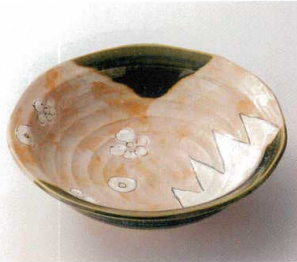
口249-01 織部8.0丸鉢 φ24.5×7.5cm 5,580円