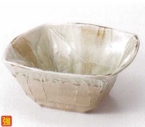
テ249-08 ビードロ四角深鉢 19×19×8.4cm 2,880円