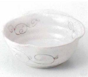
ア249-09 志野唐草6.5深鉢 φ19.5×8cm 2,800円