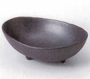
ア249-22 黒結晶三つ足ボール 23×16×8cm 1,350円