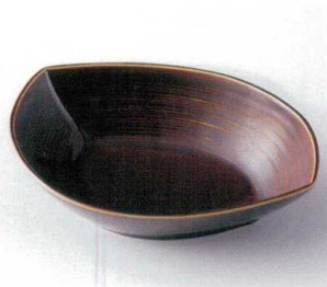
ア249-23 琥珀千段盛鉢 23.5×17×6cm 1,000円