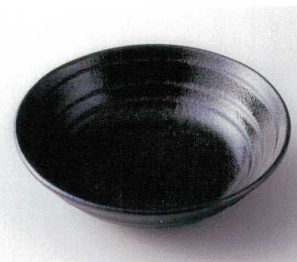
ア249-20 ガオルテックス24cm盛鉢 φ24×6.8cm 1,400円 ア249-21 ガオルテックス22.5cm盛鉢 φ22.3×6.9cm 1,100円