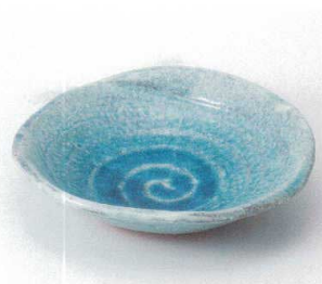
オ249-06 トルコカイラギなぶり鉢 φ22.7×22×5.7cm 3,240円