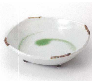
ミ249-19 鳴門貫入6.0おしゃれ鉢 19×19×5.5cm 1,450円