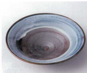
ネ251-17 錆流し7寸深皿 φ23.5×4.7cm 2,400円