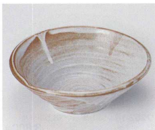
ネ251-06 志野8.5鉢 φ26×9cm 3,900円 ネ251-07 志野7.0鉢 φ22.8×6.5cm 2,200円 ネ251-08 志野5.0鉢 φ16.5×5.5cm 1,300円