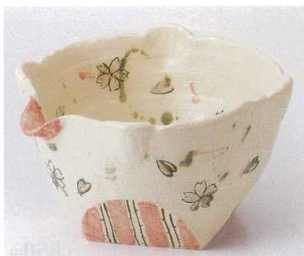
ア251-09 花舞片口深鉢 20.5×18.5×11.5cm 3,300円