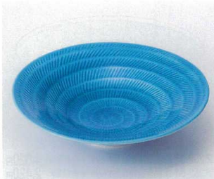
ツ251-03 トルコ青飛びカンナ8.0鉢 φ23.3×5.6cm 5,550円