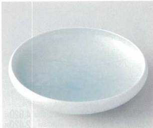
モ251-01 伏山窯 青白磁牡丹7.5鉢 22.5×5.5cm 16,000円 モ251-02 伏山窯 青白磁牡丹6.5鉢 18.6×5.4cm 7,500円