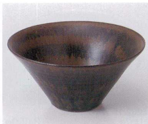
カ251-15 紺窯変深ボール 18.1×8.6cm 2,700円 カ251-16 紺窯変浅ボール φ16.2×6.1cm 1,680円