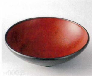
カ251-05 ジャパネスク手造7寸盛鉢 22.2×6.5cm 4,750円