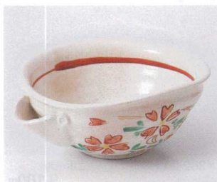
キ251-13 赤絵桜片口楕円鉢 20×17.5×7.5cm 2,750円