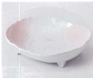
ア251-18 桃山桜四つ足盛鉢 20.6×19.7×7.7cm 2,200円