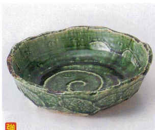
ツ251-14 オリベ6.0鉢 19.5×19.2×5.4cm 2,700円