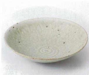
カ251-19 ビードロヒワ6.5寸鉢 20.4×4.8cm 1,950円