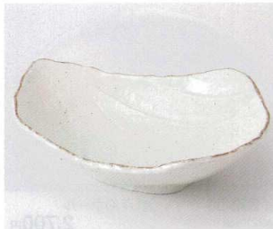
ツ251-24 測サビ巻粉引荒瀬大鉢 22×18×6.5cm 1,550円 ツ251-25 測サビ巻粉引荒瀬小鉢 15×12×5.5cm 700円