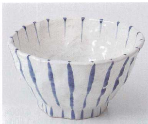
ロ251-10 呉須十草大鉢 φ18.8×10.5cm 3,200円