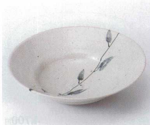
オ251-04 一文字黒木ノ葉段付7.0鉢 φ21.7×5.7cm 4,320円