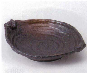
ヤ251-20 黒備前全茶吹芳躰手付鉢大 23×18×4.5cm 1,780円 ヤ251-21 黒備前全茶吹芳躰手付鉢小 17.5×13.5×4.2cm 1,050円