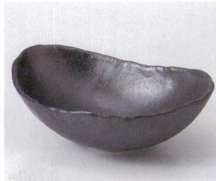
カ251-26 黒マット変形鉢 21.7×15.5×7.3cm 1,400円