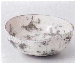
ユ251-11 布目雲海槽円深鉢(大) 20×18×8.5cm 2,800円 ユ251-12 布目雲海槽円深鉢(小) 15.5×12×7cm 2,100円