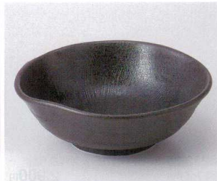
ツ251-22 黒緑片口大鉢 22×21×7.5cm 1,750円