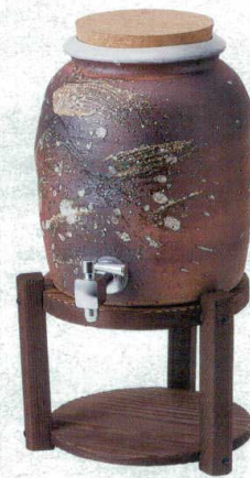
マ258-13 古信楽焼酎サーバー・焼杉台付 φ23×24cm(台φ20×16cm)・(3600cc) 23,000円