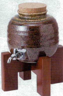
カ258-11 伊賀釉1号サーバー 1800cc 8,600円