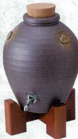
カ258-01 伊賀吹5号サーバー 9000cc 36,000円