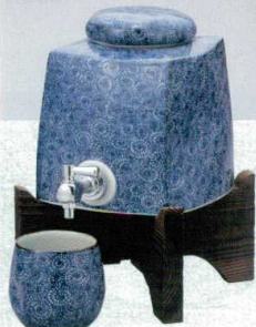
マ258-14 印判唐草 マルチサーバー 2300cc(1入)(有田焼) 17,000円