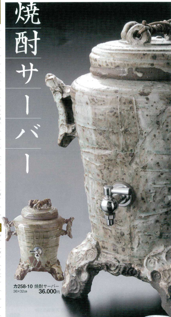
カ258-10 焼酎サーバー 36×32cm 36,000円