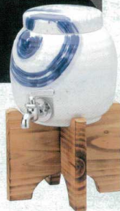
マ258-18 刷毛渦(木台付) マルチサーバー 1450cc(1入)(有田焼) 6,600円