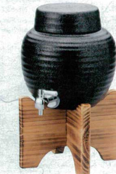
マ258-21 天目吹 マルチサーバー(5.0ℓ) 22×22cm(5000cc)(1入)(輸入品) 6,800円