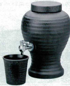
マ258-19 古窯 焼酎サーバー(黒)(1.8ℓ) 15.5×25cm(1800cc)(1入)(輸入品) 5,400円