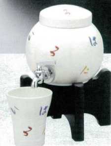
マ258-16 いろは マルチサーバー 1400cc(1入)(有田焼) 7,500円