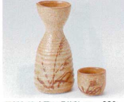
ア266-46 志野1.5号徳利 270cc 880円 ア266-47 志野8寸徳利 130cc 480円 ア266-48 志野蓋 φ5×4.2cm 230円