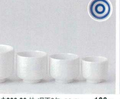
ウ266-86 蛇/目蓋3号 5.2×5cm 190円 ウ266-87 蛇/目蓋2.5号 4.9×4.3cm 160円 ウ266-88 蛇/目蓋2号 4.2×3.8cm 150円