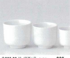
ウ266-83 蛇/目蓋1号 8×7.2cm 860円 ウ266-84 蛇/目蓋2号 7×6.6cm 520円 ウ266-85 蛇/目蓋3号 6×5.6cm 290円