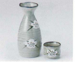
ウ266-25 益子白梅1.5号徳利 250cc 970円 ウ266-26 益子白梅8寸徳利 150cc 480円 ウ266-27 益子白梅グイ呑 φ5×4cm 260円