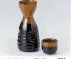
ア266-67 金流し1.5号徳利 275cc 750円 ア266-68 金流し8寸徳利 130cc 440円 ア266-69 金流し蓋 φ5×4.2cm 200円