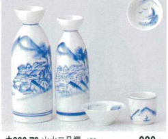
ウ266-79 山水三号罎 430cc 920円 ウ266-80 山水二号罎 270cc 630円 ウ266-81 山水中罎 φ7.6×3.1cm 160円 ウ266-82 山水タル型グイ呑 φ4.8×4.7cm 260円