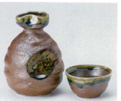
ト266-13 砂目二合徳利 300cc(10入) 1,050円 ト266-14 砂目一合徳利 160cc(20入) 600円 ト266-15 砂目蓋 φ6.6×3.5cm(60入) 370円