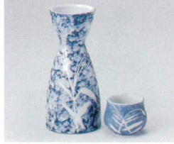
ア266-16 淡雪芦1.5号徳利 275cc 1,050円 ア266-17 淡雪芦8寸徳利 130cc 600円 ア266-18 淡雪芦蓋 4.7×4.5cm 300円