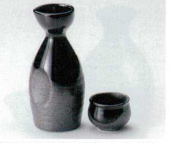
キ266-58 天目ガラス半掛2号徳利 260cc(10入) 800円 キ266-59 天目ガラス半掛1号徳利 140cc(10入) 400円 キ266-60 天目ガラス半掛蓋 φ6.1×4cm(30入) 250円