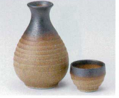
タ266-40 炭こがし徳利(大) 340cc 880円 タ266-41 炭こがし徳利(小) 200cc 710円 タ266-42 炭こがし蓋 φ5.5×3.8cm 240円