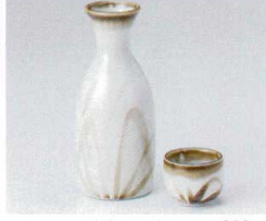
ア266-31 乳白芦1.5号徳利 275cc 900円 ア266-32 乳白芦8寸徳利 160cc 460円 ア266-33 乳白芦蓋 φ5.3×4cm 260円