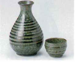
タ266-37 オフケ徳利大 330cc 880円 タ266-38 オフケ徳利小 200cc 710円 タ266-39 オフケ蓋 φ5.5×3.8cm 240円