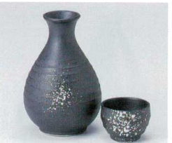
カ266-10 錆吹2号徳利 330cc 1,050円 カ266-11 錆吹1号徳利 180cc 800円 カ266-12 錆吹グイ呑 φ5.6×3.8cm 280円