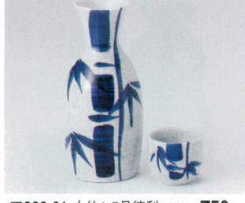
ア266-61 太竹1.5号徳利 275cc 750円 ア266-62 太竹8寸徳利 130cc 440円 ア266-63 太竹蓋 5×4.2cm 200円