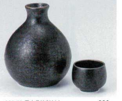
ハ266-73 黒水晶徳利(大) 400cc(10×8入) 630円 ハ266-74 黒水晶徳利(小) 270cc(10×10入) 500円 ハ266-75 黒水晶蓋 φ4.5×4cm(300入) 220円