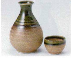
タ266-34 伊賀織部徳利(大) 340cc 880円 タ266-35 伊賀織部徳利(小) 200cc 710円 タ266-36 伊賀織部蓋 φ5.5×3.8cm 240円