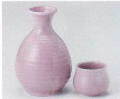
ア266-04 吹桃山丸2号徳利 300cc 1,100円 ア266-05 吹桃山丸1号徳利 175cc 580円 ア266-06 吹桃山蓋 5.2×4.5cm 300円