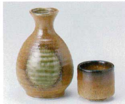
ヨ266-01 伊賀織部徳利(大) 250cc 1,150円 ヨ266-02 伊賀織部徳利(小) 150cc 600円 ヨ266-03 伊賀織部蓋 50cc 350円