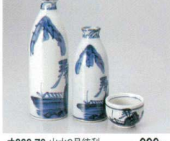
オ266-76 山水2号徳利 990円 オ266-77 山水1号徳利 860円 オ266-78 山水丸グイ呑 5.4×3.7cm 580円