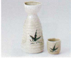
ヤ266-19 石焼織部蓋2号徳利 320cc(100入) 1,030円 ヤ266-20 石焼織部蓋1号徳利 200cc(120入) 600円 ヤ266-21 石焼織部蓋グイ呑 φ4.6×4.7cm(200入) 330円