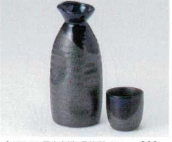
ウ266-52 黒吹青掛2号徳利 300cc 860円 ウ266-53 黒吹青掛1号徳利 170cc 520円 ウ266-54 黒吹青掛グイ呑 φ4.8×4.8cm 280円