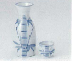
ト266-28 滴笹1.5号徳利 300cc(10入) 920円 ト266-29 滴笹8寸徳利 150cc(20入) 470円 ト266-30 滴笹蓋 φ5×4.3cm(40入) 280円