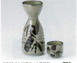
ア266-64 益子竹1.5号徳利 275cc 750円 ア266-65 益子竹8寸徳利 130cc 440円 ア266-66 益子竹蓋 φ5×4.2cm 200円