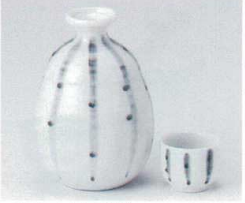
ト266-22 点十草2号徳利 350cc(10入) 1,000円 ト266-23 点十草1号徳利 170cc(20入) 570円 ト266-24 点十草グイ呑 4.8×3.9cm(40入) 320円