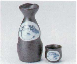
キ266-07 ふく2号徳利 260cc(10入) 1,100円 キ266-08 ふく1号徳利 160cc(10入) 650円 キ266-09 ふく蓋 φ4.8×4cm(30入) 380円