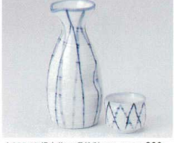
ト266-49 満十草1.5号徳利 270cc(10入) 880円 ト266-50 満十草8寸徳利 150cc(20入) 470円 ト266-51 満十草蓋 φ5×4cm(40入) 280円