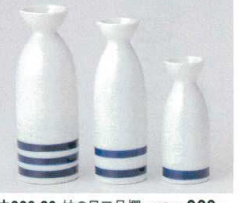
ウ266-89 蛇の目三号罎 410cc 960円 ウ266-90 蛇の目二号罎 260cc 580円 ウ266-91 蛇の目一号罎 150cc 420円