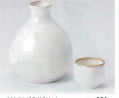
ハ266-70 粉引徳利(大) 400cc(10×8入) 630円 ハ266-71 粉引徳利(小) 270cc(10×10入) 500円 ハ266-72 粉引蓋 φ4.5×4cm(300入) 220円