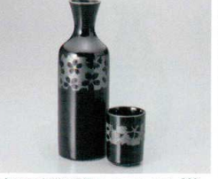
ウ266-55 銀彩桜2号罎 5.8×17.6cm(260cc)(10入) 860円 ウ266-56 銀彩桜1号罎 5.1×13.2cm(140cc)(20入) 630円 ウ266-57 銀彩桜グイ呑 φ4.2×5.6cm 320円