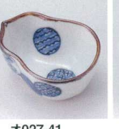
オ027-41 丸紋ひさご珍珠 6.3×5×2.8cm 400円