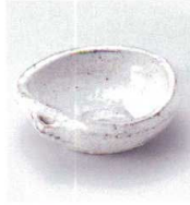
コ027-08 新粉引変型珍珠 φ7.5×3cm 1,300円