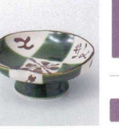
タ027-07 織部格子新高台千代口 8×7.5×4.5cm 460円