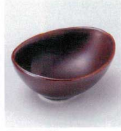
モ027-10 墨皿パーティール(3.5ボ-ル(ア)) 9×7×3.2cm 630円