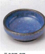
テ027-37 青かいらぎ豆千代口 φ6.8×2.5cm 480円