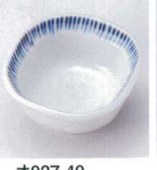
オ027-40 細十草変型珍珠 5.8×5.8×2.8cm 400円