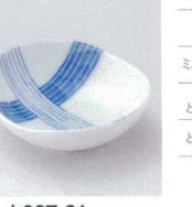
ホ027-21 モダン十草小付 8.5×8×3cm 320円