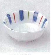
マ027-25 十草雪輪 小付 8.5×3cm 330円