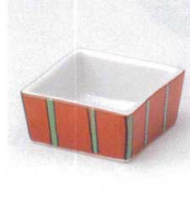
ウ027-15 赤巻十草四角珍珠入 6×6×3cm 640円