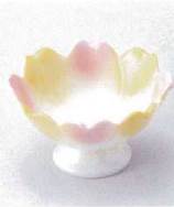
タ027-02 色吹花高台珍珠 φ8.8×4.7cm 780円