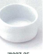
ア027-35 千段小付 φ6.3×3.4cm 470円