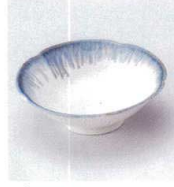
ウ027-22 ウノ朝顔型千代口 φ9×3cm 530円