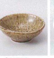
タ027-13 田園豆千代口 8.8×8.4×3.3cm 320円