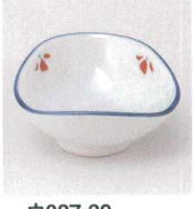
ウ027-39 小花三角珍珠入 6×2.3cm 460円