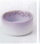
ア027-05 武蔵野切立珍珠 φ6.3×3cm 750円