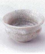
コ027-09 錆梅花波ひねり珍珠 7.5×6.5×4cm 900円