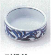
ア027-32 手描き唐草スタック φ8×3cm 470円