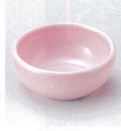
ロ027-17 ピンク丸千代口 φ7.3×3.2cm 640円