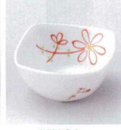
マ027-24 小菊角 姫小付 6.5×3.5cm 400円