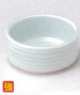
ウ027-23 青磁千段切立千代口 φ6.6×3cm 470円