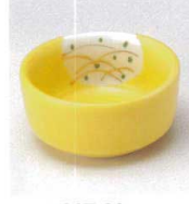
ツ027-29 黄釉丸千代口 φ6.3×3cm 700円