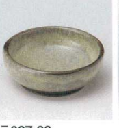
テ027-33 ピワかいらぎ豆千代口 φ6.8×2.5cm 480円