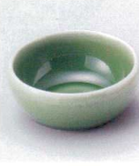
ロ027-16 ピワ丸千代口 φ7.3×3.2cm 640円