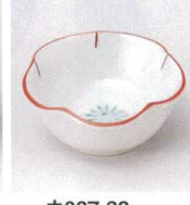
ウ027-38 梅花型珍珠入 6×2.3cm 460円