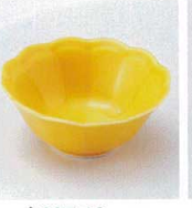
タ027-19 輪花珍珠黄 φ7.9×3.4cm(中国) 360円