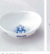
カ027-20 吹墨吉まゆ型小付 8.4×7.9×2.9cm 350円