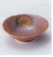
ウ027-11 信楽朝顔型千代口 φ9×3cm 530円