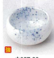
ウ027-36 吹墨丸珍珠 φ6×3.2cm 480円