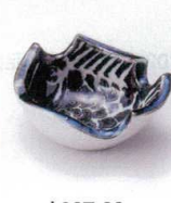
オ027-30 魚千代口 8.5×6.8×3.5cm 650円