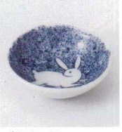
ネ027-18 布目吹墨うさぎ珍珠 7.2×2.2cm 470円