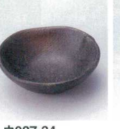
ウ027-34 備前風カヤメ珍珠 7.4×2.4cm 440円