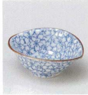
ツ027-03 染付すげ傘千代口 8.8×7×3.3cm 770円