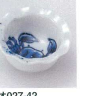
オ027-42 吹墨測波カニ珍珠 6×2.7cm 400円