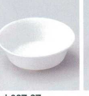
ホ027-27 シャープ丸深小皿 φ8×2.6cm(中国) 260円