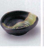
イ027-12 織部流し小付 8.6×7.5×3cm 360円