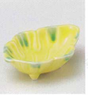
ツ027-04 黄釉グリーン流葉型千代口 10.3×6.7×2.9cm 840円