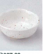
ミ027-28 萩志野花形珍珠 φ8.5×3.2cm 280円