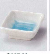
ミ027-26 白雲正角珍珠 7.3×7.3×3cm 300円