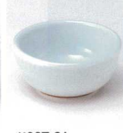
ツ027-31 青白磁トチリ千代口 φ8.3×4cm 480円