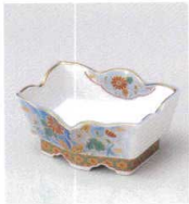
ツ027-01 染錦あげぼの菊千代口 9×7.2×4.2cm 800円