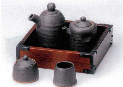
ユ282-25 錆黒汁次(大) 約250cc(60入) 1,800円 ユ282-26 錆黒汁次(小) 約160cc(60入) 1,600円 ユ282-27 錆黒辛子入 4.5×5.5cm(80入) 1,100円 ユ282-28 錆黒楊子入 4×4.5cm(80入) 950円 W282-29 元禄正角カスター 18.5×18.5×H4.5cm 4,850円