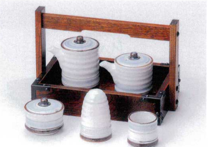
ヨ282-30 淡彩ライン汁次(大) 6.5×9.5cm(140cc) 1,200円 ヨ282-31 淡彩ライン汁次(小) 6.5×7cm(100cc) 1,100円 ヨ282-32 淡彩ライン辛子入 6.5×5cm 1,000円 ヨ282-33 淡彩ライン振掛 5.2×8.0cm 950円 ヨ282-34 淡彩ライン楊子差し 4.5×4.8cm 550円 W282-35 元禄長角手付カスター 24×14.5×1.5cm 6,150円