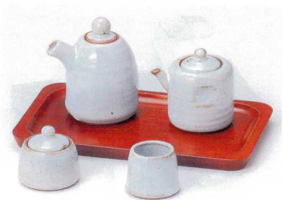
ツ282-14 灰釉汁次(大) 250cc(10入) 1,700円 ツ282-15 灰釉汁次(小) 150cc(10入) 1,500円 ツ282-16 灰釉辛子入れ 6×5.5cm(10入) 990円 ツ282-17 灰釉楊子入 4×5.5×4.5cm 850円 W282-18 カスター一盆(大) 24×14×1.5cm 2,450円