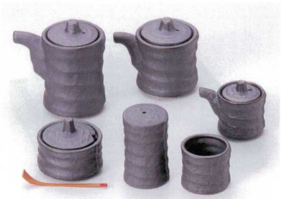
タ282-44 いぶし黒つつみ汁次(大) φ5.9×9.2cm(150cc) 1,500円 タ282-45 いぶし黒つつみ汁次(小) φ6×7.3cm(100cc) 1,400円 タ282-46 いぶし黒つつみミニ汁次 φ4.5×5.5cm(50cc) 1,080円 タ282-47 いぶし黒つつみ辛子入 φ6.1×4.5cm 1,300円 タ282-48 薬味スプーン 8cm 150円 タ282-49 いぶし黒つつみふりかけ φ4×7cm 1,200円 タ282-50 いぶし黒つつみ楊枝入 φ4.5×3.9cm 630円