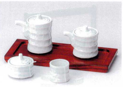
ネ282-51 青白磁汁次大 8.7×6.0×9.5cm(10入) 1,750円 ネ282-52 青白磁汁次小 8.1×5.7×7.1cm(10入) 1,560円 ネ282-53 青白磁辛し φ6.0×4.3cm(10入) 1,500円 ネ282-54 青白磁楊子入 φ4.5×3.9cm(10入) 750円 W282-55 ミニトレイ(大) 25×10.5×1.5(内寸21.7×8.5)cm 2,650円