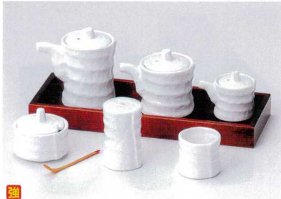
タ282-36 白磁つつみ汁次(大) 9.2cm(150cc) 1,500円 タ282-37 白磁つつみ汁次(小) 7.3cm(100cc) 1,400円 タ282-38 白磁ミニ汁次 5.5cm(50cc) 1,080円 タ282-39 白磁カラシ φ6.1×4.5cm 1,300円 タ282-40 薬味スプーン 8cm 150円 タ282-41 白磁SP φ4×7cm 1,200円 タ282-42 白磁楊枝 φ4.5×3.9cm 630円 タ282-43 長角カスター一台(大) 25×9×2.5cm 2,200円