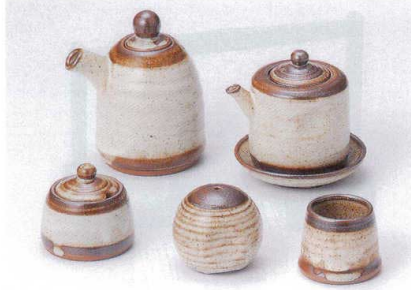
テ282-19 粉引唐津軸正油差し(大) 7.5×11cm(250cc) 2,000円 テ282-20 粉引唐津軸正油差し(小) 6.5×8cm(150cc) 1,800円 テ282-21 粉引唐津軸受皿 9×1.8cm 760円 テ282-22 粉引唐津軸辛子入 6×5.5cm 1,250円 テ282-23 粉引唐津塩入れ 5.5×5.5cm 1,300円 テ282-24 粉引唐津楊子入 5.5×4.5cm 1,000円