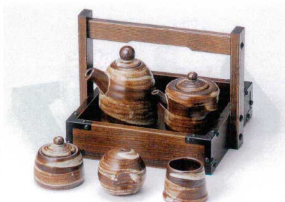
キ282-08 益子刷毛目汁次(大) 7.5×11cm(250cc)(10入) 2,100円 キ282-09 益子刷毛目汁次(小) 6.5×8cm(150cc)(10入) 1,800円 キ282-10 益子刷毛目辛子入れ 4.5×5.5cm(20入) 1,100円 キ282-11 益子刷毛目塩入れ 5.5×5cm(20入) 1,150円 キ282-12 益子刷毛目楊枝入れ 4×4.5cm(20入) 930円 W282-13 元禄手付正角カスター 18.5×18.5×15cm 6,150円