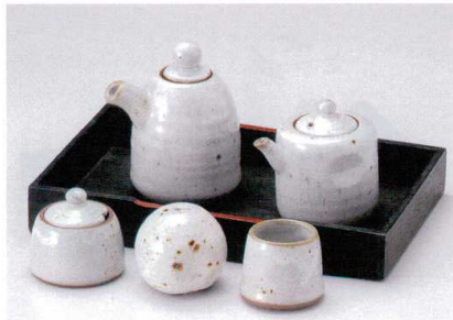
キ282-01 粉引青地汁次(大) 7.5×11cm(250cc) 1,850円 キ282-02 粉引青地汁次(小) 6.5×8cm(150cc)(10入) 1,700円 キ282-03 粉引青地辛子入れ 4.5×5.5cm(20入) 1,100円 キ282-04 粉引青地塩入れ 5.5×5cm(20入) 1,150円 キ282-05 粉引青地楊枝入れ 4×4.5cm(20入) 930円 キ282-06 カスター一盆 23×14×3cm 1,540円