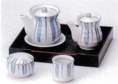
カ282-56 白化粧十草醤油差し(大) 8×8.5cm(250cc) 1,400円 カ282-57 白化粧十草受皿 10.5cm 600円 カ282-58 白化粧十草醤油差し(小) 6×8cm(150cc) 1,350円 カ282-59 白化粧十草辛子入 6.5×4cm 900円 カ282-60 白化粧十草楊子入 5.4×5.4cm 750円 カ282-61 カスター一盆(大) 22.8×18.2cm 1,400円