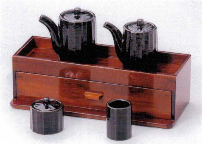
タ282-62 天目のぎ醤油差(大) φ6×9cm(150cc) 1,300円 タ282-63 天目のぎ醤油差(小) φ5.3×8.6cm(110cc) 1,200円 タ282-64 天目のぎ辛子入 φ5×5.2cm 860円 タ282-65 天目のぎ楊枝入 φ4×5.3cm 650円 W282-66 カスター付箸箱(BR) 27×12×8cm 8,850円