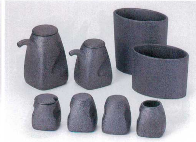
テ283-17 鉄ペーバー角汁次 2,600円 テ283-18 鉄ペーバー角醬油さし 2,000円 テ283-19 鉄ペーバー角からし 1,300円 テ283-20 鉄ペーバー角胡椒 1,100円 テ283-21 鉄ペーバー角塩 1,100円 テ283-22 鉄ペーバー角楊枝 950円 テ283-23 鉄ペーバー小判箸入れ 1,900円 テ283-24 鉄ペーバー小判ナブギン入れ 1,400円