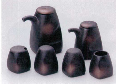
ウ283-25 備前風四角汁次(大) 2,260円 ウ283-26 備前風四角汁次(小) 1,750円 ウ283-27 備前風辛子入 1,240円 ウ283-28 備前風胡椒入(三ツ穴) 980円 ウ283-29 備前風胡椒入(一ツ穴) 980円 ウ283-30 備前風楊枝入 900円