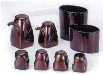
テ283-01 うるしプラウン角汁次 2,600円 テ283-02 うるしプラウン角醬油さし 2,000円 テ283-03 うるしプラウン角からし 1,300円 テ283-04 うるしプラウン角胡椒 1,100円 テ283-05 うるしプラウン角塩 1,100円 テ283-06 うるしプラウン角楊枝 950円 テ283-07 うるしプラウン小判箸入れ 1,900円 テ283-08 うるしプラウン小判ナブギン入れ 1,400円