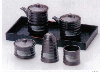
ウ283-68 鉄結晶筒型汁次(大) 1,460円 ウ283-69 鉄結晶筒型汁次(小) 1,320円 ウ283-70 鉄結晶筒型辛子入 1,230円 ウ283-71 鉄結晶胡椒入 1,080円 ウ283-72 鉄結晶楊枝入 620円 W283-73 カスター盆(中) 24.8×13.3×2.4cm 920円