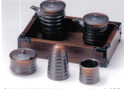
ウ283-62 焼締汁次(大) 1,460円 ウ283-63 焼締汁次(小) 1,300円 ウ283-64 焼締辛子入 1,230円 ウ283-65 焼締塩入 1,080円 ウ283-66 焼締楊枝入 620円 W283-67 元禄長角カスター 22×14.5×4.5cm 4,850円