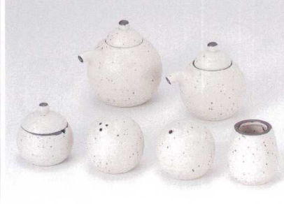
ハ283-31 白唐津汁次大 1,350円 ハ283-32 白唐津汁次小 1,300円 ハ283-33 白唐津薬味入 900円 ハ283-34 白唐津胡椒入 800円 ハ283-35 白唐津塩入 800円 ハ283-36 白唐津楊枝入 600円