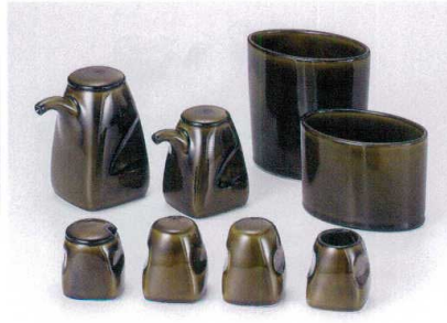
テ283-09 利休織部角汁次 2,600円 テ283-10 利休織部角醬油さし 2,000円 テ283-11 利休織部角からし 1,300円 テ283-12 利休織部角胡椒 1,100円 テ283-13 利休織部角塩 1,100円 テ283-14 利休織部角楊枝 950円 テ283-15 利休織部小判箸入れ 1,900円 テ283-16 利休織部小判ナブギン入れ 1,400円