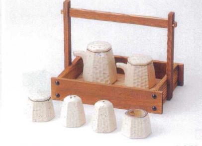
ホ283-55 白御影六角汁次(大) 1,250円 ホ283-56 白御影六角汁次(小) 1,150円 ホ283-57 白御影六角辛子入 800円 ホ283-58 白御影六角胡椒入(三ツ穴) 730円 ホ283-59 白御影六角塩入(一ツ穴) 730円 ホ283-60 白御影六角楊枝入 500円 W283-61 焼杉手付カスター(大) 4,250円