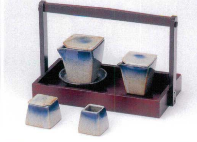
カ283-49 呉須吹角汁次(大) 2,050円 カ283-50 呉須吹3.0受皿 540円 カ283-51 角汁差しコス吹(小) 1,700円 カ283-52 呉須吹辛子入 1,200円 カ283-53 呉須吹楊枝入 920円 カ283-54 手付カスター盆(大) 5,200円