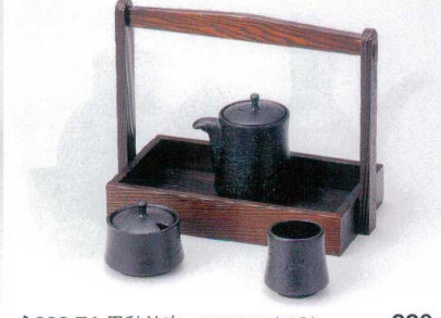
ネ283-74 黒釉汁次 880円 ネ283-75 黒釉辛子入 740円 ネ283-76 黒釉楊子入 330円 W283-77 カスター一台焼杉黒小 21×12×18cm 4,300円