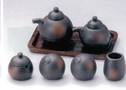
ハ283-37 備前汁次大 1,350円 ハ283-38 備前汁次小 1,300円 ハ283-39 備前薬味入 900円 ハ283-40 備前胡椒入 800円 ハ283-41 備前塩入 800円 ハ283-42 備前楊枝入 600円 W283-43 焼杉調味盆(小) 1,550円