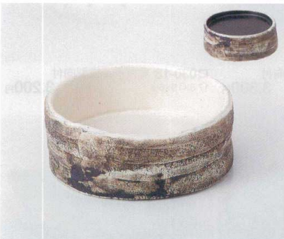
カ029-07 黒白台皿 14×5.2cm 4,000円