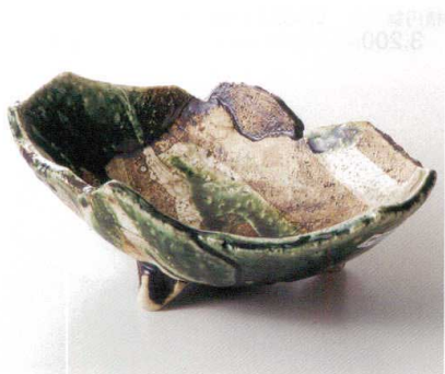
カ029-10 織部やぶれ三ツ足舟型鉢 20.5×15×8cm 4,000円