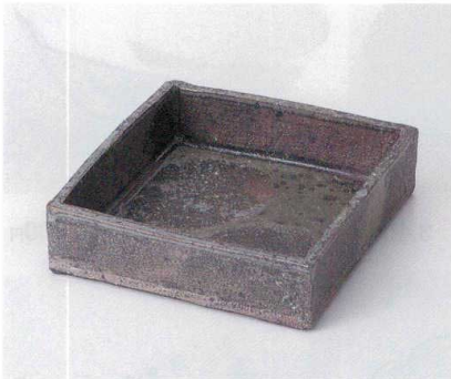
×029-04 灰釉ボタモチ四角鉢 15.5×15.5×3.5cm 4,400円