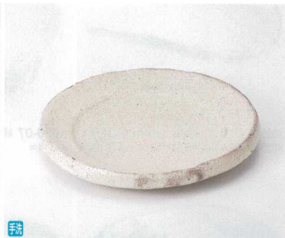
手洗 ホ029-06 粉引6.0多用皿(作家物) 18.5×2.5cm 4,000円