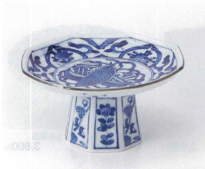
オ029-01 芙蓉高台向付 φ16.8×8.3cm 3,100円