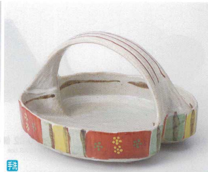
手洗 ツ029-03 赤絵小紋変形手付鉢 20.5×16×12.8cm 4,500円