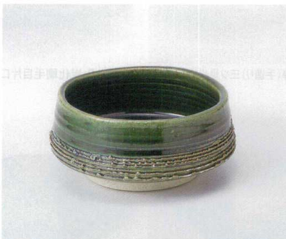
ミ029-08 ヒタ織部向付 16.5×16.5×6cm 3,850円