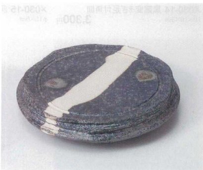
×029-12 黒窯変掛け分け5.7足付丸皿 φ17.2×3cm 3,300円