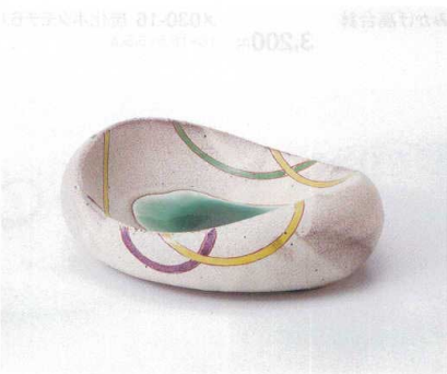
オ029-11 豆型キカ紋向付 17.2×13.3×5.5cm 2,730円