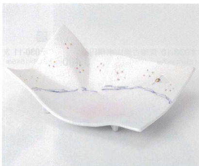
ミ029-09 ピンクラスター折紙前菜皿 22.5×16.8×8cm 3,000円