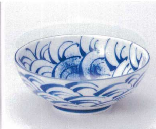
ト299-28 波紋紺吹多用丼 φ21×8cm 950円