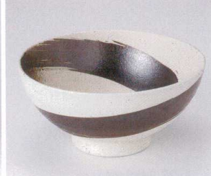
ハ299-24 志野サビ刷毛6.5麺丼 φ19.7×9.3cm 930円 ハ299-25 志野サビ刷毛5.8麺丼 φ18×9.5cm 750円