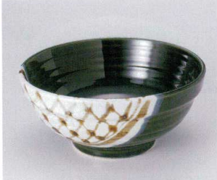
オ299-03 手筋織部6.8玉淵丼 φ20.5×9.3cm 2,030円