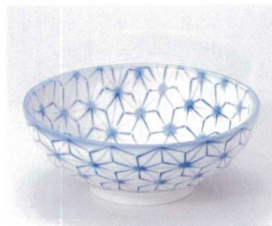
ト299-26 麻の葉多用丼 φ21×8cm 950円