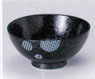
ハ299-22 丸小紋6.5麺丼 φ19.7×9.3cm 950円 ハ299-23 丸小紋5.8麺丼 φ18×9.5cm 830円