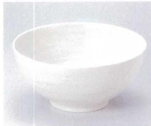
ア299-19 粉引き大井 φ21.7×10cm 1,300円