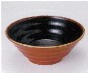
ト299-09 鳴門麺丼太閤 φ20.2×10.3cm 2,000円