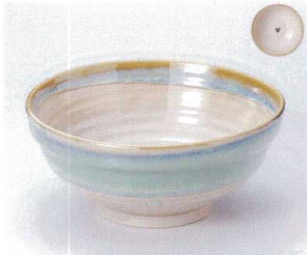
1299-01 ひすい流し6.8玉淵丼 φ20.6×9.2cm 2,100円 1299-02 ひすい流し6.0玉淵丼 φ19.2×8.5cm 1,680円