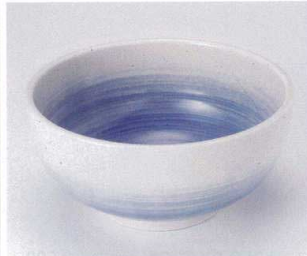
ネ299-20 朝霧6.5鉢 φ19.0×9.3cm 1,200円 ネ299-21 朝霧5.5鉢 φ17.0×8.0cm 760円