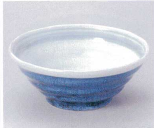
モ299-12 雪宵鳴門麺丼 φ21×8.5cm 1,900円