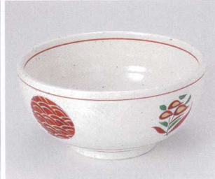
ヤ299-17 粉引釉丸紋6.0うどん鉢 φ19×9.2cm 1,450円 ヤ299-18 粉引釉丸紋5.0うどん鉢 φ17×8.2cm 1,050円