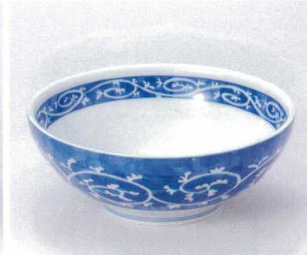
ホ299-29 古染唐草めん丼 φ21.5×8cm 920円