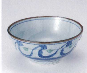
オ299-06 清海6.8玉淵丼 φ20.5×9cm 2,000円 オ299-07 清海6.0玉淵丼 φ18.5×8.5cm 1,580円