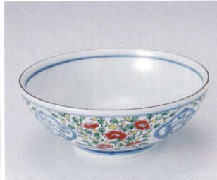
キ299-16 錦京唐津麺鉢 φ21.5×8.3cm 1,580円