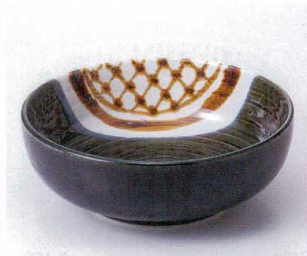
オ299-15 手筋織部6.0ボール φ18.5×8.1cm 1,840円