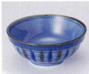
タ299-13 青釉二色十草6.8玉淵丼 φ20.5×9cm 1,800円 タ299-14 青釉二色十草6.0玉淵丼 φ19×8.4cm 1,400円