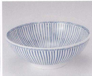
カ299-27 古染十草麺鉢 φ21.5×8cm 950円