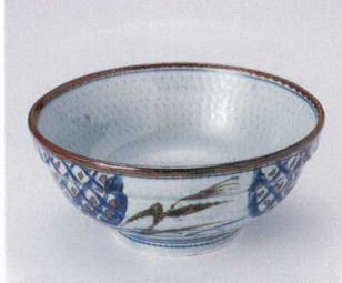
オ299-04 間取スキ6.8玉淵丼 φ20.2×9cm 2,000円 オ299-05 間取スキ6.0玉淵丼 φ18.8×8.3cm 1,580円