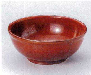
タ299-10 赤釉7.0ボール φ21.3×8.7cm 2,000円 タ299-11 赤釉6.0ボール φ18×7.3cm 1,200円