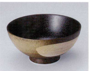
U302-22 明日香6.5鉢 φ19.5×9.5cm 1,100円