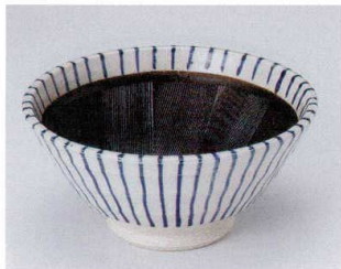
U302-10 青十草反7.0スリ鉢 φ21×10cm 2,800円