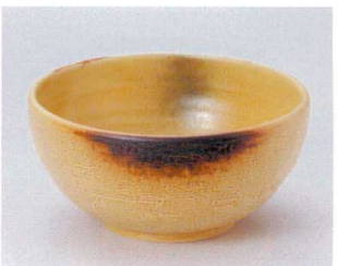
ネ302-13 黄花6.0丼 φ19.5×9.6cm 2,400円