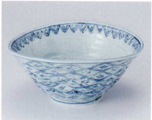
T302-04 変型ダイヤ7.0丼 21×19.5×9cm 3,450円