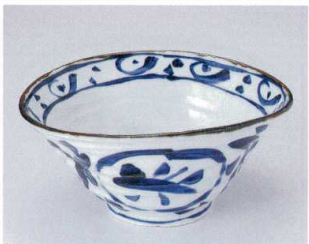
U302-12 ゴス丸紋変型6.5丼 21×19.5×9.5cm 2,400円