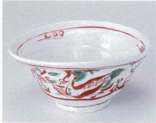
K302-03 赤絵万暦鳳凰7.0変形鉢 20.8×19.7×9.5cm 3,500円