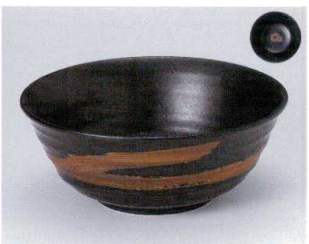
Y302-21 いぶし天目6.0うどん丼 φ19.5×8cm 1,150円