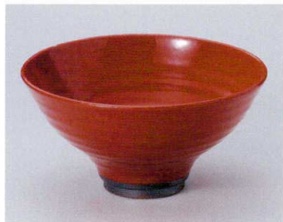
U302-05 セレン赤切立7.0鉢 φ21×11cm 3,400円