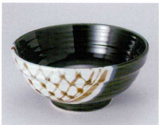
O302-18 手筋織部6.0玉刈丼 φ19.1×8.5cm 1,580円