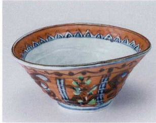
U302-02 赤絵間取草花6.5変型丼 21×19.5×9.5cm 3,700円