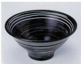
H302-14 黒うずライン6.0反丼 φ18.3×10cm 2,200円