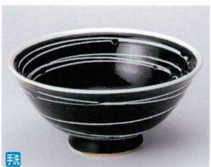
I302-16 ゆず天目潮騒反6.5丼 φ19.3×9cm 1,900円