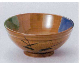
T302-17 二色芦6.0丼 φ19×8.5cm 1,800円