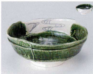
A302-07 織部流水7.0高台鉢 21.7×19.3×9cm 3,300円