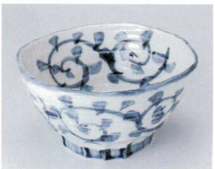
H302-09 唐草押型6.5丼 19.5×10cm 2,700円