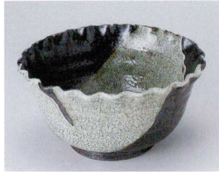
A302-01 手造りカイヤギ7.0深鉢 20.5×10.5cm 4,500円