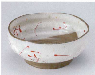
H302-08 いろは6.5丼 φ20×8.5cm 2,800円