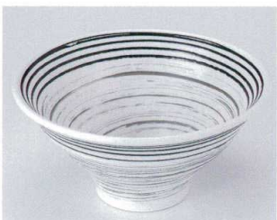
H302-15 白うずライン6.0反丼 φ18.3×10cm 2,200円