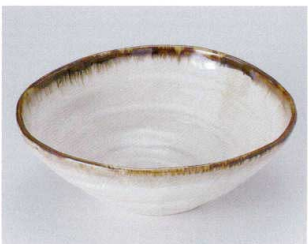
T302-19 うのふ口鑄7寸フリー丼 φ21×7.6cm 1,320円