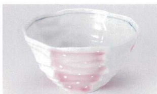
ミ305-20 ピンク吹き白ドット八角大丼 17×9cm 1,950円