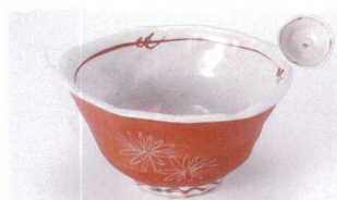
ユ305-09 赤べた菊彫変型5.5丼 17.5×9cm 2,900円