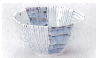
ト305-17 唐呉須面取八角大丼 φ17×9cm 2,250円