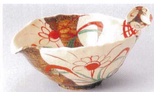
ユ305-07 白流し万暦片口6.0鉢 19.5×17.5×8.5cm 3,200円