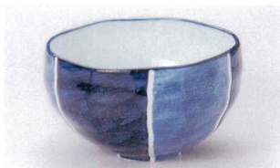
ユ305-16 呉須間取軽量5.5丼 φ16×9.5cm(軽量) 2,400円