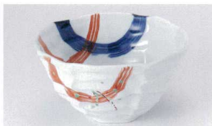
ミ305-14 錦呉須刷毛八角大丼 17×9cm 2,400円