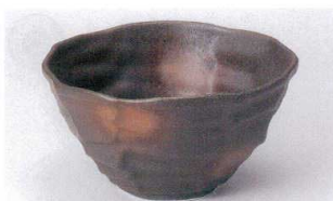
ミ305-21 黒伊賀備前吹八角大丼 17×9cm 1,850円