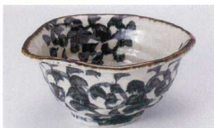
オ305-12 タコ唐草変型5.5鉢 19.5×18.5×9cm 2,750円