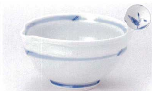
オ305-03 つゆ草片口小丼 17.5×16.5×9.5cm 3,300円