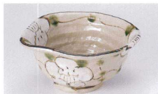
ア305-13 山茶花変型6.0丼 19.5×18.5×9.2cm 2,700円