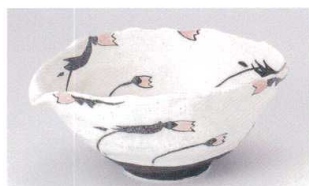
ト305-05 ほたるぶくろ片口深鉢 19×17.5×8.5cm 3,250円