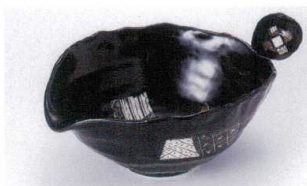
オ305-04 黒織部片口深鉢 19.5×17.5×8.5cm 3,400円