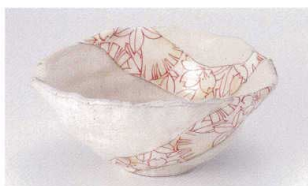
ユ305-06 京春秋片口6.0鉢 19.5×17.5×8.5cm 3,200円