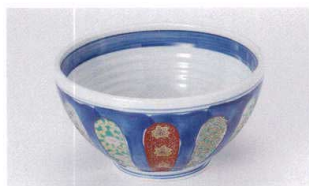
ト305-01 祥瑞6.0丼 φ18.4×10cm 3,100円