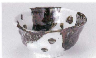
タ305-19 唐津変形6.0丼 19×18.5×9cm 2,100円