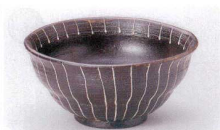
ユ305-11 黒南蛮一珍6.0丼 φ17.5×8.5cm 2,800円