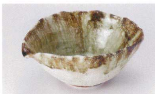
ユ305-08 灰釉流し片口6.0鉢 19.5×17.5×8.5cm 2,800円