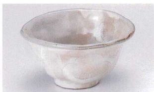
ホ305-23 もえぎ茶5.8丼 φ18×8cm 1,650円