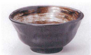
ユ305-24 御本手椿彫変型5.5丼 φ17×9cm 1,500円