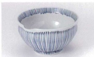
オ305-02 細十草片口5.5鉢 17.3×6.5×9.7cm 3,350円