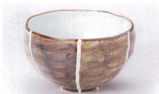
ユ305-15 錆間取軽量5.5丼 φ16×9.5cm(軽量) 2,400円