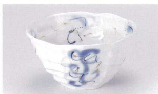
ア305-10 せきらん八角たもり鉢大 φ17.2×9cm 2,850円