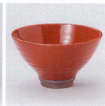
Y330-12 セレン赤切立4.2鉢 φ13×7.5cm 1,500円