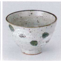
K330-16 椿茶漬井 φ12.5×8.8cm 1,400円