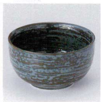
A330-34 刷毛多用碗 φ13×7.2cm 480円