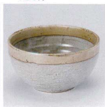
A330-35 粉引多用碗 φ12.6×7.1cm 480円