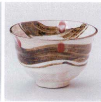
Y330-10 俳画4.5井 φ12.5×8cm 1,600円