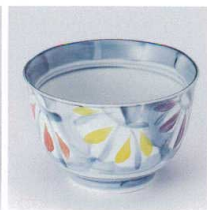
T330-23 三色菊4.3多用碗 φ12.5×8cm 1,200円