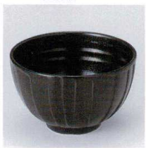
K330-33 D1黒そぎ多用井 φ12.6×7.7cm 630円