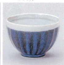
M330-30 雪宵けすり十草4.2井 φ12.5×8.4cm 750円