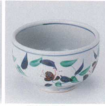
N330-04 唐草4.0多用井 φ12.5×7.5cm 1,900円