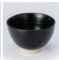
T330-24 天目一膳飯碗 12.5×7.5cm 880円