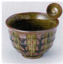
Y330-21 益子錆十草4.2深井 φ12.5×8.5cm 1,200円