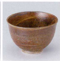
N330-17 鉄釉多用小井 φ12.5×8.5cm 1,400円