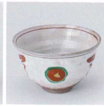
Y330-06 赤絵丸紋4.5井 φ12.5×8cm 1,700円