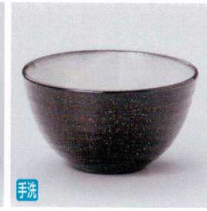
T330-05 黒土中化粧小粋井 φ12.5×7cm 1,750円