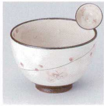
Y330-08 さくら夏目4.5井 φ12.5×8cm 1,600円