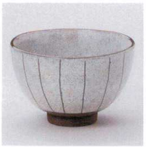
N330-19 白雪十草多用井 φ12.5×8.0cm 1,250円