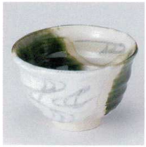
Y330-07 織部流水4.5井 φ12.5×8cm 1,600円