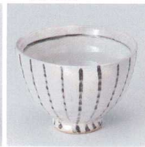
T330-11 粉引十草たもり碗 φ12.5×8.7cm 1,500円