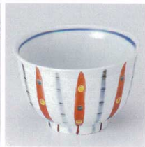
T330-22 水玉十草4.3多用碗 φ12.5×8cm 1,200円