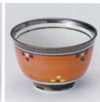
T330-18 赤巻小花4.3多用碗 φ12.5×8cm 1,350円