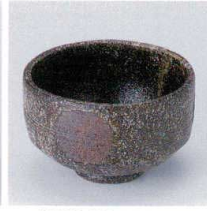
M330-03 備前風丸紋多用碗 φ12.5×7.8cm 1,950円