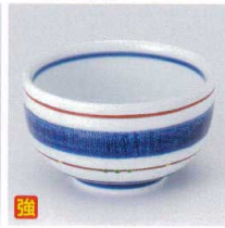
K330-09 駒筋4.0夏目井 φ12×7.4cm 1,600円