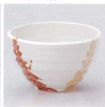
Y330-29 しのめ(白)4.5井 φ13×8cm 750円