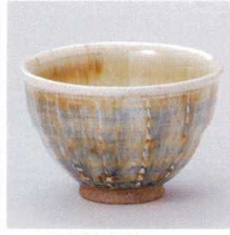
Y330-02 三彩流し4.5深井 φ12.5×8.5cm 2,000円