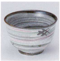
T330-26 粉引井桁多盛碗 φ12.5×7.8cm 850円