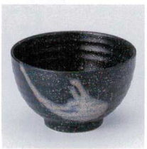
A330-32 黒彩4.3多用井 φ12.3×7.8cm 650円