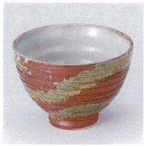
T330-14 赤釉織部掛けお茶漬碗 φ12.5×8.5cm 1,500円