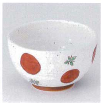
M330-27 朱丸紋4.0井 12.5×7.5cm 820円