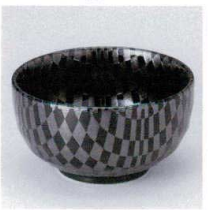
K330-31 市松黒4.1多用井 φ12.8×7cm 680円