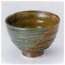
T330-13 半掛織部たもり碗 φ12.5×8.7cm 1,500円