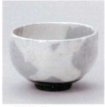
M330-01 粉引流し変形多用碗 φ12.9×8cm 2,100円