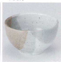
N330-36 川面4.0井 φ12.5×7.2cm 480円