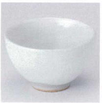
T330-25 粉引一膳飯碗 φ12.5×7.5cm 880円