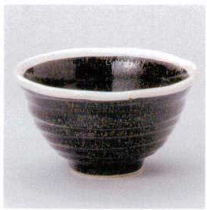
Y330-20 金吹白化粧反4.5井 φ12.5×8.5cm 1,200円