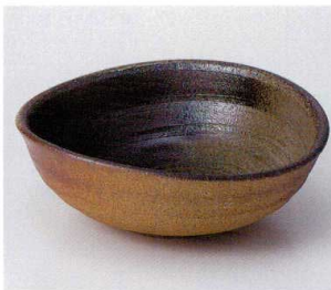
ネ036-07 黒いぶし厚楕円中鉢 17.8×16.5×6cm