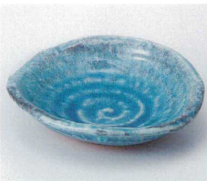
オ036-14 トルコカイヤギなぶり平鉢 17.5×16×4.5cm