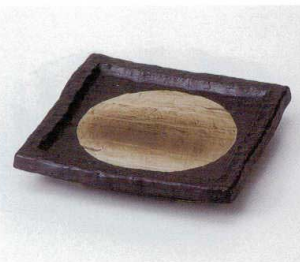
ト036-06 春月角楕円前菜皿 17.5×17.5×3cm