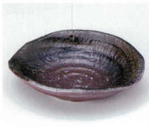
ツ036-05 備前なぶり手5.0鉢 17.5×16×4cm