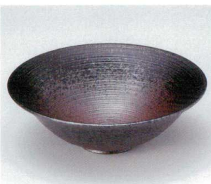
ツ036-18 備前くしめ5.0向付 φ16×5cm