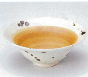
ツ036-10 サビ散らし5.0向付 φ15.5×5.7cm