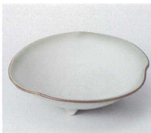
口036-19 葵三ツ足6.0鉢 φ18.4×5.5cm