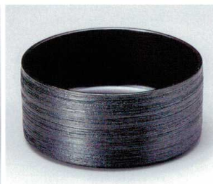
ト036-20 銀吹クシメ切立向付 φ13.3×6cm