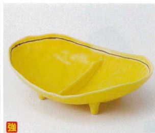
ア036-04 黄釉仕切四つ足鉢 19.5×14×5.5cm