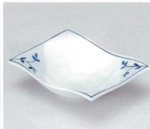
ア036-08 小枝四方向付 16×12.3×4.2cm