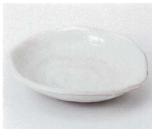
ツ036-13 粉引なぶり5.0鉢 18×16×4.5cm