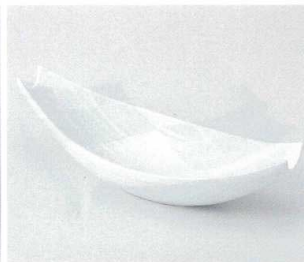
ツ036-16 白釉舟型向付 25.3×10×7.3cm