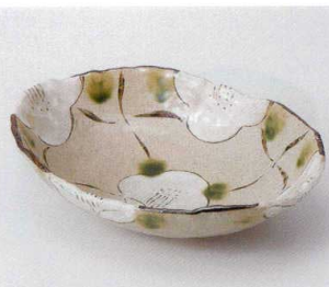
ツ036-02 格子花楕円鉢 21.3×15.3×5.5cm