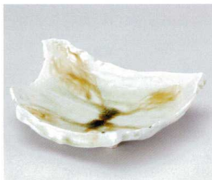
ト036-09 グリーンビードロちぎり皿 21×16×6cm