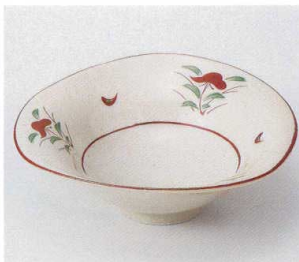
テ036-15 粉引三ツ花なぶり向付 φ15.5×5.3cm