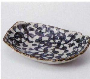
オ036-03 タコ唐草楕円皿 22×15×4.7cm