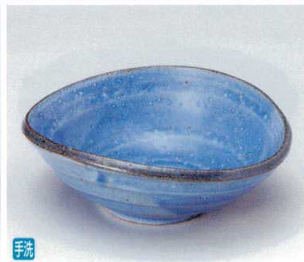
テ036-12 甲斐壁楕円鉢 16×14.3×5.5cm