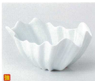
ア036-17 青白磁シャコ貝鉢 17.5×13×9cm