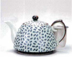
ソ372-04 古染小花散新ポット(U) 500cc(有田焼) 2,250円