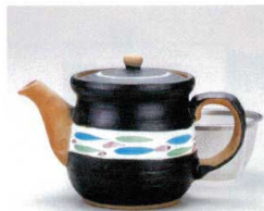
ソ372-16 清流黒ポット(大)(アミ付) 460cc 3,000円