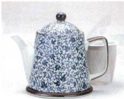
ソ372-08 古染つる唐草ポット(U) 380cc(有田焼) 2,250円