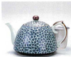
ソ372-11 古染花詰新ポット(U) 500cc(有田焼) 2,250円