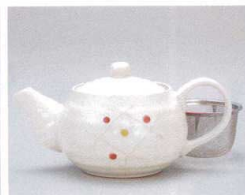
ソ372-27 マット椿ポット φ11.6×9.8cm(440cc)(6入) 2,400円