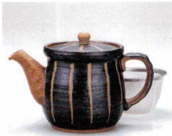
ソ372-14 紺十草ポット 460cc 3,150円