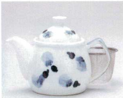
ソ372-25 染付ナスポット(茶コシ付) 10.5×12cm(450cc) 2,550円