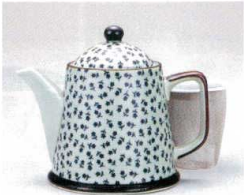
ソ372-09 古染小花散しポット(U) 380cc(有田焼) 2,250円