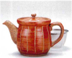
ソ372-15 赤十草ポット 460cc 3,150円