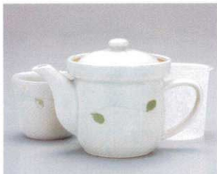
ソ372-30 ラズベリーネーポット(アミ付) φ10×11cm(360cc) 3,000円