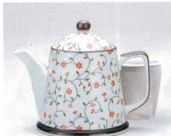
ソ372-07 古染錆唐草(赤)ポット(U) 380cc(有田焼) 2,250円