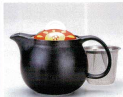
ソ372-22 ひまわりポット(網付) 620cc 2,770円