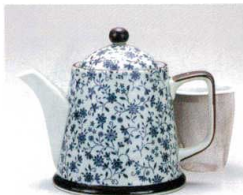
ソ372-06 古染スイートポット(U) 380cc(有田焼) 2,250円