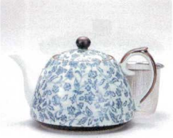
ソ372-05 古染花唐草新ポット(U) 500cc(有田焼) 2,250円