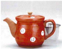
ソ372-13 赤いろはポット(茶コシ付) 500cc 3,600円