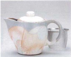
ソ372-20 御本手桜ポット(アミ付) 460cc 3,000円