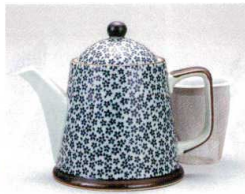
ソ372-12 古染花詰ポット(U) 380cc(有田焼) 2,250円