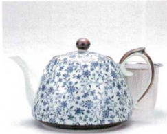
ソ372-01 古染スイート新ポット(U) 500cc(有田焼) 2,250円