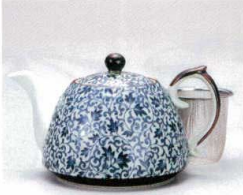
ソ372-03 古染つる唐草新ポット(U) 500cc(有田焼) 2,250円