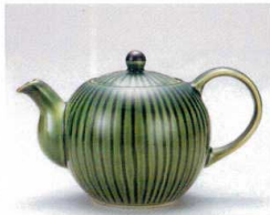
ソ372-24 織部ソギ新型ポット 17.5×10.2×10.5cm(570cc) 2,700円