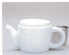
ソ372-26 白磁イエローポット 18×10×8.5cm(340cc) 2,650円