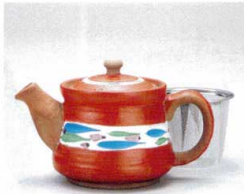
ソ372-19 清流赤ポット(小)アミ付 330cc 3,000円