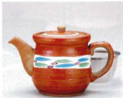
ソ372-18 清流赤ポット(大)アミ付 460cc 3,000円