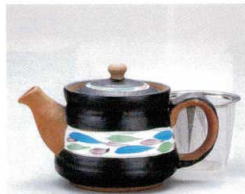
ソ372-17 清流黒ポット(小)(アミ付) 330cc 3,000円