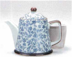
ソ372-10 古染花唐草ポット(U) 380cc(有田焼) 2,250円