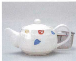
ソ372-28 マット梅ポット φ11.6×9.8cm(440cc)(6入) 2,400円