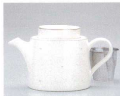
ソ372-21 OVALミルクポット φ19×10.7cm(437cc)(3入) 2,800円