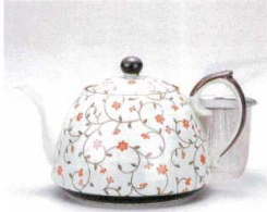
ソ372-02 古染錆唐草(赤)新ポット(U) 500cc(有田焼) 2,250円