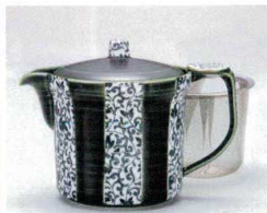
ソ372-29 織部十草ポット 15.5×10.5×11cm(6入) 2,200円