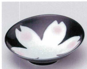
ミ039-09 黒釉桜花スロープ向付 16×15.6×5cm 1,300円