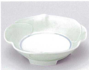
ミ039-02 若草多葉鉢 φ15×4.3cm 1,400円