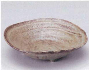
ミ039-11 窯変三ツ足70鉢 φ20.5×5cm 1,300円