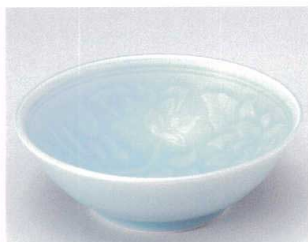
モ039-19 青白磁唐草向付 φ16×5.5cm 1,200円