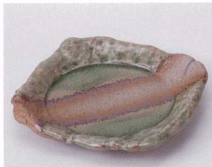
ウ039-10 織部石庭向付 16.4×16.2×2.6cm 1,300円