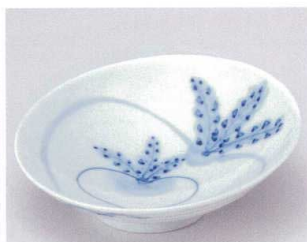
ミ039-14 手書きかぶらスロープ向付 16×15.6×5cm 1,200円