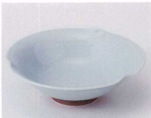
ホ039-07 青磁三ツ押鉢 φ16.5×5cm 1,370円