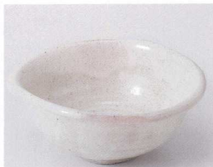
タ039-20 白灰流深小鉢 16×14.2×6.7cm 1,150円