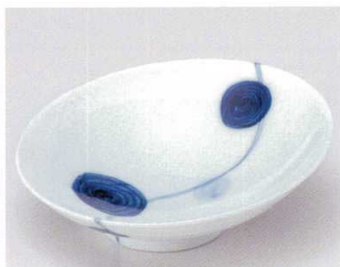
ミ039-15 つなぎ水玉スロープ向付 16×15.6×5cm 1,200円