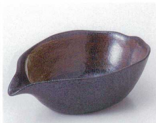
タ039-16 黒結晶片口大鉢 20×13.7×6cm 1,260円