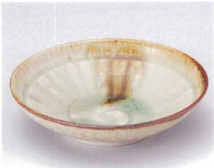
ネ039-03 伊賀ビードロ5.5浅鉢 φ17×4.3cm 1,400円