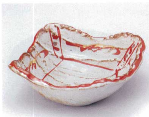
ハ039-01 荒ソギ刺身鉢 14.5×14.5×5.8cm 1,300円