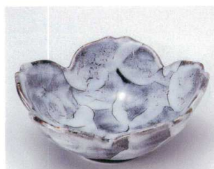
テ039-13 黒たたきさくら型平鉢 φ14.5×5.5cm 1,200円