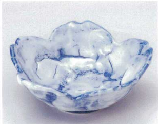
テ039-12 青たたきさくら型平鉢 φ14.5×5.5cm 1,200円