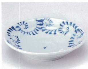
ア039-05 手造り唐草青平鉢 φ15.5×4cm 1,300円