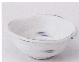
タ039-18 化粧流深小鉢 16.2×14.6×6.8cm 1,200円