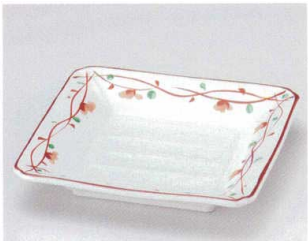
ミ039-08 つる花正角和皿 17.2×17.2×3cm 1,300円