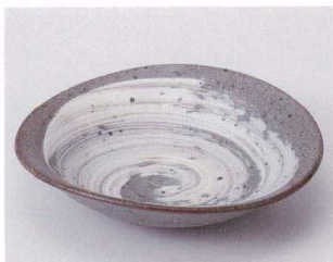
ネ039-06 粉引刷毛楕円向付 16.2×16.2×3.8cm 1,400円