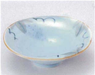
ミ039-04 手書きぶどうなぶり向付 15.6×15.2×5.3cm 1,300円