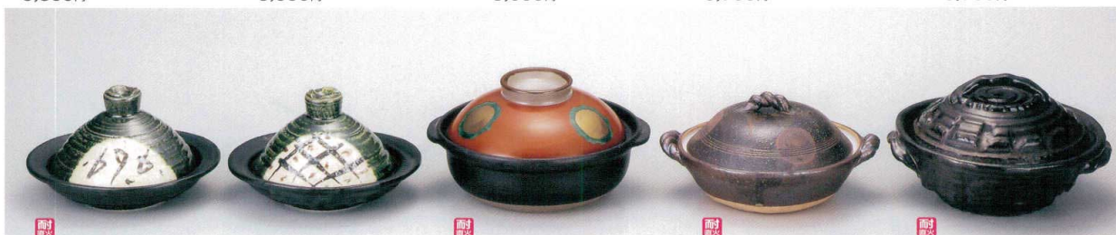
ミ397-11 耐熱絵織部蓋付陶板鍋 18.5×17×11cm 3,400円