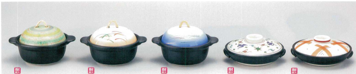
カ397-01 五色カスリ耳付深鍋(蓋強化) 17×14×9cm 3,650円