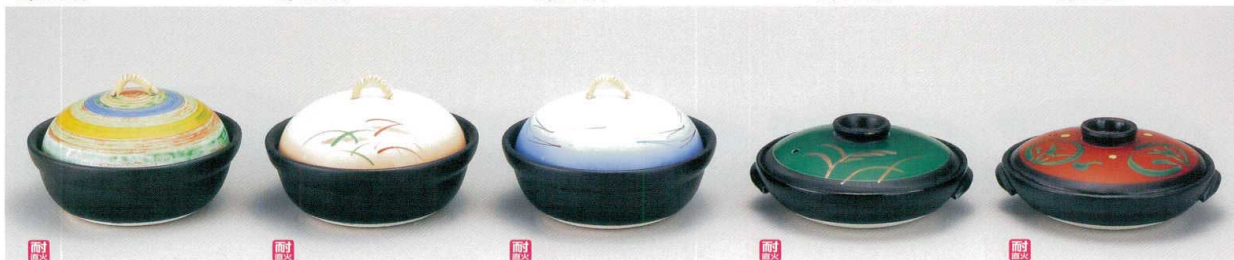
カ397-06 五色カスリ会席鍋(蓋強化) 15.5×8.8cm 3,800円