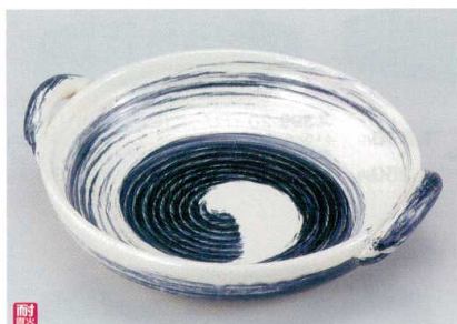
ス400-14 呉須刷毛目手付陶板10号(超耐熱) 33.5×φ29×9cm(萬古焼) 4,400円 ス400-15 呉須刷毛目手付陶板8号(超耐熱) 28×φ24.5×6cm(萬古焼) 3,350円