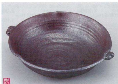
ス400-22 鉄結晶手付耐熱鉢(大) 28×φ25×7cm(萬古焼) 4,200円 ス400-23 鉄結晶手付耐熱鉢(小) 24×φ21×6cm(萬古焼) 3,000円