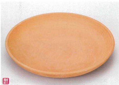
ス400-05 超耐熱ホーロク12号 φ37×4cm(萬古焼) 5,800円 ス400-06 超耐熱ホーロク10号 φ30×4cm(萬古焼) 3,700円 ス400-07 超耐熱ホーロク8号 φ24×3cm(萬古焼) 2,250円