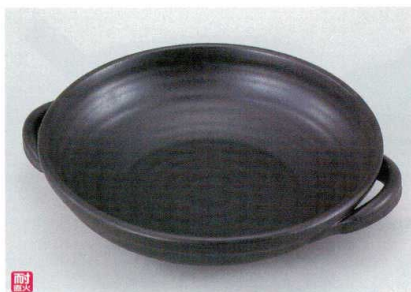
ス400-08 黒(超耐熱)10号手付バエリアパン 33.5×φ30×7.3cm(萬古焼) 4,400円 ス400-09 黒(超耐熱)8号手付バエリアパン 28×φ24.5×6.3cm(萬古焼) 3,000円