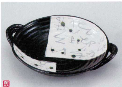
ミ400-01 黒織部いろは10号手付浅鍋 36×29.5×7.5cm 5,600円 ミ400-02 黒織部いろは8号手付浅鍋 28.5×24×7.8cm 3,850円