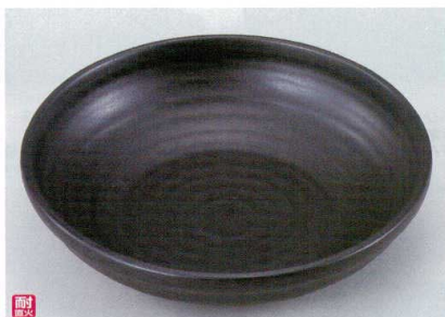
ス400-16 黒(超耐熱)10号バエリアパン手なし φ30×7.3cm(萬古焼) 4,300円 ス400-17 黒(超耐熱)8号バエリアパン手なし φ24.5×6.3cm(萬古焼) 2,500円