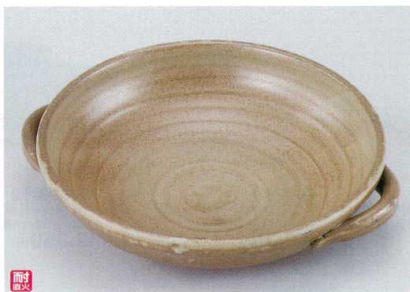
ス400-10 茶(超耐熱)10号手付バエリアパン 33.5×φ30×7.3cm(萬古焼) 4,400円 ス400-11 茶(超耐熱)8号手付バエリアパン 28×φ24.5×6.3cm(萬古焼) 3,000円