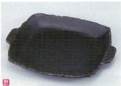
ス400-12 ブラックスクエア皿10号(超耐熱) 34.5×30.5×2.5cm(萬古焼) 4,200円 ス400-13 ブラックスクエア皿8号(超耐熱) 28.3×24.5×2.5cm(萬古焼) 2,600円