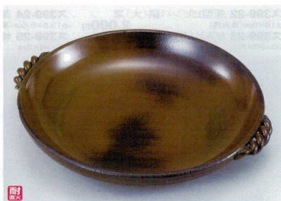
ス400-24 灰釉10号耐熱皿 33.5×φ30.5×5cm(萬古焼) 3,400円 ス400-25 灰釉8号耐熱皿 28×φ26×4.3cm(萬古焼) 2,300円 ス400-26 灰釉7号耐熱皿 25×φ22×3.5cm(萬古焼) 1,700円