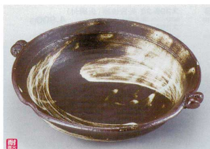
ス400-20 唐津刷毛目手付耐熱鉢(大) 28×φ25×7cm(萬古焼) 4,200円 ス400-21 唐津刷毛目手付耐熱鉢(小) 24×φ21×6cm(萬古焼) 3,000円