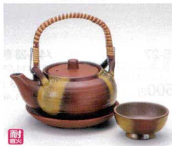
ス406-26 鉄彩丸型土瓶むし(耐熱) 350cc(中国) 1,750円