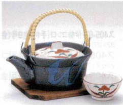
ウ406-08 古代花土瓶むし 16×8cm(300cc) 3,070円 ウ406-09 土瓶むし焼杉台 450円