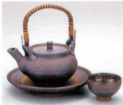
×406-02 南蛮花型土瓶むし 270cc 6,000円