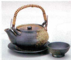
ス406-18 備前風土瓶むし φ11.5×6.3cm(320cc)(萬古焼) 2,550円