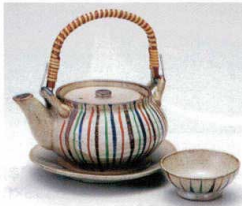
ス406-14 十草土瓶むし 300cc(萬古焼) 3,000円