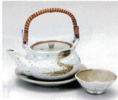
ス406-16 錆刷毛絵土瓶むし 280cc(萬古焼) 2,850円