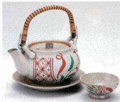
ス406-13 赤絵方唇土瓶むし φ11.5×6.3cm(320cc)(萬古焼) 3,100円