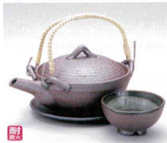
ス406-06 南蛮京風土瓶むし(超耐熱) 260cc(萬古焼) 3,300円