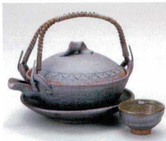
×406-01 南蛮平型土瓶むし 300cc 6,800円