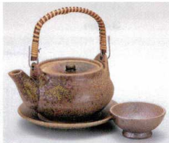
ス406-19 伊賀釉土瓶むし φ11.5×6.3cm(320cc)(萬古焼) 2,550円