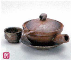
ス406-05 焼締急須型土瓶むし(超耐熱・手造り) 260cc(萬古焼) 5,000円