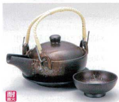
ス406-23 伊賀風碗型土瓶むし(耐熱) 200cc(中国) 2,100円