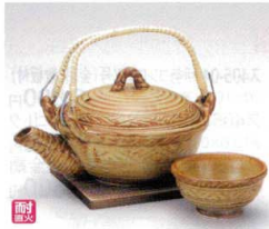
ス406-10 青イラボ碗型土瓶むし φ13×10cm(250cc)(萬古焼) 2,900円