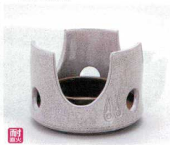
ス406-30 梨地土瓶むし用コンロ(火入付) 9.8×7×7cm 1,600円