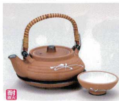
ス406-29 耐熱松葉土瓶むし 200cc(中国) 1,600円