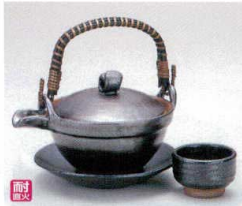
ス406-04 鉄結晶京型土瓶むし(超耐熱・手造り) 260cc(萬古焼) 5,000円