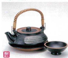
ス406-28 天目平丸土瓶むし(耐熱) 200cc(中国) 1,600円