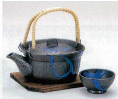
ウ406-21 天目青流土瓶むし 16×8cm(300cc) 2,470円 ウ406-22 土瓶むし焼杉台 440円