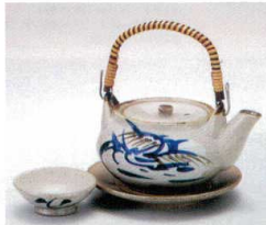
ス406-20 芦絵土瓶むし 320cc(萬古焼) 2,550円