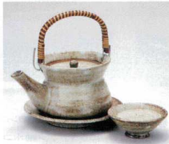
ス406-15 むさしの巾着土瓶むし 260cc(萬古焼) 2,850円