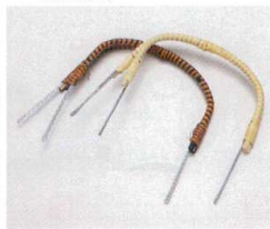
ス406-33 土瓶むし用三又ツル茶 31cm 230円 ス406-34 土瓶むし用三又ツル白 31cm 210円