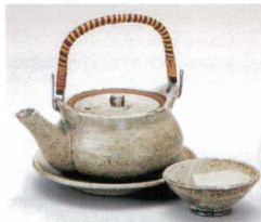
ス406-17 むさしの丸土瓶むし 250cc(萬古焼) 2,800円