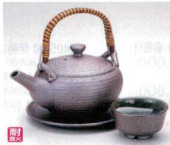
ス406-07 南蛮鉄鉢無地土瓶むし(超耐熱) 300cc(萬古焼) 3,300円