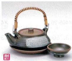
ス406-27 綿部平型土瓶むし(耐熱) 200cc(中国) 1,600円