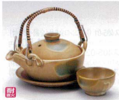
ス406-11 黄瀬戸京型土瓶むし(超耐熱) 240cc(萬古焼) 2,750円