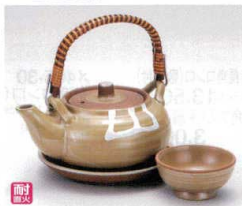
ス406-25 イラボ丸型土瓶むし(耐熱) 350cc(中国) 1,750円