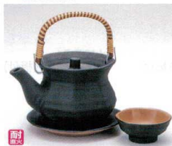
ス406-24 吹天目土瓶むし(耐熱) 260cc(中国) 1,900円