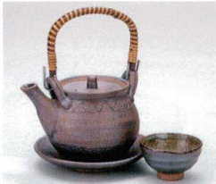
×406-03 南蛮丸型土瓶むし 230cc 5,830円