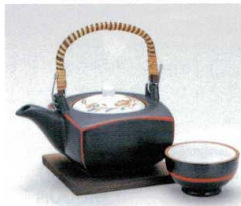
ス406-12 天目赤絵角土瓶むし 250cc(萬古焼) 3,200円