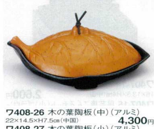
7408-26 木の葉陶板(中)(アルミ) 22×14.5×H7.5cm(中国) 4,300円