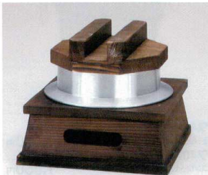
7408-15 釜めしセット(大)焼杉 17.5×17.5×H14.5cm(中国) 5,700円