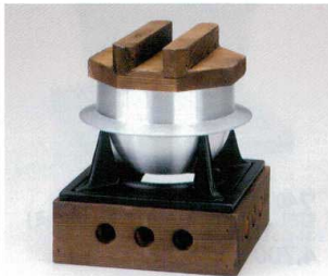
7408-17 民芸風ごんろお釜セット(1合用) 16×16×H20.5cm(中国) 9,700円