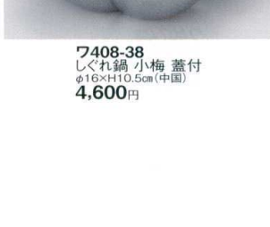
7408-38 しぐれ鍋 小梅 蓋付 φ16×H10.5cm(中国) 4,600円