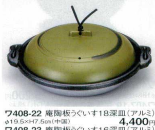
7408-22 庵陶板うぐいす18深皿(アルミ) φ19.5×H7.5cm(中国) 4,400円