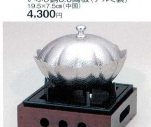
≒408-34 いぶし銅6.0陶板(アルミ製) 19.5×7.5cm(中国) 4,300円