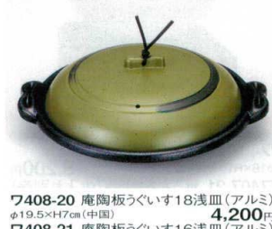
7408-20 庵陶板うぐいす18浅皿(アルミ) φ19.5×H7cm(中国) 4,200円