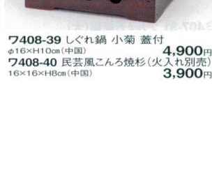
7408-39 しぐれ鍋 小菊 蓋付 φ16×H10cm(中国) 4,900円