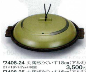
7408-24 丸陶板うぐいす18cm(アルミ) 21×19×H7cm(中国) 3,500円