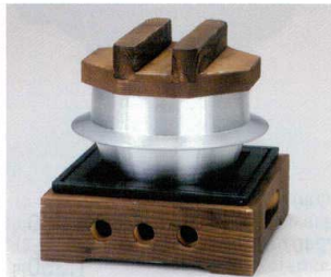
7408-18 お釜(中)0.7合 φ12×H9.5cm(中国) 3,800円