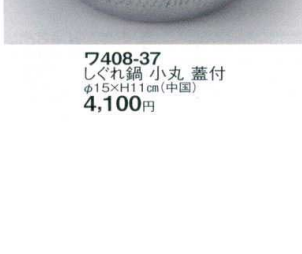
7408-37 しぐれ鍋 小丸 蓋付 φ15×H11cm(中国) 4,100円