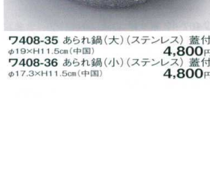
7408-35 あられ鍋(大)(ステンレス) 蓋付 φ19×H11.5cm(中国) 4,800円