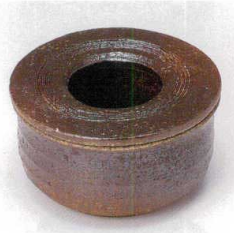
ミ413-28 手造り灰吹き灰皿 φ11.4×6.9cm 2,150円