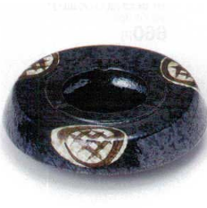
オ413-36 天日丸紋5.0灰皿 16.5×4.5cm 1,700円