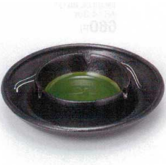
ホ413-37 ヒスイW型5.0灰皿 φ17×3.7cm 1,450円