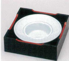
チ413-12 青白磁帽子型4.8灰皿 14.7×4.2cm 1,980円 チ413-13 青白磁帽子型3.8灰皿 11.8×3.5cm 1,300円 チ413-14 木箱4.8 15.2×5.5cm 1,650円