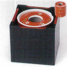
ウ413-18 朱巻武蔵野梅灰皿 8×9cm 1,900円 ウ413-19 黒塗カスター箱 10×10×10cm 1,470円