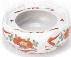
チ413-01 赤絵万暦6.0灰皿 18×7.5cm 3,550円 チ413-02 赤絵万暦5.0灰皿 15.5×6.5cm 2,800円 チ413-03 赤絵万暦4.0灰皿 12×6cm 2,350円