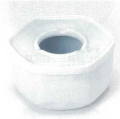
ウ413-27 青地六角灰皿 11.7×6.4cm 1,280円