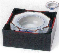
チ413-04 菊刺6.0灰皿 18×7.5cm 2,700円 チ413-05 菊刺5.0灰皿 15.5×6.5cm 2,050円 チ413-06 菊刺4.0灰皿 12×6cm 1,650円