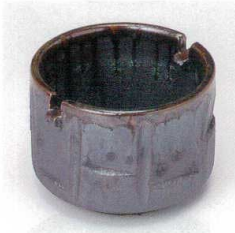
テ413-29 黒流し筒型灰皿 φ10.8×7.8cm 1,650円