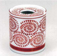
ウ413-21 赤タコ唐草灰皿 8×9cm 1,940円