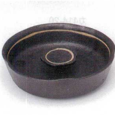
ミ413-31 黒オリベ花型6寸灰皿 φ18.3×5cm 3,200円