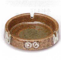
キ413-34 織部亀甲O型4.0灰皿 φ13×4cm 730円