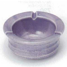
テ413-42 紫あさがお灰皿(中) φ12.7×5.7cm 1,250円 テ413-43 紫あさがお灰皿(小) φ10.6×6cm 1,050円