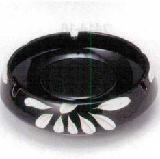
キ413-33 天目菊ヘン付5.0灰皿 φ16.5×4.5cm 1,200円