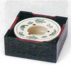
カ413-24 草魚蓋付灰皿 11×4.3cm 2,800円 カ413-25 黒塗箱 12.5×12.5×5.5cm 1,200円