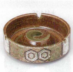
キ413-35 織部亀甲ナルミ型4.0灰皿 φ12×2.8cm 630円