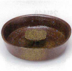
ミ413-32 備前風撫角6寸灰皿 φ18×5cm 3,200円