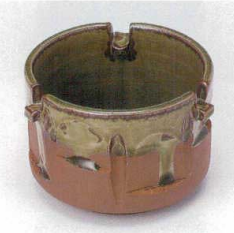
テ413-30 南蛮筒型灰皿 φ10.8×7.8cm 1,650円