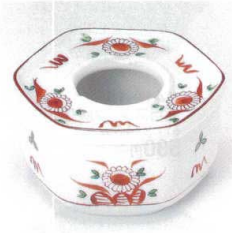
ウ413-26 赤絵花六角灰皿 11.5×6.1cm 2,100円