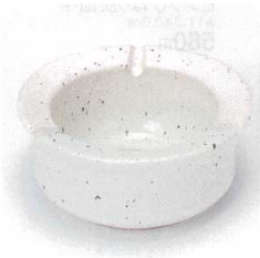
テ413-40 白砂あさがお灰皿(中) φ12.7×5.7cm 1,250円 テ413-41 白砂あさがお灰皿(小) φ10.6×6cm 1,050円