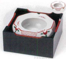
チ413-09 八角赤絵花4.0灰皿 12×6cm 2,200円 チ413-10 木箱4.0 13×6cm 1,800円 チ413-11 木箱3.8 12×5cm 1,550円