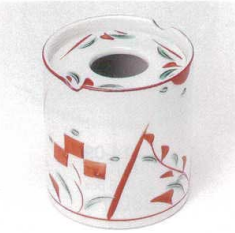
ウ413-20 赤絵花灰皿 8×9cm 2,030円