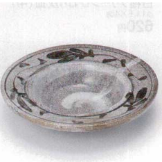
ミ413-38 カラツ6.0灰皿 φ18.8×4.4cm 1,250円 ミ413-39 カラツ5.0灰皿 φ16.2×4cm 850円