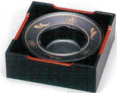
チ413-15 黒釉金4.8灰皿 15.3×5cm 1,980円 チ413-16 黒釉金3.8灰皿 12.3×2.5cm 1,550円 チ413-17 木箱4.8 15.2×5.5cm 1,650円