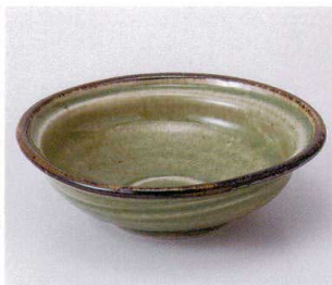
カ042-06 刷錆灰釉4.8煮物鉢 15.7×4.5cm