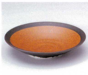
ネ042-17 夢路リップル5.0鉢 φ16.7×4.5cm