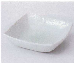
ホ042-07 グリーン吹四角中鉢 15.5×15.5×4cm