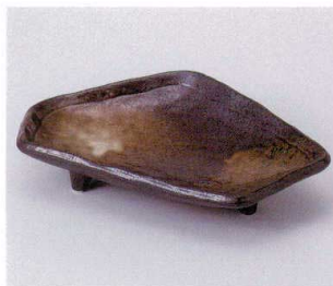
ア042-09 南蛮吹三ツ足向付 20.3×13.4×4.3cm