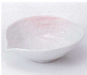
ア042-11 ピンク吹片口鉢 17×16×5.2cm