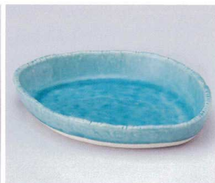
ホ042-08 トルコまゆ型鉢 20×16×3cm