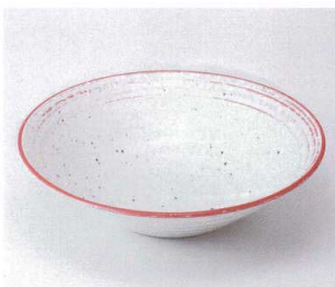
ハ042-18 朱音5.0鉢 φ16.7×4.5cm