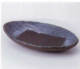
ソ042-14 黒志野四つ足楕円皿 23.5×14×4cm