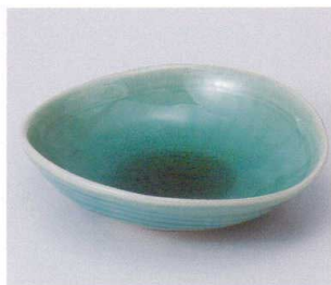
ホ042-01 ブルー5.0変形鉢 16×15×4.5cm

高台小鉢 小鉢 組小鉢 小付 蓋付珍味 珍味 セット珍味 松花堂 蓋向 円菓子碗 むし碗 ミニむし碗 天皿・ とんすい とんすい