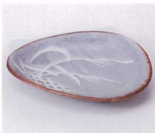
ア042-10 鼠志野三角向付 19.5×16×3cm