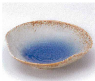
ア042-20 瑠璃変形平鉢大 φ16.5×4.1cm