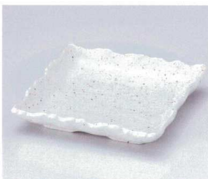
ミ042-15 萩志野チギリ正角和皿 17×17×3.5cm