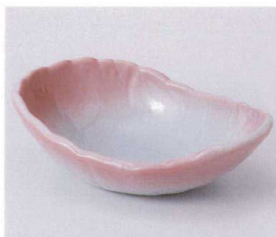
ホ042-13 ピンク吹クジラ鉢(小) 18×12.3×5.6cm