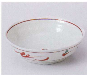
ア042-02 手描き風花5.0鉢 φ15.7×4.6cm