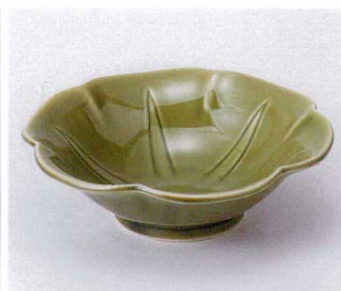
タ042-12 アサガオ織部貫入向付 15.3×15.3×4.6cm