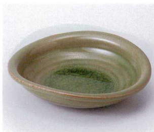
タ042-03 灰釉たわみ鉢 17.3×16×4.7cm