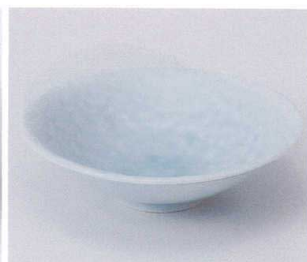
ホ042-04 青白磁岩清水向付 φ15×5cm