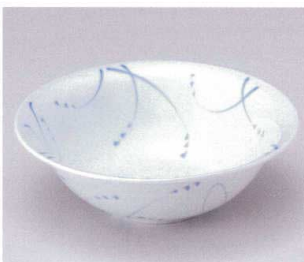
ソ042-19 草紋たわみ5.5鉢 φ19×6cm